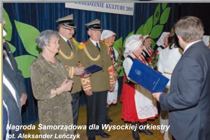
Nagroda Samorządowa dla Wysokiej orkiestry