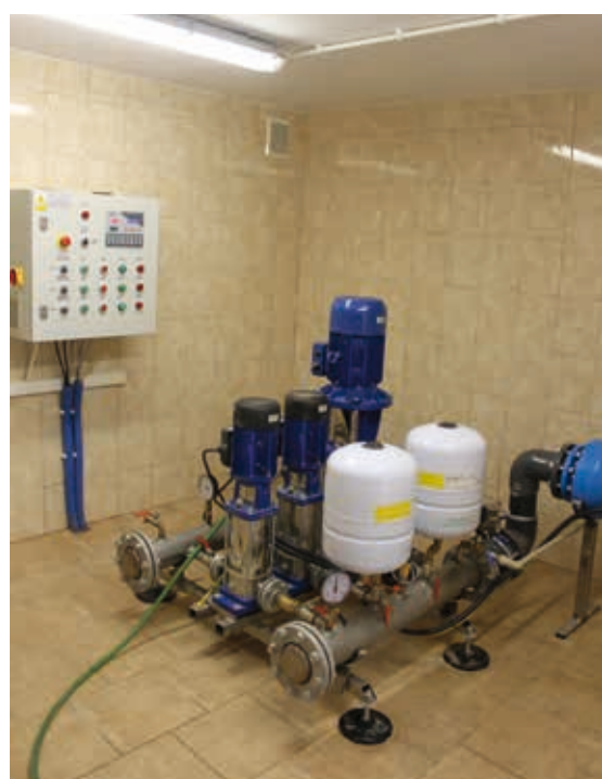
Pompownia wody w Rogóżnie - przebudowana w 2014 r.