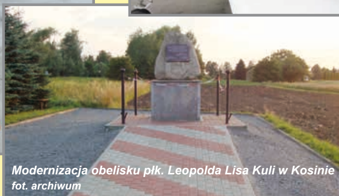
Modernizacja obelisku płk. Leopolda Lisa Kuli w Kosinie