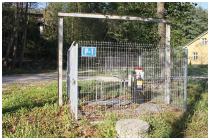
Pompownia w Handzlówce - wybudowana w 2011 r.