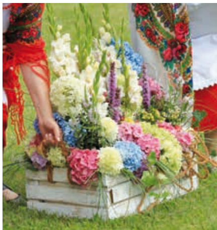
I miejsce - KGW Łańcut Przedmieście