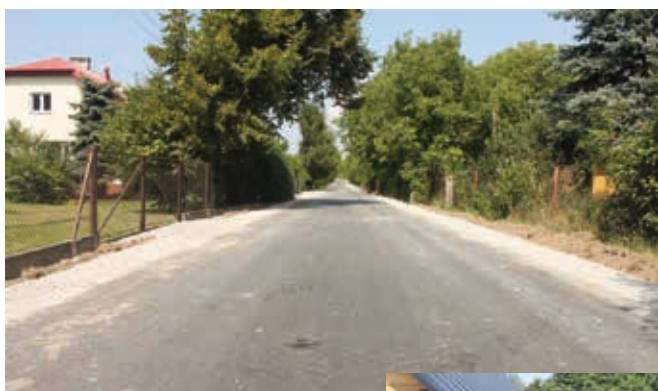
▲ Przebudowa drogi gminnej od E4 do jeziora „Cesin” w Rogóźnie 900 m, nawierzchnia bitumiczna - inwestycja zakończona