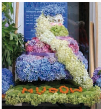
III miejsce - KGW Husów