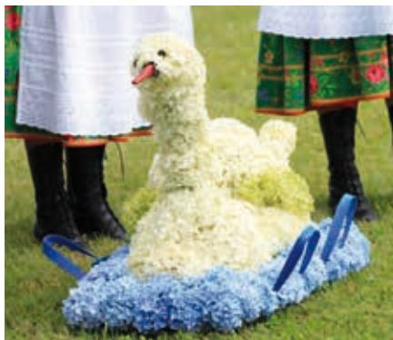
II miejsce - KGW Zasów gm. Żyraków