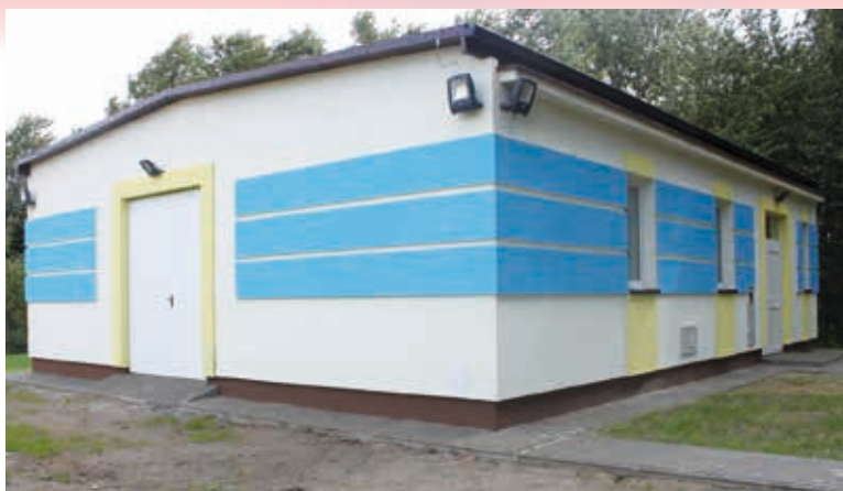
Stacja uzdatniania wody w Albigowej - przebudowana w 2013 r.