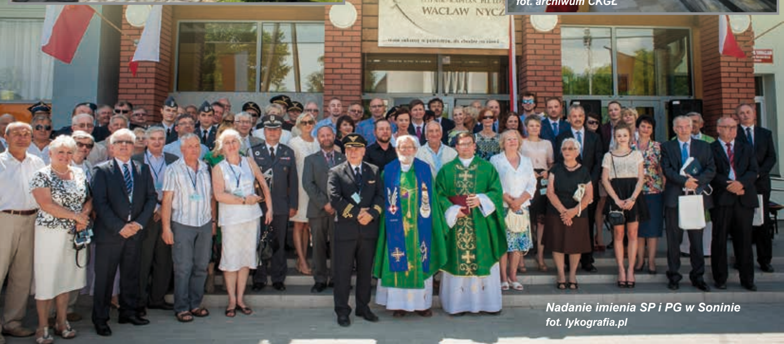
Nadanie imienia SP i PG w Soninie