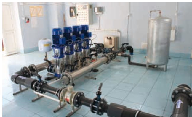
Pompownia wody w Wysokiej - przebudowana w 2013 r.