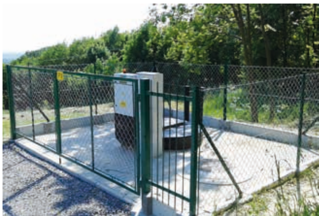
Pompownia w Albigowej Honie - wybudowana w 2015 r.