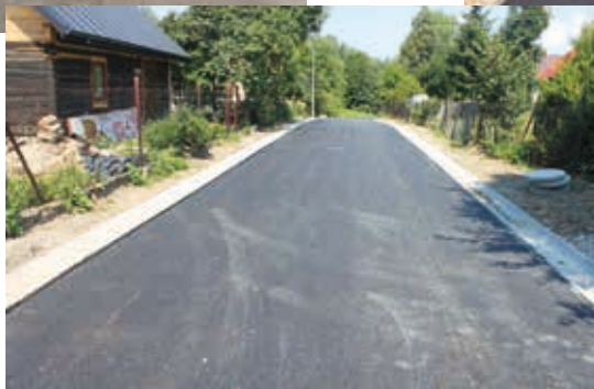
▶ Przebudowa drogi koło sklepu w Soninie 307 m, nawierzchnia bitumiczna