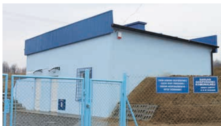
Stacja uzdatniania wody w Kraczkowej - przebudowana w 2012 r.