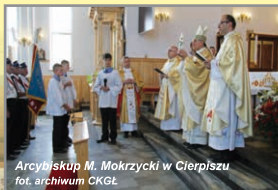
Arcybiskup M. Mokrzycki w Cierpiszu