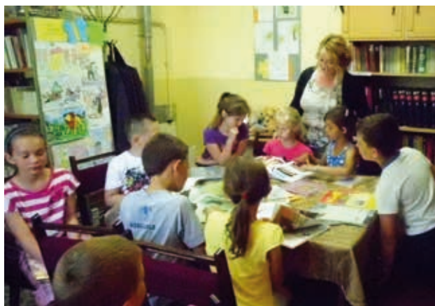
URSZULA PANTOŁA

śne czytanie fragmentów książeczek. Nie obyło się również bez rysowania i słodkiego poczęstunku. Takie spotkania dają wiele radości. Zachęcam rodziców i opiekunów do codziennego głośnego czytania dzieciom, jego efekty będą naprawdę widoczne, a wspólne chwile z książką zapoczątkują w przyszłym dorosłym życiu i pozostaną na zawsze we wspomnieniach z pięknego okresu dzieciństwa.