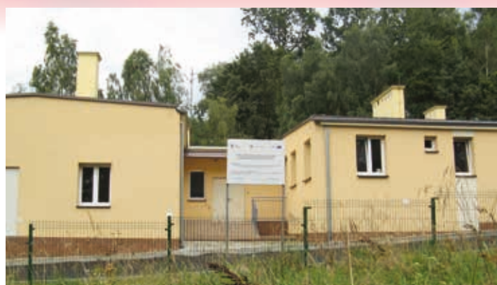
Stacja uzdatniania wody w Gluchowie - przebudowana w 2009 r.