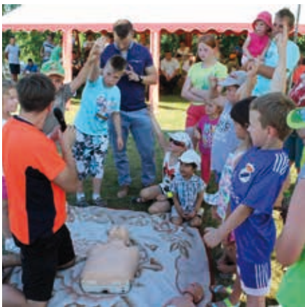
W ramach akcji „Bezpieczne i Ekologiczne Wakacje” najmłodsi uczyli się zasad udzielania pierwszej pomocy

rozpoczęcia zasiedlenia Dusowiec przez Handzlowian. Miejscowość między czasie zmieniła nazwę na Niziny i stała się częścią gminy Orły (pow. przemyski). Liczba ludności rośnie i wkrótce powinna przekroczyć 1000 osób.