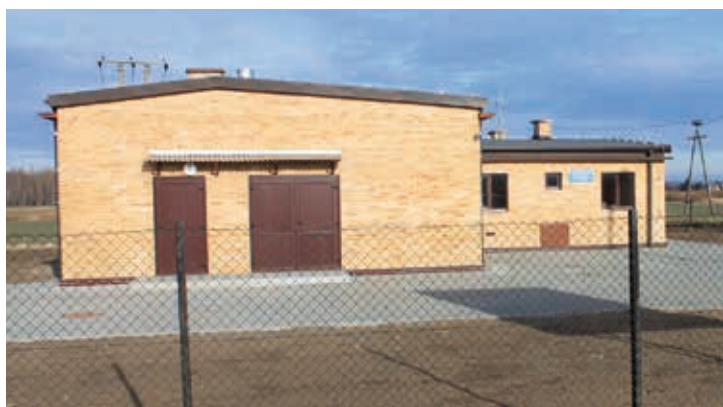
Stacja uzdatniania wody w Kosinie - przebudowana w 2014 r.