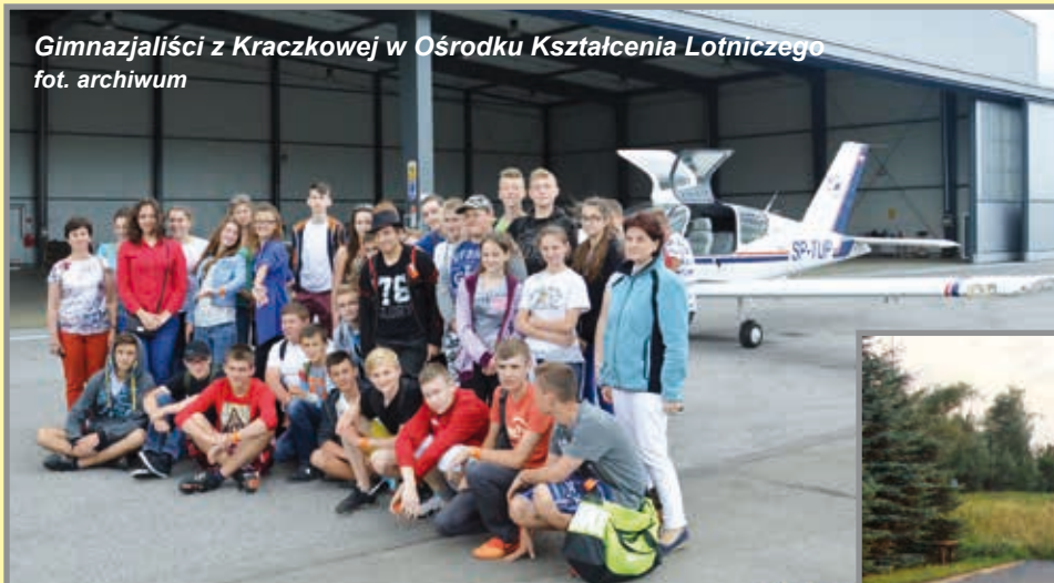
Gimnazjaliści z Kraczkowej w Ośrodku Kształcenia Lotniczego