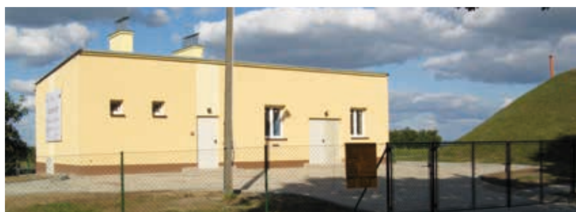
Pompownia wody w Gluchowie - przebudowana w 2009 r.