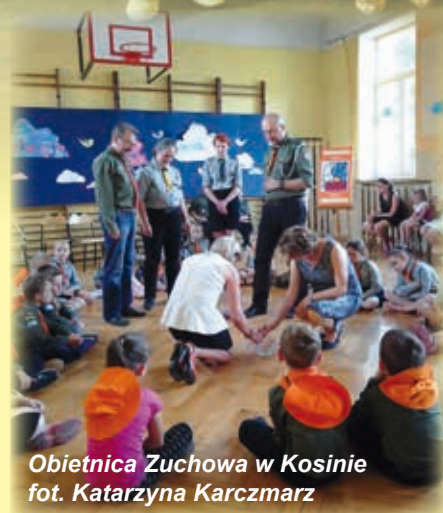
Obietnica Zuchowa w Kosinie