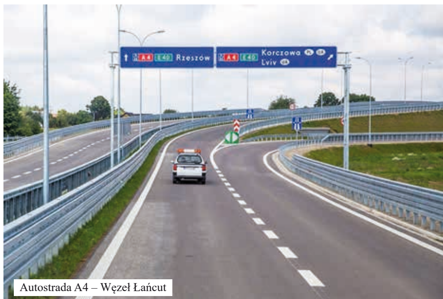
Autostrada A4 – Węzeł Łańcut