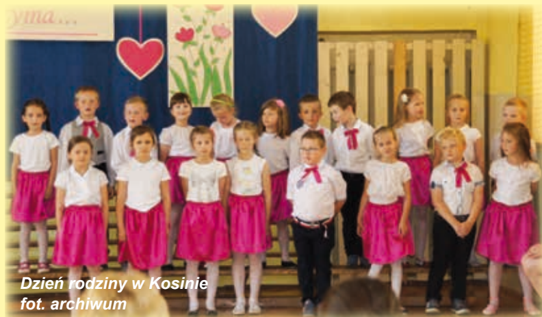
Dzień rodziny w Kosinie