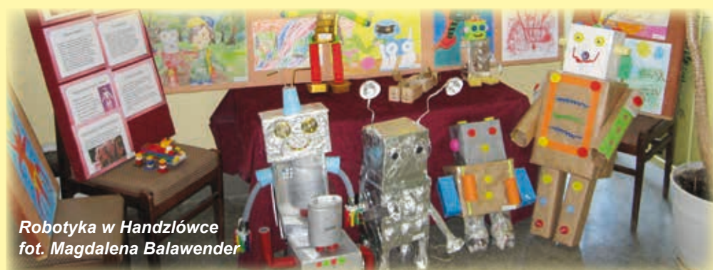
Robotyka w Handziłówce