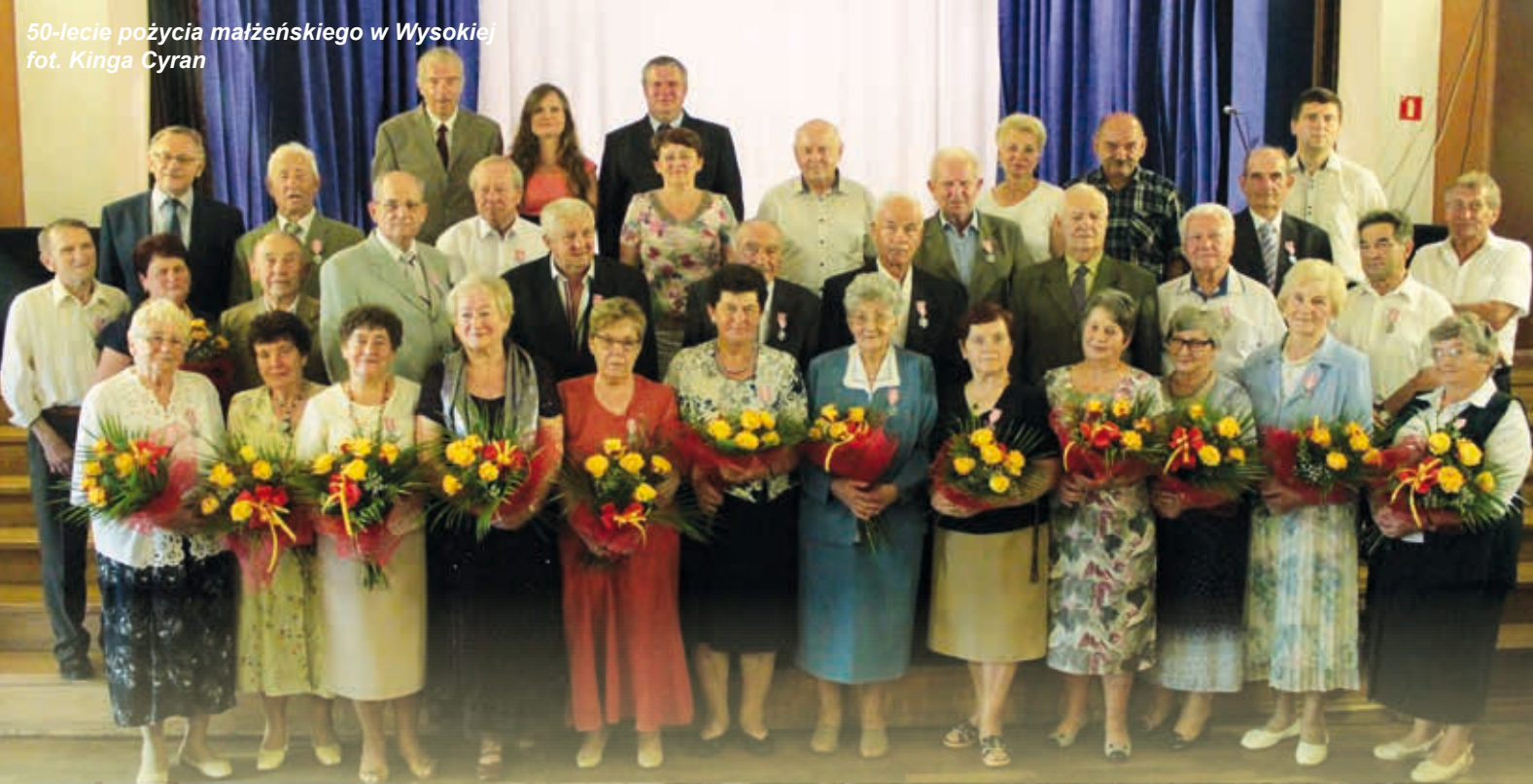
50-lecie pożycia małżeńskiego w Wysokiej