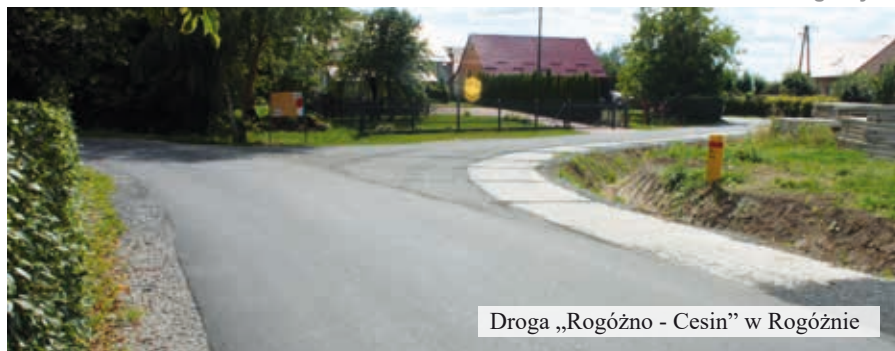
Droga „Rogóżno - Cesin” w Rogóżnie