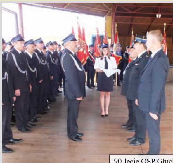
90-lecie OSP Głuchów