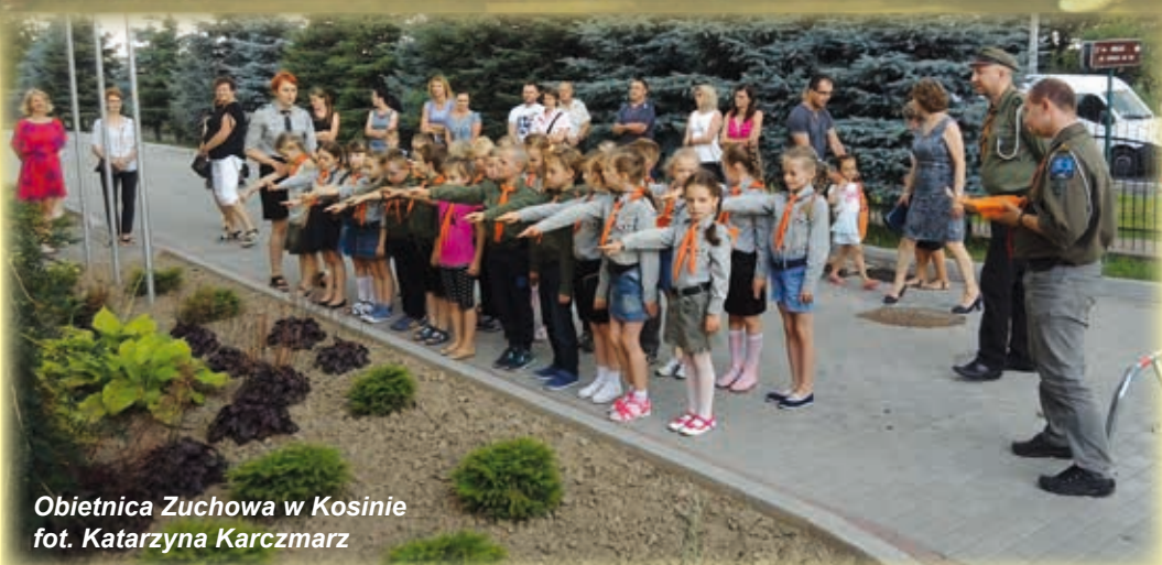
Obietnica Zuchowa w Kosinie