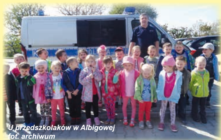
U przedszkolaków w Albigowej