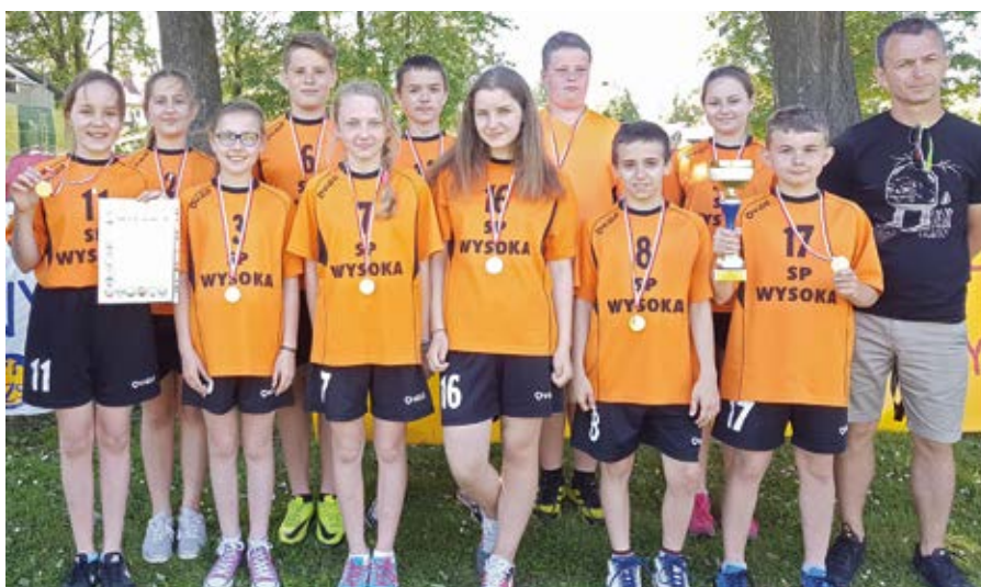
SP Wysoka - zwycięzcy wyścigów sztafetowych w kategorii szkół podstawowych