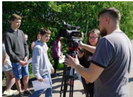
Uczniowie w ramach zajęć współpracowali m.in. z operatorami TV Łańcut.

fami i filmowcami, podczas których poznali podstawowe zasady robienia zdjęć. Elementem zajęć była prezentacja możliwości jakie w fotografii dają bezałogowe urządzenia latające tzw. drony.