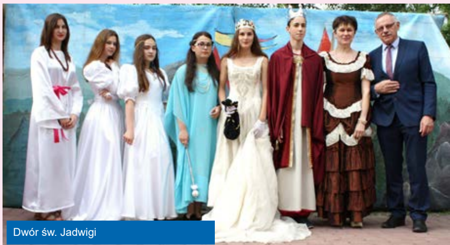
Dwór św. Jadwigi