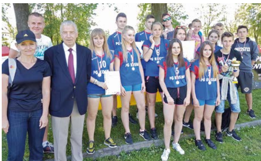
PG Kosina - zwycięzcy wyścigów sztafetowych w kategorii gimnazjów