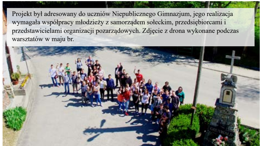
Projekt był adresowany do uczniów Niepublicznego Gimnazjum, jego realizacja wymagała współpracy młodzieży z samorządem sołectkim, przedsiębiorcami i przedstawicielami organizacji pozarządowych. Zdjęcie z drona wykonane podczas warsztatów w maju br.

W pamięci uczniów pozostaną warsztaty fotograficzne z zawodowymi fotogra-