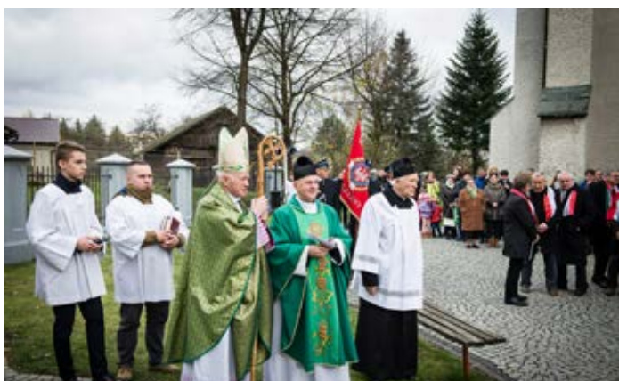
Wysoka, fot. Ryszard Kluz