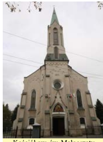
Kościół pw. św. Małgorzaty w Wysokiej