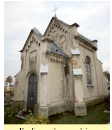
Kaplica grobowa rodziny Zabielskich w Kosinie