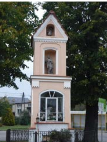
Kapliczka przydrożna w Soninie