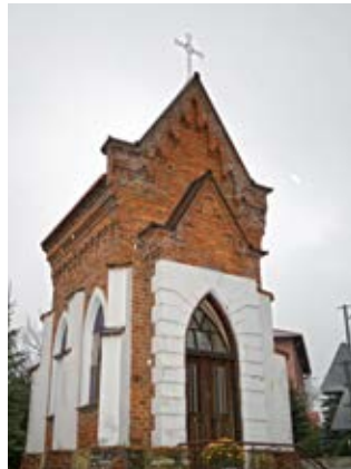
Kaplica w Handzlówce