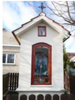
Kapliczka w Rogóźnie