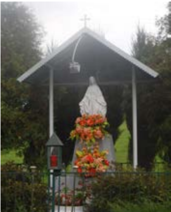
Kapliczka z figurą NMP w Głuchowie