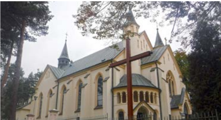
Kościół parafialny pw. św. Mikołaja w Kraczkowej