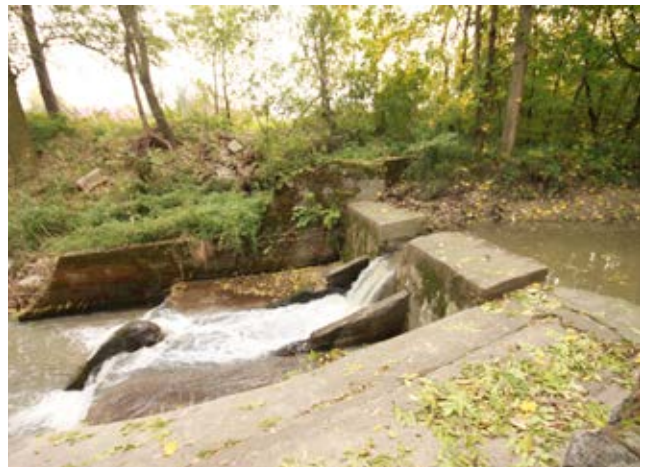
Śluza w Wysokiej