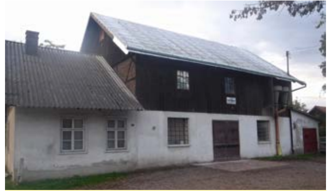
Młyn w Głuchowie