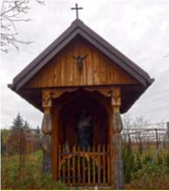
Drewniana kapliczka w Albigowej