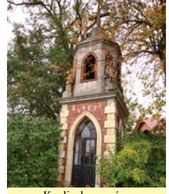
Kapliczka pw. św. Sebastiana w Soninie