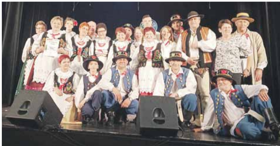
Festiwal odbywał się w dniach 20-22 września

Wyjazd na festiwal, który odbył się w Polanicy Zdroju, był możliwy dzięki wsparciu Mecenasów Kultury. (iw)