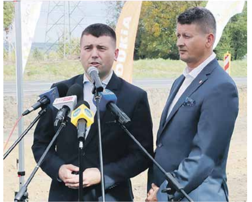
- Mamy świadomość, że lista postulatów mieszkańców była dłuższa, nie zmienia to faktu, że ostateczna wersja przebudowy DK 94 jest znacznie korzystniejsza dla gminy i Głuchowa niż ta proponowana jeszcze w 2018 r. – zaznaczył wójt