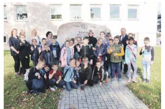
Przy kamieniu postawionym w rocznicę chrztu Polski