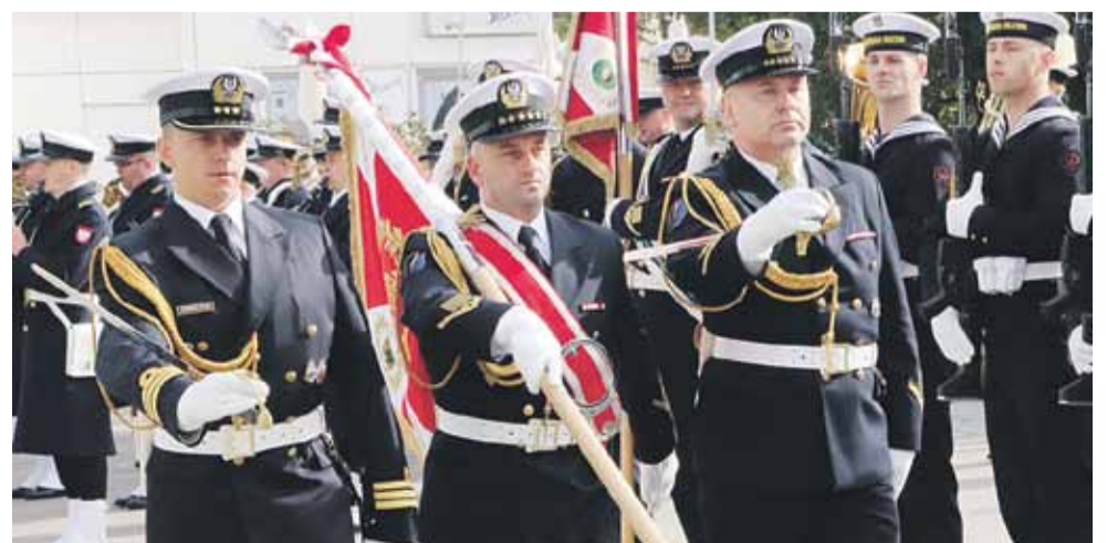
Prezentacja sztandaru