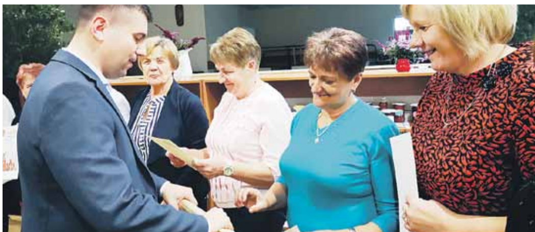
Każde Koło Gospodyń bez względu na wynik konkursu otrzymało nagrodę wójta gminy Łañcut

KRACZKOWA Zamknij lato w słoiku to cykliczne wydarzenie integrujące Koła Gospodyń Wiejskich z powiatu łañcuckiego. Tegoroczna ósma już edycja imprezy odbyła się 5 października, a jej motywem przewodnim były przeciera i keczupy. Pomysłodawcą i organizatorem wydarzenia jest Koło Gospodyń Wiejskich w Kraczkowej. (iw)