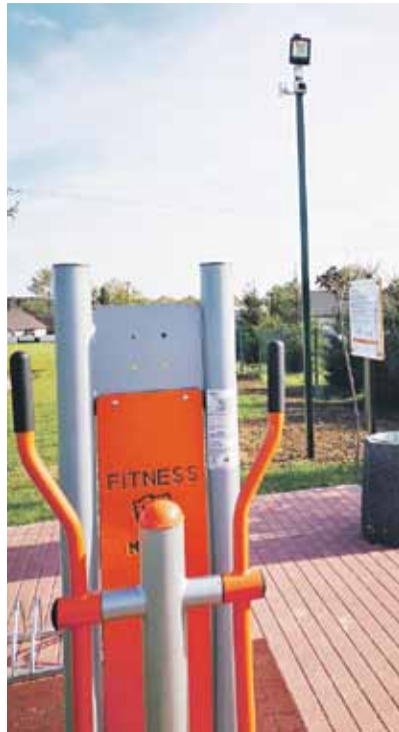
Na stadionie od września działa monitoring