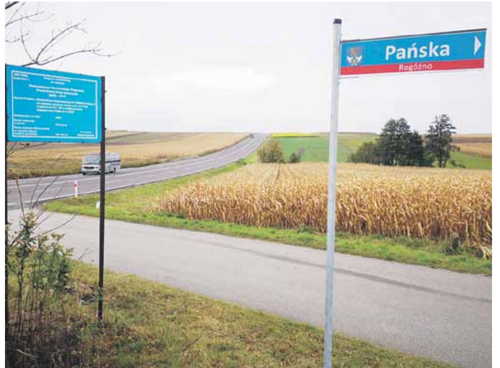
Oznakowania dróg pojawiły się już w Rogóźnie i Kosinie oraz Kraczkowej i Cierpiszu