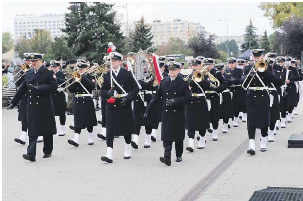
Orkiestra Reprezentacyjna Marynarki Wojennej