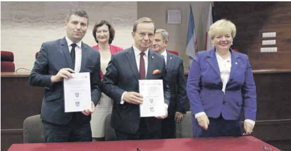
W projekcie biorą udział PKP Polskie Linie Kolejowe S.A. oraz 16 gmin z terenu województwa podkarpackiego

Całkowity koszt projektu to ponad 300 mln złotych, z czego 85% kosztów, czyli ponad 208 mln zł to dofinansowanie z Centrum Unijnych Projektów Transportowych w ramach Programu Operacyjnego Infrastruktura i Środowisko 2014-2020. (iw)