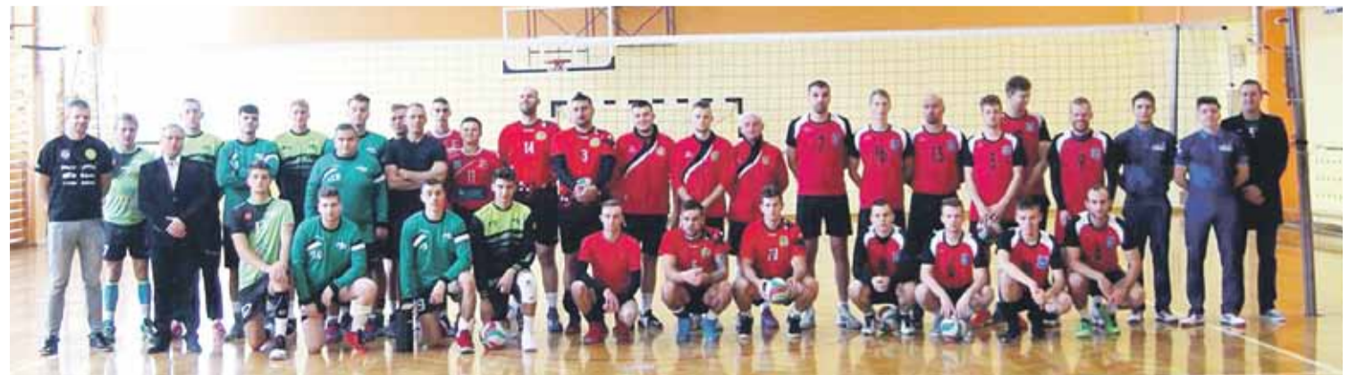
Turniej był okazją do sprawdzenia się przed nowym sezonem. Mecze ligowe ruszyły 13 października

składu nasza gra staje się coraz bardziej spójna. Nasz zespół to połączenie doświadczenia wniesionego przez starszych zawodników oraz młodzieńczego zapału, który wprowadzają najmłodszy. SST Sportur Gmina Łańcut