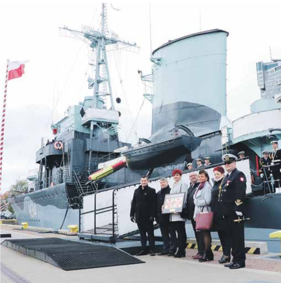
Przedstawiciele gminy Łącut przy Okręcie-Muzeum ORP Błyskawica