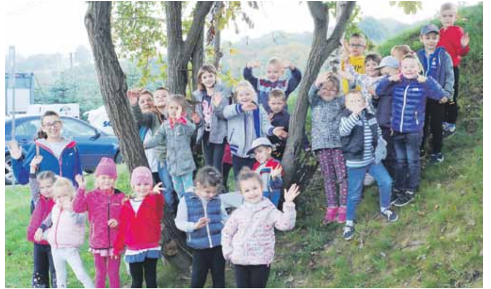
Wyjazd został zorganizowany w ramach uczestnictwa w Międzynarodowym Projekcie Edukacyjnym „Piękna Nasza Polska Cała”

już nie spotyka się w polskich domach i gospodarstwach takie jak: sierp, cepy czy żarna. Po poznaniu procesu przygotowania i pieczenia chleba przyszedł czas na działania praktyczne. Dzieci samodzielnie formowały swoje własne chlebki i dekorowały je ziarnami, a po upieczeniu podpisały i pachnące zabraly do domów by podczas kolacji gościły na stołach. Ostatnią atrakcją pobytu w Siedlisku Janczar była przejażdżka bryczkami konnymi po malowniczej okolicy Strzyżowsko-Sędziszowskiego Obszaru Chronionego Krajobrazu. Przejażdżka była okazją do utrwalenia nazw wybranych gatunków drzew i krzewów. Spacer bryczkami upłynął w miłej atmosferze wspólnego śpiewu poznanych we wrześniu piosenek i podziwianiu okolicy przystrojonej w jesienne barwy. Po posileniu się pysznymi kiełbasami i ciepłą herbatą nadszedł czas powrotu do domu. Dzień był pełen emocji,