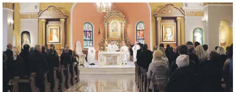
Uroczystości poprzedziła msza św. w Bazylice Mniejszej pw. Najświętszej Marii Panny Królowej Polski