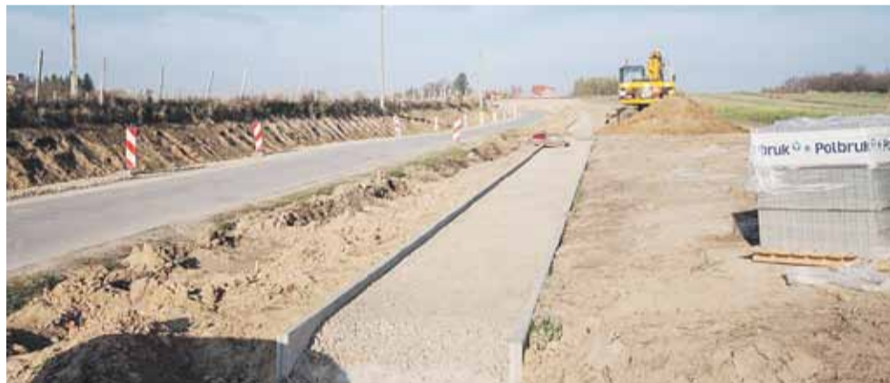
Zakończenie inwestycji planowane jest na koniec I półrocza 2020 roku