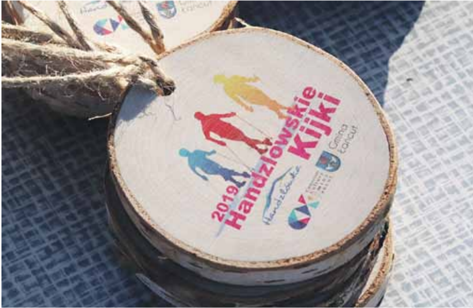
Każdy uczestnik otrzymał taki medal