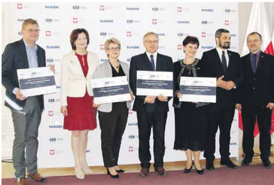
Nowoczesne pracownice trafią do szkół do końca roku szkolnego