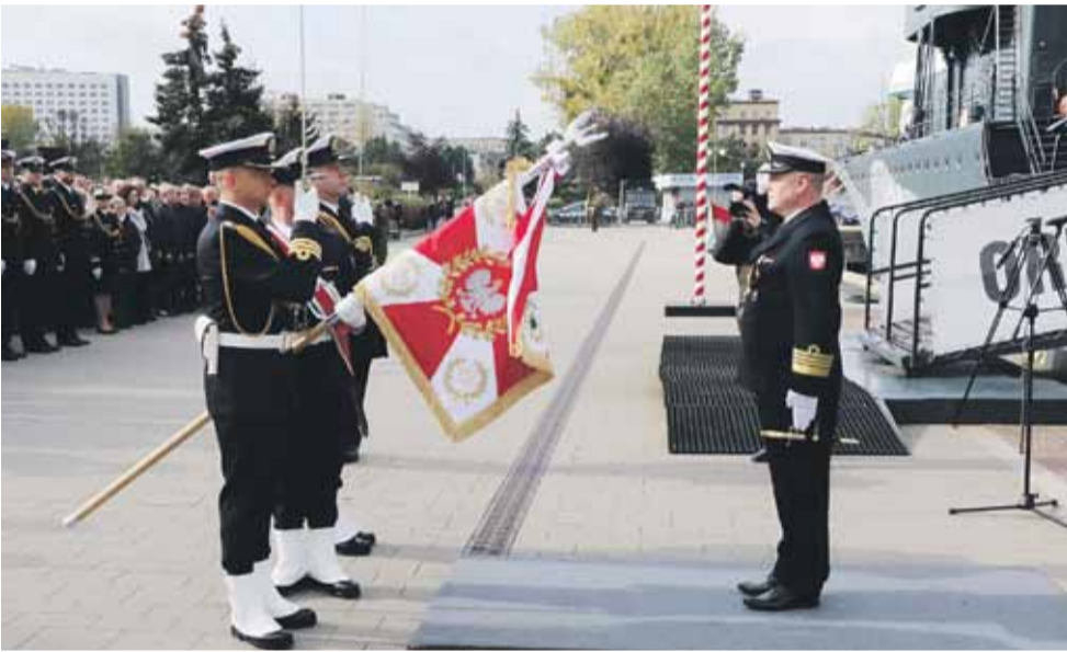
Uroczyste przekazanie sztandaru jednostce