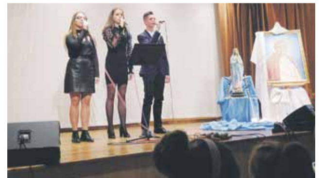
Podczas koncertu wystąpiły m.in. zespoły działające przy OK w Głuchowie

w ten wyjątkowy dzień, by ciągle przekazywać nauczanie Jana Pawła II i mówić młodemu pokoleniu o tych wartościach, które są w życiu najważniejsze. OK Głuchów