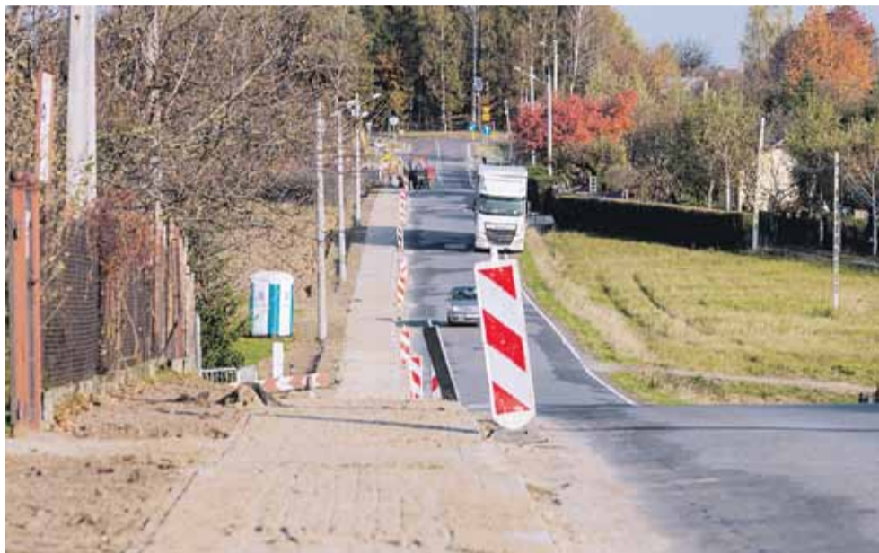
Chodnik budowany był od Ośrodka Zdrowia w Kraczkowej