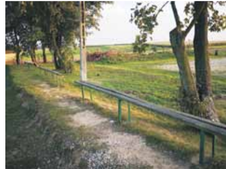
Stadion przed realizacją zadania