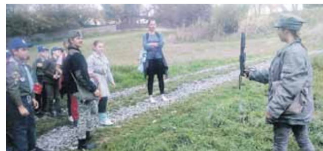
Udział w rajdzie wzięło 5 gromad zuchowych z Hufca Łańcut

Klasyfikacja XII Hufcowego Rajdu Zuchowego „Lisim Tropem” w Handzlówce przedstawia się następująco: I miejsce- 6 Gromada Zuchowa „Białobrzskie Misie” z Białobrzeg, 4 Gromada Zuchowa „Kolorowe Nutki” z Handzlówki; II miejsce- 4 Gromada Zuchowa „Słoneczne Promyki” z Ostrowa; III miejsce- 2 Gromada Zuchowa „Mali Wędrownicy” z Białobrzeg, 1 Gromada Zuchowa „Poszukiwacze Przygód” z Łańcuta.