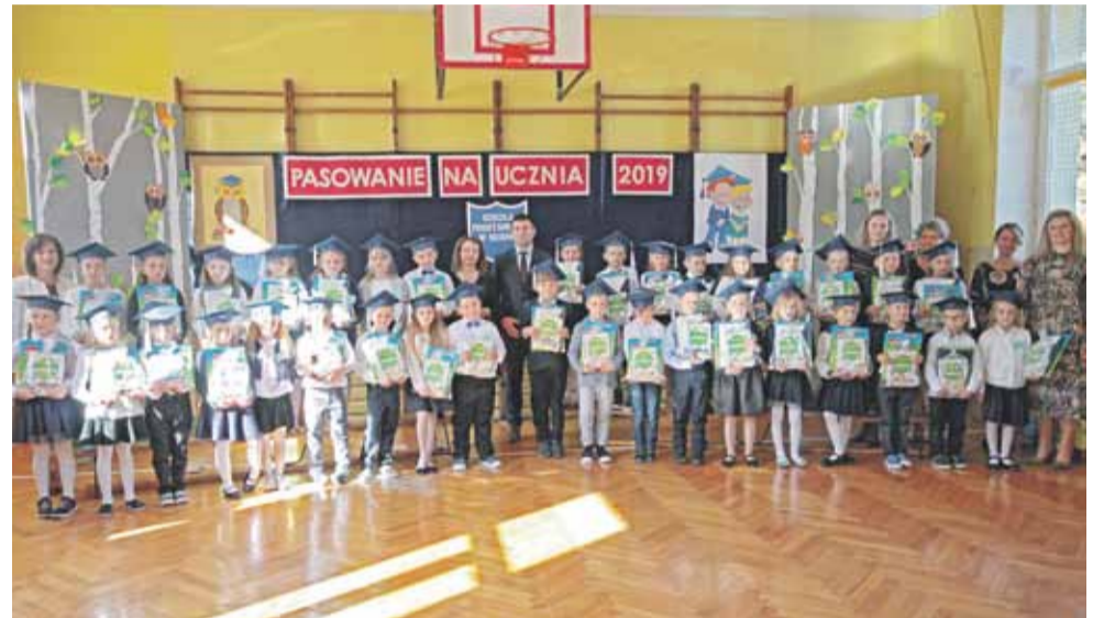
Pierwszoklasiści są już pełnoprawnymi uczniami

Akademia z okazji Dnia Nauczyciela odbyła się m.in. w Handzlówce. (iw)