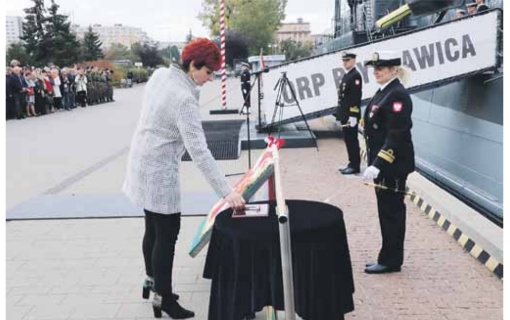
Matka chrzestna sztandaru