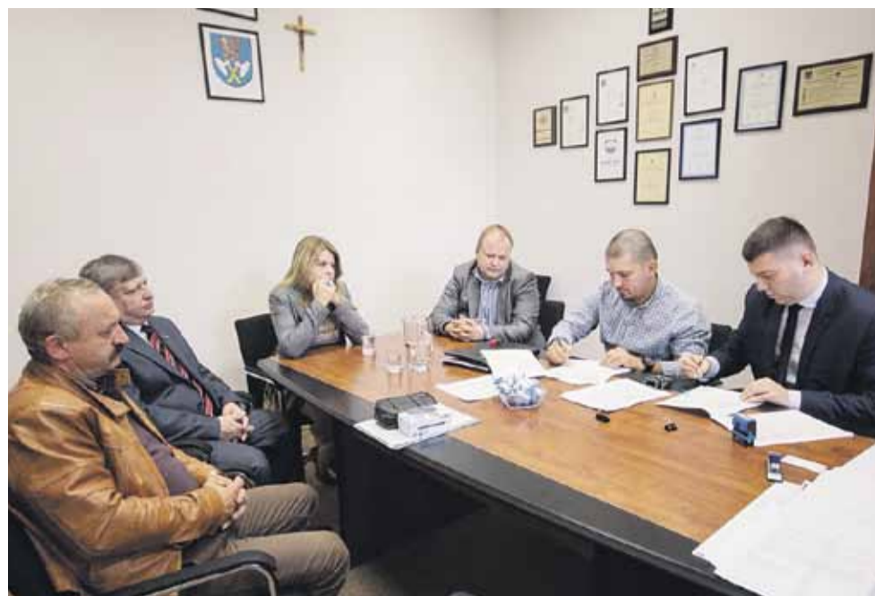
Przy podpisaniu umowy obecni byli radni gminy oraz sołtys Albigowej