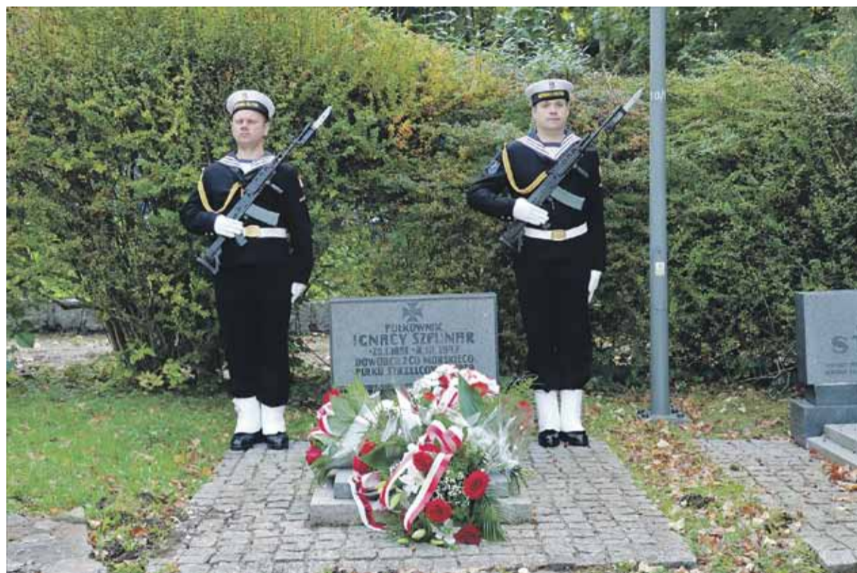
Grób ppłk. Ignacego Szpunara na cmentarzu Obrońców Wybrzeża w Gdyni