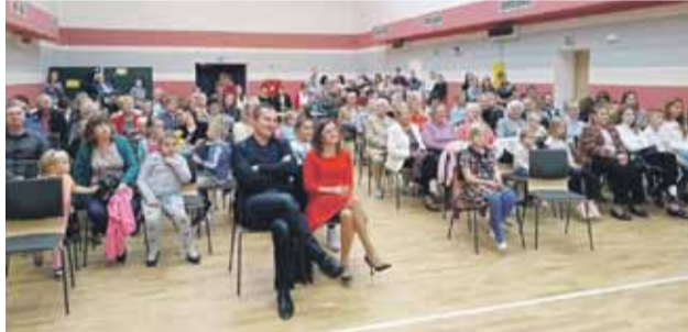
Konkurs cieszył się wspianą i aktywną publicznością