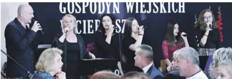
Zespół Zielony Maj