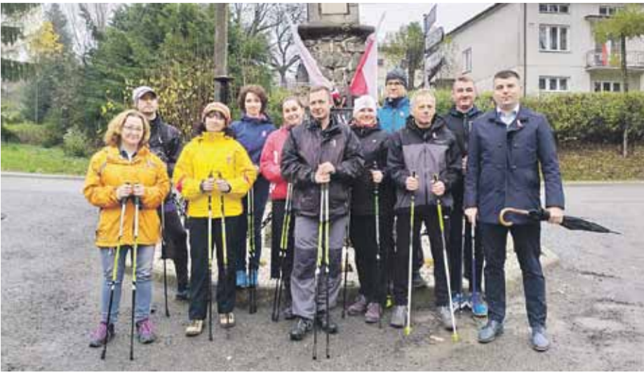
Spacer Niepodległości w Handzlówce