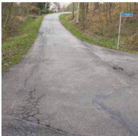
„Dubielówka” w Cierpiszu

CIERPISZ/HANDZLÓWKA 1,5 mln zł dofinansowania gmina otrzyma na przebudowę dróg „Doły” w Handzlówce oraz „Dubielówka” w Cierpiszu.