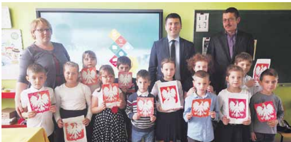
„Szkoła do Hymnu”

ROGÓŻNO 8 listopada w Zespole Szkół im. Anny Jenke w Rogóźnie, podobnie jak w innych placówkach, rozpoczęto uroczyste obchody Święta Niepodległości.