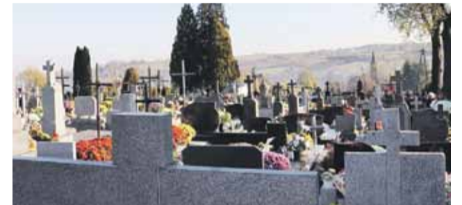
1 listopada na cmentarzach naszej gminy zapłonęło tysiące zniczy