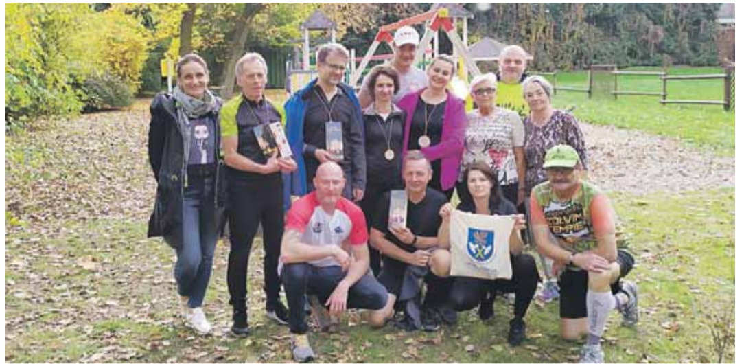
VIII Eko Nadwiślański Marsz Nordic Walking w Baranowie Sandomierskim