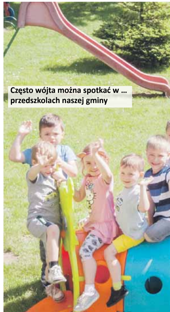
Często wójta można spotkać w ... przedszkolach naszej gminy

Sukcesem można nazwać także bardzo dobrą współpracę z sąsiednimi gminami. Rozmawiamy o drogach, bo one łączą samorządy. Pomagamy gminie Chmielnik przy działaniach na rzecz przebudowy drogi z Honii do Woli Rafałowskiej, co ułatwi mieszkańcom Cierpisa, Albigowej oraz Handzlówki dojazd do Rzeszowa. Z gminą Gać czy-