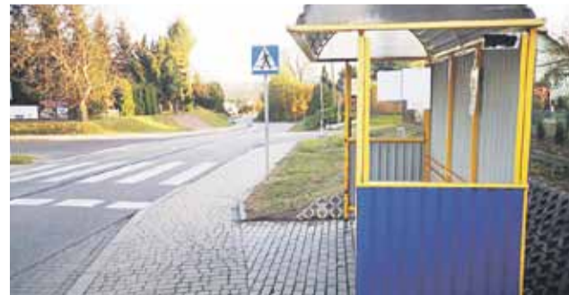
Posprzątnany przystanek w Wysokiej.