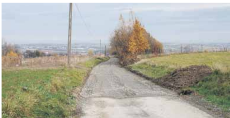
Droga „Budy” w Kraczkowej, jak i dwie pozostałe już niedługo będą miały nawierzchnię asfaltową

- W przypadku drogi „Do Cmentarza” realizowane prace traktujemy jako pierwszy etap. Docelowo chcemy drogę połączyć z parkingiem, co szczególnie w okresie świąt będzie dużym ułatwieniem dla kierowców. Natomiast droga Kędziorówka jest drogą wewnętrzną prowadzącą do kilku domów. To zadanie jest dokończeniem prac realizowanych w poprzednich latach – dodaje. (iw)