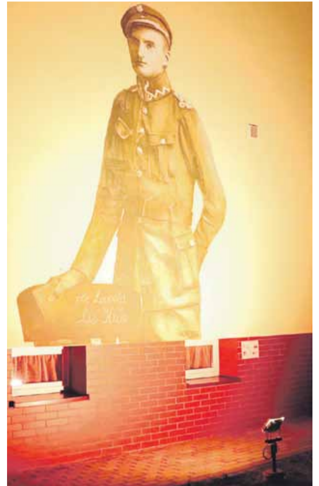
Rok 2019 na Podkarpaciu jest rokiem płk. Leopolda Lisa-Kuli. W 101. rocznicę odzyskania niepodległości nie mogło zabraknąć uczczenia jego pamięci pod mural z jego wizerunkiem.