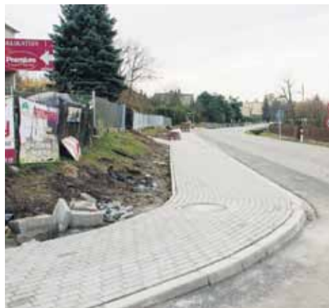
Chodniki w Albigoj mają przede wszystkim poprawić bezpieczeństwo mieszkańców