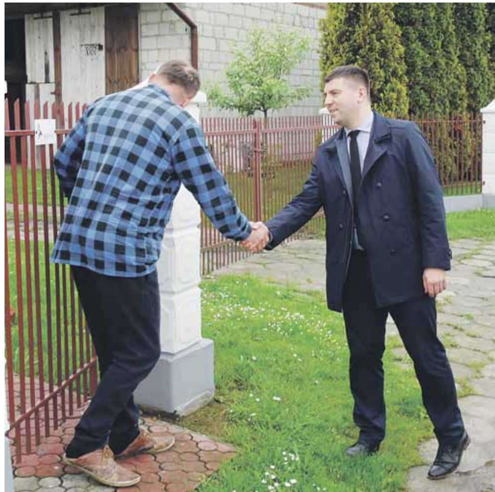
Spotkania przy drogach, które mają być przebudowane, czy wyremontowane, to jeden ze sposobów kontaktu wójta z mieszkańcami