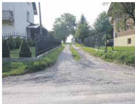
Droga w Wysokiej przed i po przebudowie

- W gminie mamy jeszcze sporo dróg wewnętrznych do utwardzenia, co w większości przypadków wymaga od nas uregulowania kwestii własnościowych, a to wymaga też dobrej woli ze strony mieszkańców, do czego będziemy zachęcać osoby zainteresowane – zaznacza wójt. (iw)