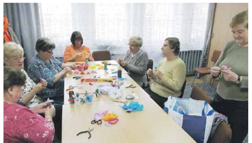
Panie z Klubu Seniora z Albigowej w trakcie przygotowań dekoracji na spotkanie podsumowujące