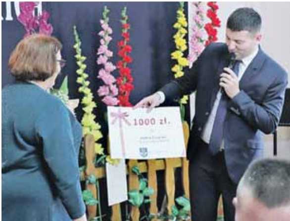
Prezent od wójta

GMINA ŁAŃCUT 26 października w sali budynku społecznego w Cierpiszu odbyła się uroczystość 85-lecia działalności KGW Cierpisz. Było to święto wszystkich działaczek Koła Gospodyń jak i święto Cierpisza.