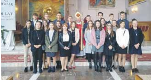
Dziękczynna Msza św. była też okazją do udzielenia głuchowskiej młodzieży sakramentu bierzmowania