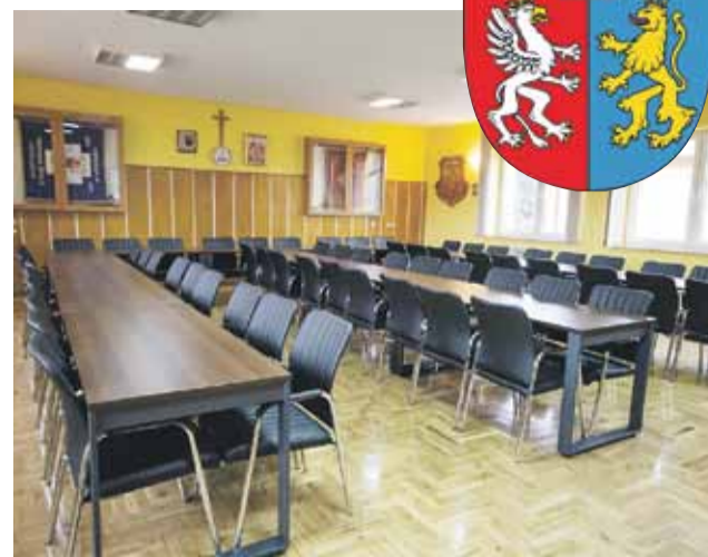
Koszt inwestycji wyniósł ponad 35,6 tys. zł.