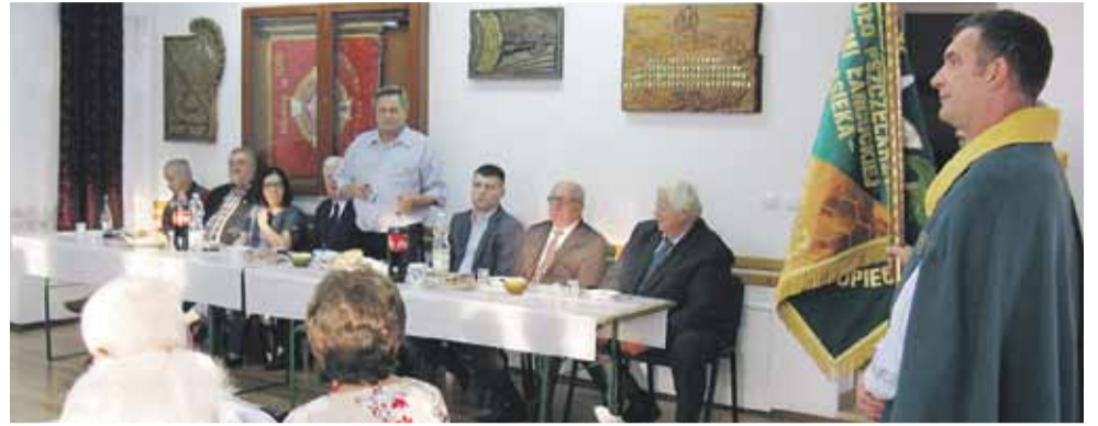
Pszczelarze spotykają się co roku na zakończenie sezonu pszczelarskiego, aby podsumować mijający rok, wymienić się doświadczeniem z pracą w pasiekach, omówić problemy oraz plany na nowy sezon