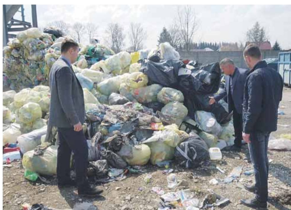
Trudności związane z gospodarką odpadami komunalnymi wójt omawiał z dyrektorem firmy Ekoline

już plan, jeśli chodzi o dokumentację projektową jak i źródła finansowania, myślę że w II połowie 2020 roku będziemy mogli zdradzić szczegóły.