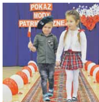
Pokaz mody patriotycznej