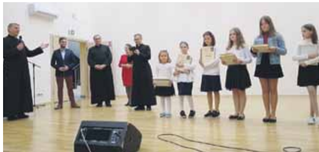
Uczestniczki otrzymały obrazy i dyplomy