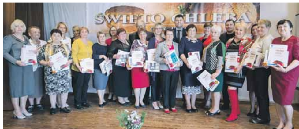
Wszystkie Koła otrzymały pamiątkowe dyplomy i nagrody ufundowane przez gminę łańcut