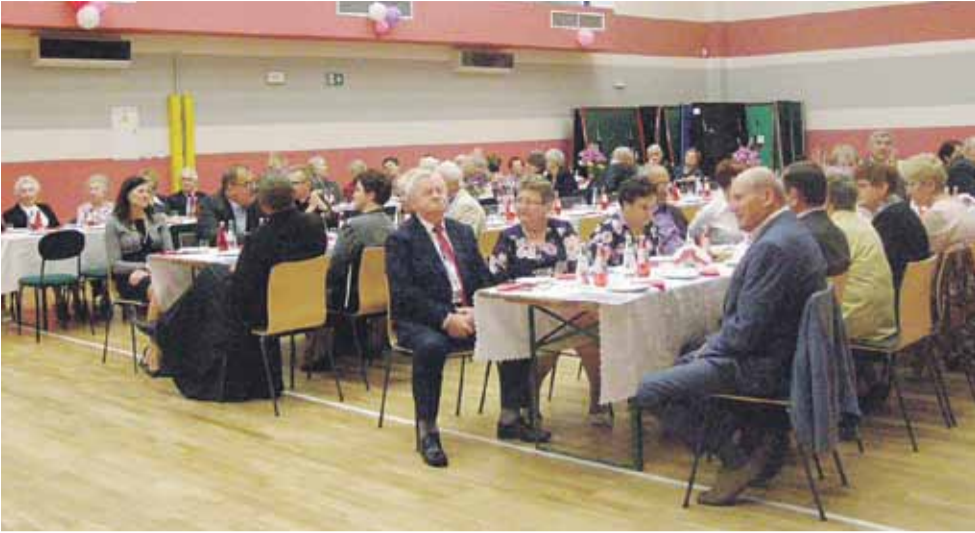
Spotkanie na stałe wpisało się do kalendarza wydarzeń i seniorzy z niecierpliwością na nie czekają