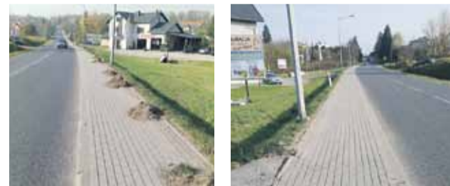
Chodnik w Soninie w trakcie i po sprzątnięciu

GMINA ŁAŃCUT Odchwaszczanie i zmiatanie chodników, utrzymanie czystości na placach zabaw, mycie wiat przystankowych i drobne remonty to tylko część prac realizowanych od wiosny przez pracowników Zakładu Gospodarki Komunalnej na terenie naszej gminy. - Dzięki poszerzeniu działalności Zakładu Gospodarki Komunalnej poprawia się estetyka gminy. Do 2018 roku ciężar prac porządkowych w gminie oparty był wyłącznie na pracownikach interwencyjnych, których pracę nadzorowali sołtysi. Pomimo najlepszych chęci sołtysów, nie było możliwości upilnowania wszystkiego. Nasz cel to gmina czysta, zadbana i przyjazna dla każdego. Potrzebujemy jeszcze sporo czasu by to osiągnąć. Ważne, że z każdym miesiącem jesteśmy coraz bliżej celu - zaznacza wójt Jakub Czarnota. (iw)