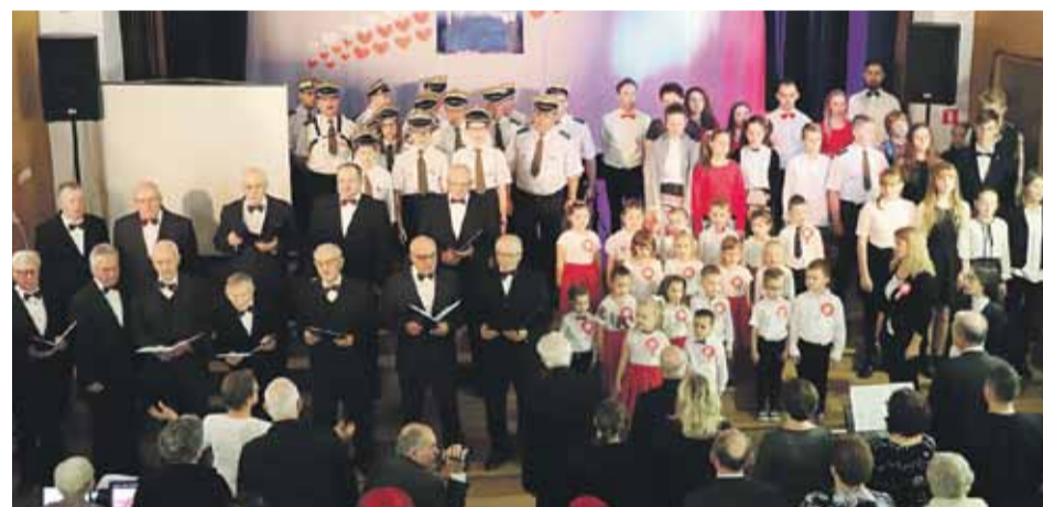
Program artystyczny rozpoczął się zaśpiewaniem przez wszystkich występujących hymnu Polski

- Ogromne podziękowania za wiele lat pracy, za włożony trud i wysiłek, a przede wszystkim za szczerę serce, które okazywał ludziom. Mamy nadzieję, że kiedyś do nas wróci – mówiła