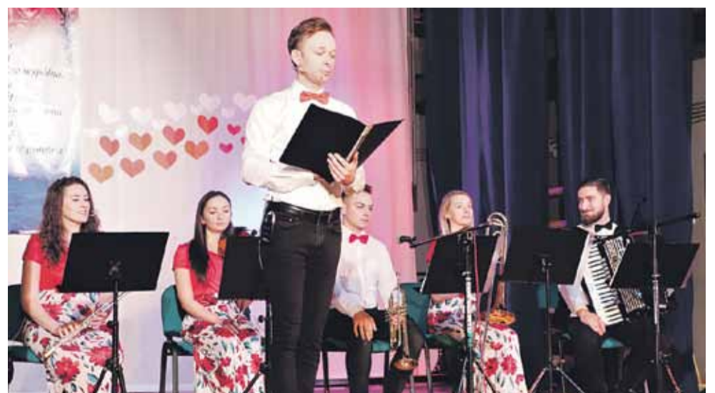
Muzycy Mobilnej Filharmonii.