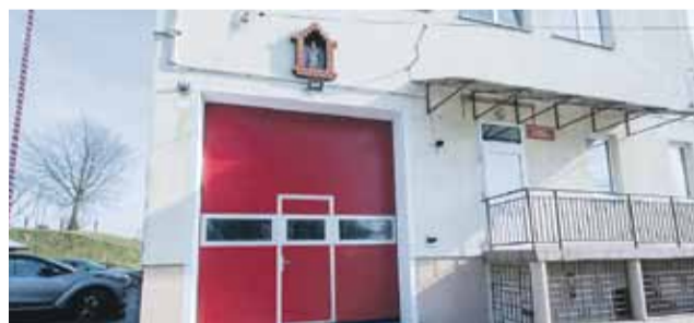
Gmina pomaga w remontach budynków OSP. W Głuchowie wymieniono drzwi garażowe za kwotę 16,8 tys. zł.