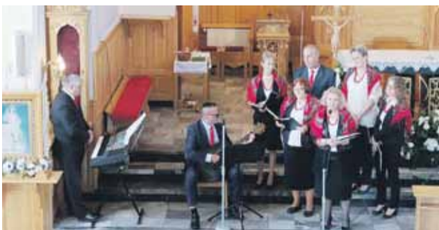
Zespół działa przy Ośrodku Kultury w Cierpiszu FOT. OK W CIERPISZU