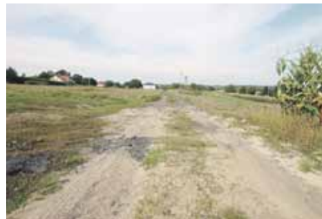
Droga w Soninie przed przebudową i po