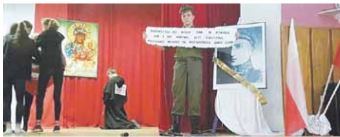
Spektakl odbył się w Ośrodku Kultury w Kosinie w przededniu 101. rocznicy odzyskania niepodległości

KOSINA Mieszkańcy Kosiny i nie tylko mieli okazję obejrzyć spektakl słowno-muzyczny pt. „Za wolność płaci się życiem”. Widowisko przygotowała młodzież działająca przy Ośrodku Kultury.