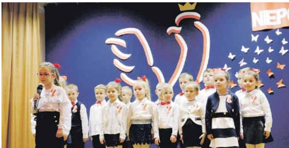
Akademia w OK w Rogóźnie FOT. ZS W ROGÓŻNIE

Tegoroczne obchody Niepodległości były nie tylko radosnym świętowaniem, ale też lekcją, na której wszyscy uświadomiliśmy sobie, że „Sztuką jest umierać dla Ojczyzny, ale największą sztuką jest dobrze dla niej żyć”. ZS w Rogóźnie