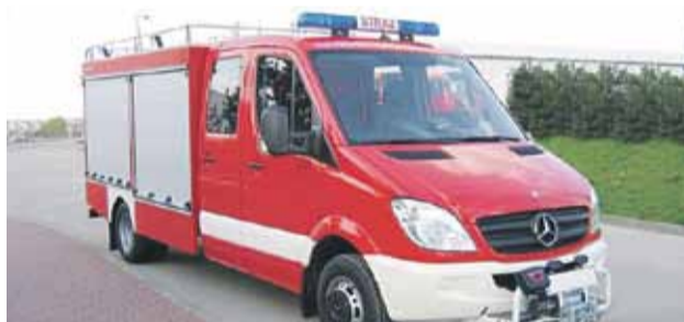
Gmina do samochodu dołoży 100 tys. zł.