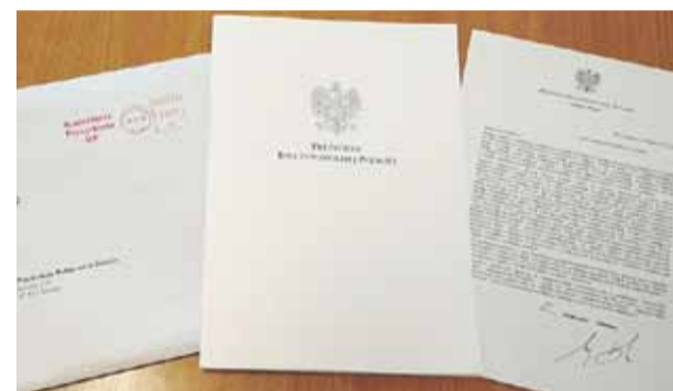
List od prezydenta

GMINA ŁAŃCUT Wychowanie patriotyczne jest procesem długotrwałym i zaczyna się już od najmłodszych lat, gdyż żywa wyobraźnia małego dziecka, duża wrażliwość emocjonalna i zaciekanie światem sprzyjają kształtowaniu obrazu Ojczyzny, który pozostaje na całe życie.