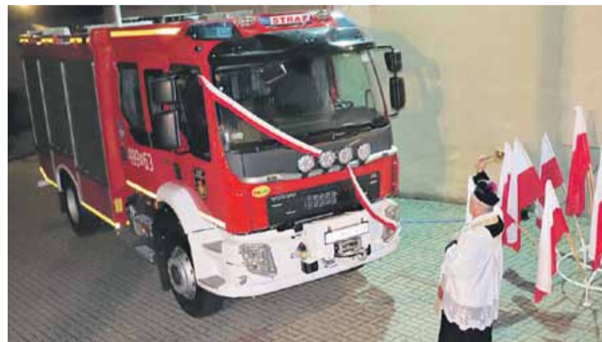
Nowy wóz strażacki OSP w Kosinie poświęcił proboszcz tutejszej parafii