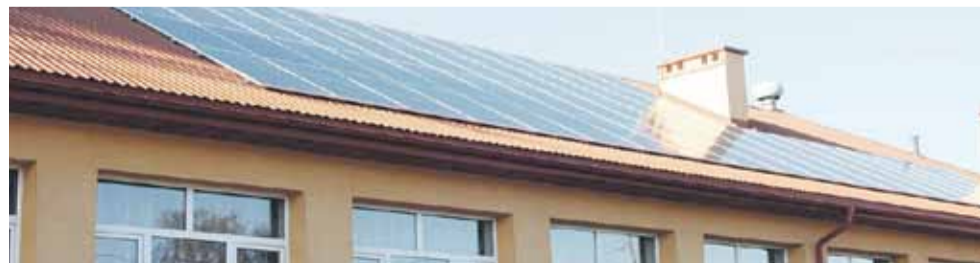
Moc zamontowanej instalacji na budynku stołówki ZS to 17,67 kWp