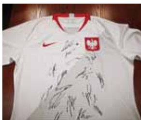
Koszulka z autografami piłkarzy reprezentacji narodowej.