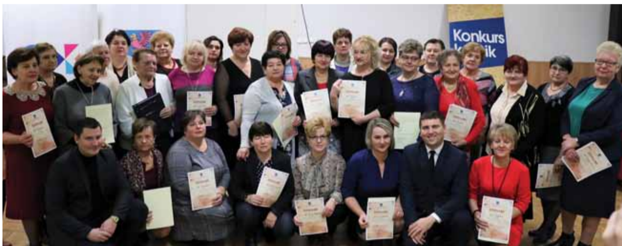
W konkursie kronik udział wzięły koła z gmin Łącut, Markowa, Miasto Łącut, Białobrzegi, Czarna, Żołynia, Chmielnik, Dynów, Kańczuga, Fryszak