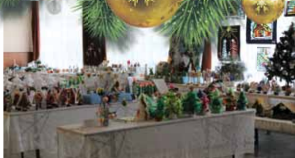
Na kiermaszu zaprezentowało się 21 wystawców