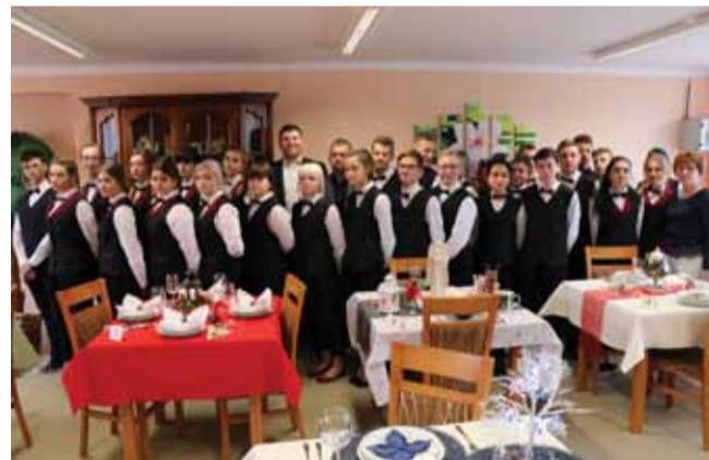
Wszyscy uczniowie wykazali się kreatywnością w przygotowaniu nakrycia.