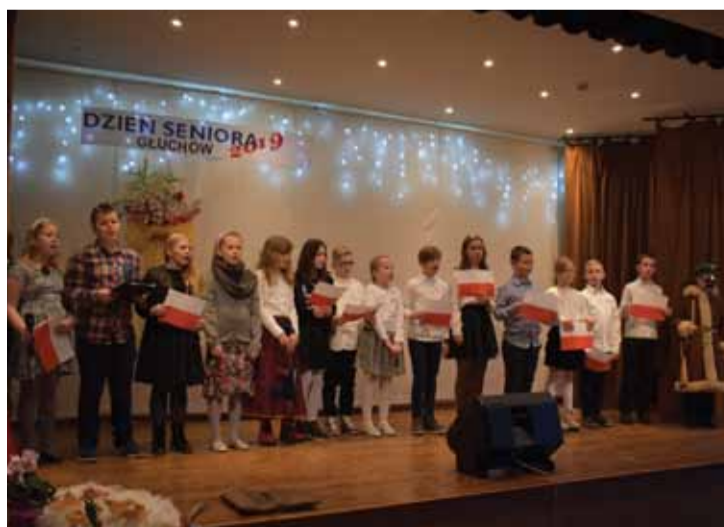
Dla Seniorów wystąpili m.in. uczniowie ZS w Głuchowie