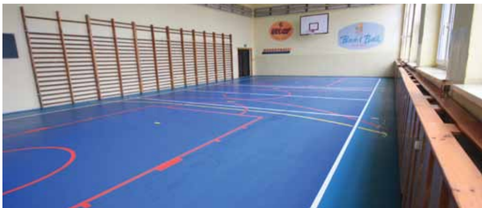
Tak wygląda teraz sala gimnastyczna w szkole.