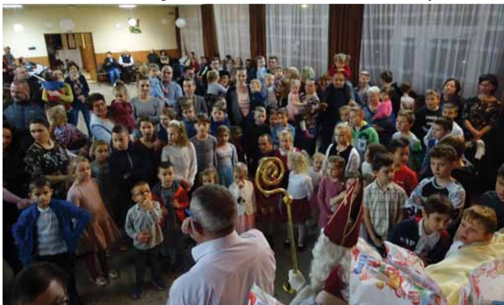
Dzieci wypełniły całą salę OK

ALBIGOWA 4 grudnia pracownicy OK w Albigowej wraz z ks. B. Kamińskim, ks. M. Kłopotem oraz paniami z KGW zorganizowali spotkanie z Mikołajem.