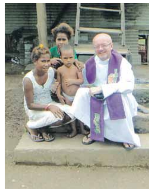
Z wizytą u mieszkańców Papui

Pierwsze trzy lata w Seminarium były bardzo trudne. Na początku nie było