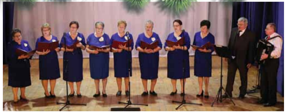
Zespół Śpiewaczy Klubu Seniora działa od 2015 roku