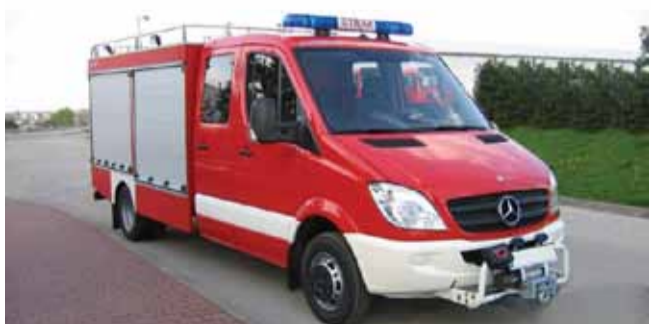
Gmina Łańcut na zakup wozu otrzyma 250 tys. zł dofinansowania