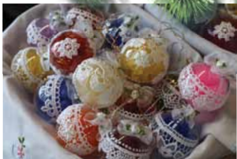
Kiermasz świąteczny trwał przez trzy dni