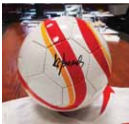
oraz piłka z autografem prezesa PZPN to m.in. przedmioty do nabycia podczas balu