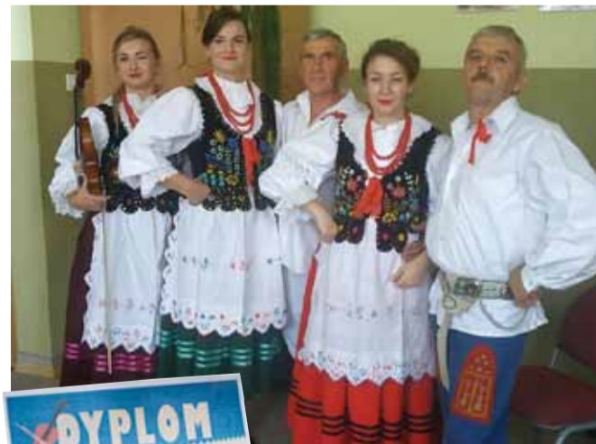
Przeгляд odbył się w Rzeszowskim Domu Kultury filia Słocina