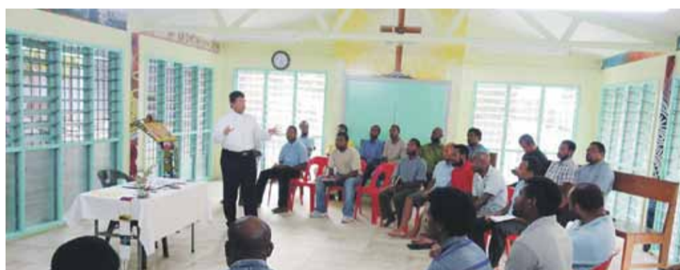
Klerycy na wykładach. Nauka w Seminarium w Bomanie trwa 10 lat