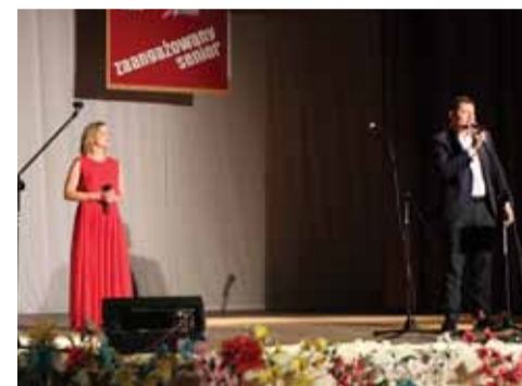
Wystąpił także dyrektor CKGŁ z żoną