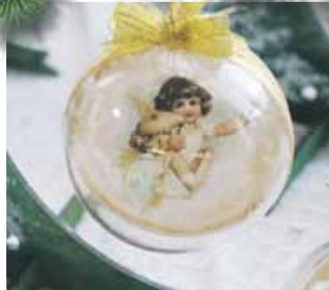
Można było nabyć m.in. ozdoby choinkowe, stroiki, czy kartki świąteczne