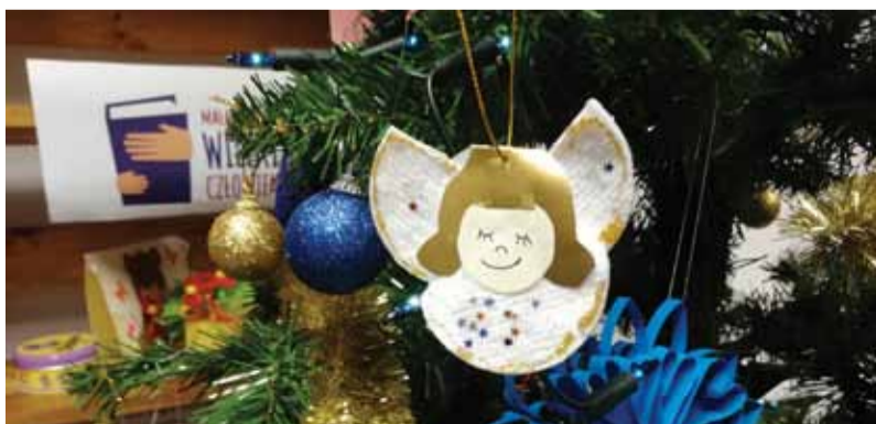
W sumie wykonano ok. 40 aniołków

ALBIGOWA Za nami dwa dni pracy twórczej dzieci uczęszczających na grudniowe zajęcia plastyczne pod hasłem „Idą Święta”. W Albigowej w czasie trwania spotkania dzieci wykonały aniołki z płatków kosmetycznych. Ozdobiły je klejem z brokatem w kolorze złotym i srebrnym. Z ogromnym zaangażowaniem powstawały kolorowe aniołki, które dzieci zabrały do domu, by udekorować nimi świąteczną choinkę. Bogusława Baran