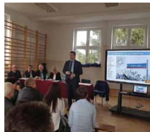
Mieszkańcy mogli zobaczyć m.in. zdjęcia z wykonanych inwestycji.