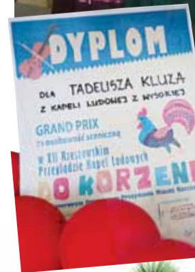
Dyplom można obejrzeć w Ośrodku Kultury w Wysokiej