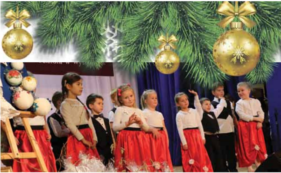
Swoj program artystyczny zaprezentowali przedszkolaki. Zatańczyli m.in. poloneza