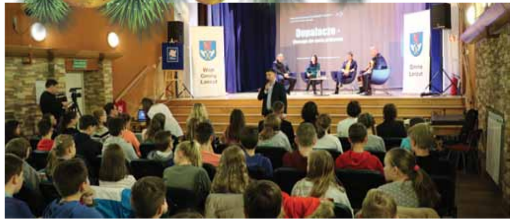
Młodzież miała okazję posłuchać na temat uzależnień m.in. od mediów, czy środków psychoaktywnych