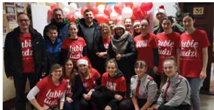
W dniu finału tego-rocznej akcji łańcucki magazyn Szlachetnej Paczki odwiedził wójt z radnymi gminy

Szlachetna Paczka jest jednym z najbardziej rozpoznawalnych projektów społecznych w Polsce. Jest oparta na pracy z Darczyńcami i Wolontariuszami. To oni pomagają Rodzinom w potrzebie. Wolontariusze szukają Rodzin i pracują z nimi, a Darczyńcy przygotowują dedykowaną pomoc.