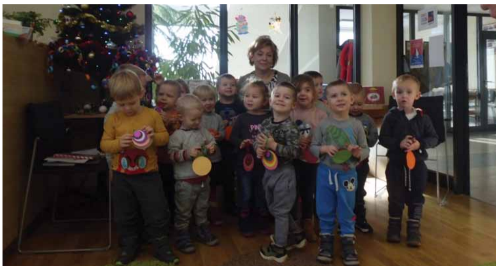
Dzieci wykazały się talentami plastycznymi robiąc piękny, kolorowy łańcuch, którym udekorowana została choinka w bibliotece