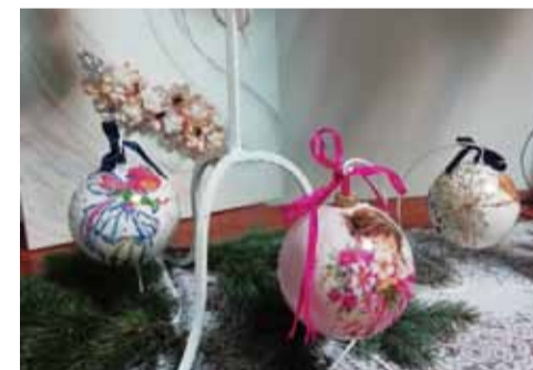
To tylko jedno z prac, które można podziwiać na wystawie