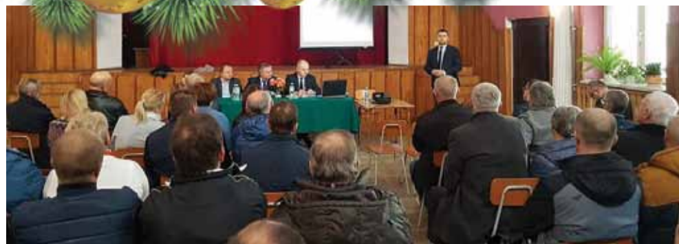
Spotkania cieszyły się dużą frekwencją