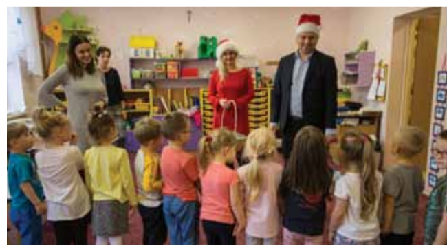
Niecodzienna wizyta przyniosła przedszkolakom wiele radości.