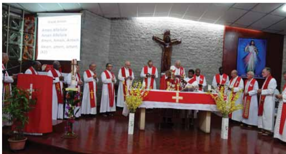
Msza Św. w Seminarium

na pracę. Obserwowałem życie kleryków w seminarium i postawiłem sobie dwa cele – pierwszy aby po prostu być z nimi, pomagać im, a drugi aby zrobić remonty. Po 2 miesiącach wróciłem do Polski i czekałem na wizę pozwalającą na pracę w Papui. W styczniu 2014 roku zostałem mianowany przez prefekta kongregacji ds. ewangelizacji narodów. Zostałem