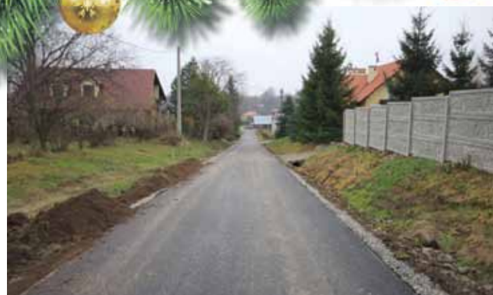
„Budy” w Kraczkowej przed i po remoncie