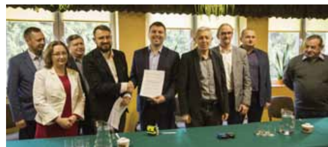
W podpisaniu umowy przez wójta z wykonawcą uczestniczyli radni gminy i powiatu, dyrektor Zarządu Dróg Powiatowych Janusz Wolski oraz władze sołeckie