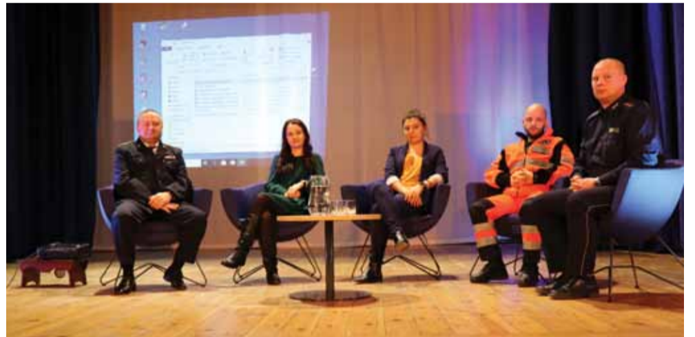
Na pytania uczniów odpowiadali m.in. policjant, czy ratownik