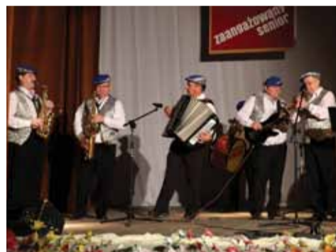
Nie zabrakło występów zespołów działających przy CKGŁ – m.in. kapeli „Wysoczanie”