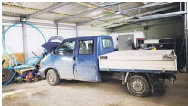
ZGK w Soninie posiada m.in. zaplecze magazynowo-warsztatowe

Koszt biletów wstępu: 100 zł. Zapisy wraz z wpłatą zaliczki 300 zł u Organizatora