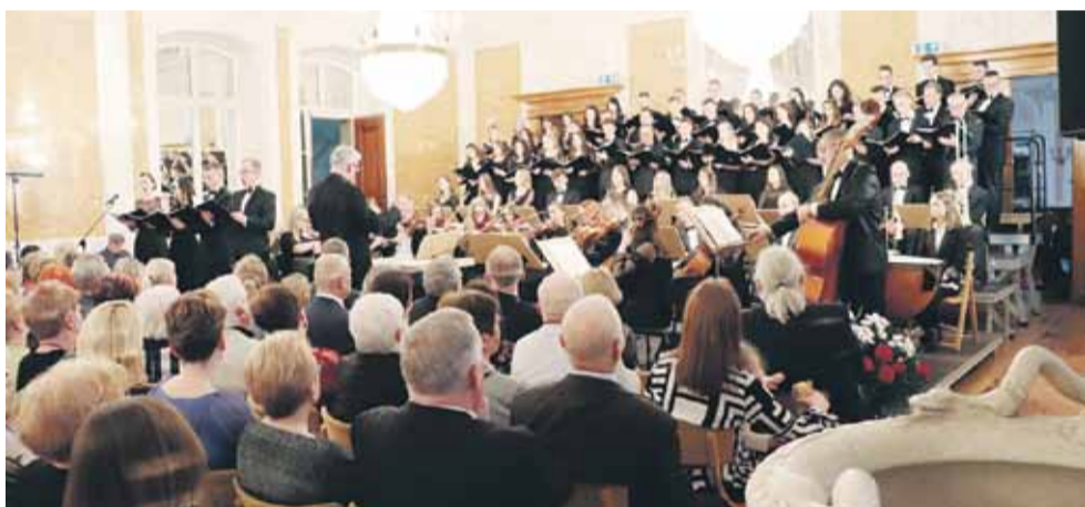
Była to już XIV edycja koncertu w hołdzie św. Janowi Pawłowi II