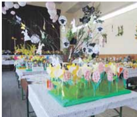
Na kiermaszu pojawiło się mnóstwo świątecznych ozdób