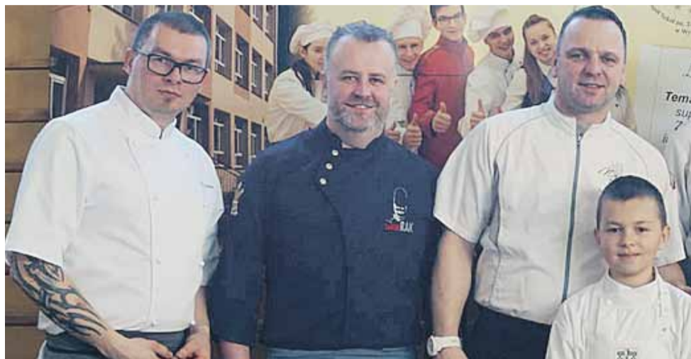
Mistrzowie kuchni gościli w marcu w Zespole Szkół w Wysokiej, o czym pisaliśmy w poprzednim numerze „Głosu Gminy Łańcut”

R.G.: Mogę przyrównać powstawanie nowej potrawy do tworzenia biżuterii. Tak jak dla klienta projektuje się nowy pierścionek, tak samo ja tworzę dla niego potrawę. Słucham gości i ich oczekiwań, rozglądam się za produktami, szukam technik: co można z danym