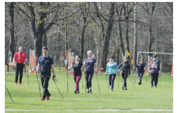
Ćwiczenie prawidłowej techniki marszu