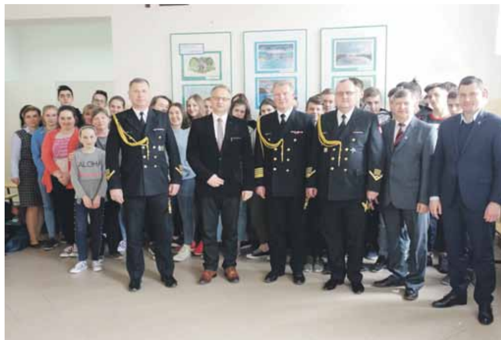
Marynarze z RCI odwiedzili także uczniów szkoły w Albigowej