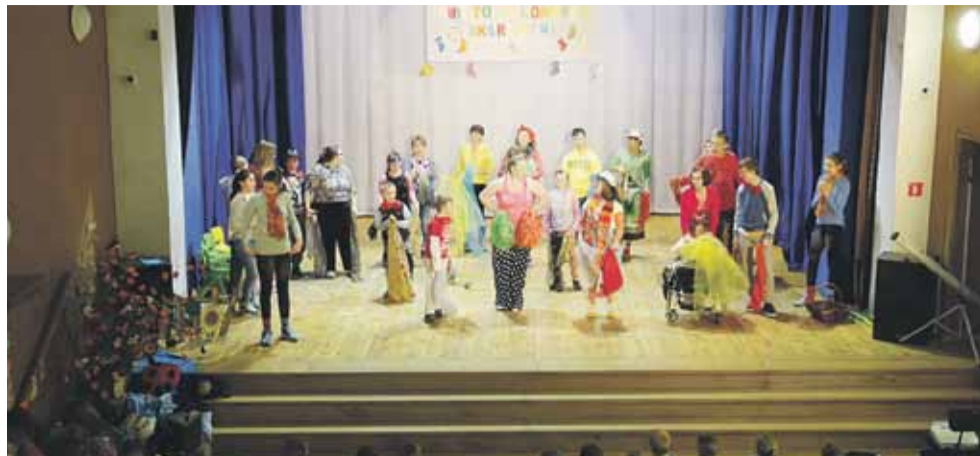
Tegorocznym obchodom Dnia Kolorowej Skarpetki przyświecało hasło „Nikt nie zostanie pominięty”