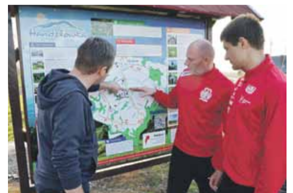
Mistrzostwa Podkarpacia w nordic walking odbędą się Handzlówce