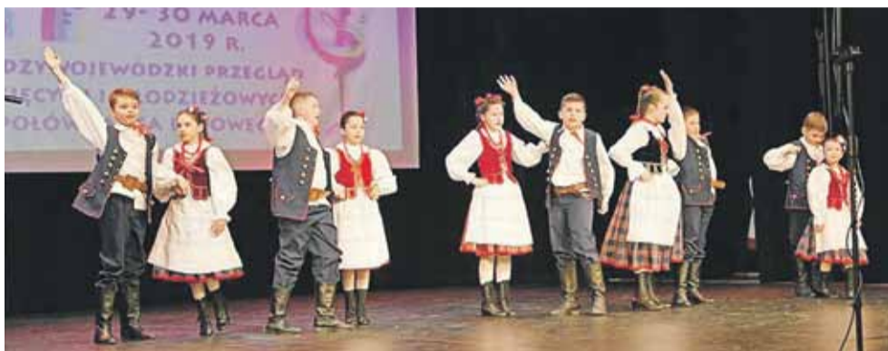
W przeglądzie wzięło udział ponad 500 tancerzy