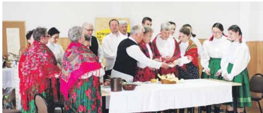
Podczas spotkania wystąpił zespół „Tkacze”