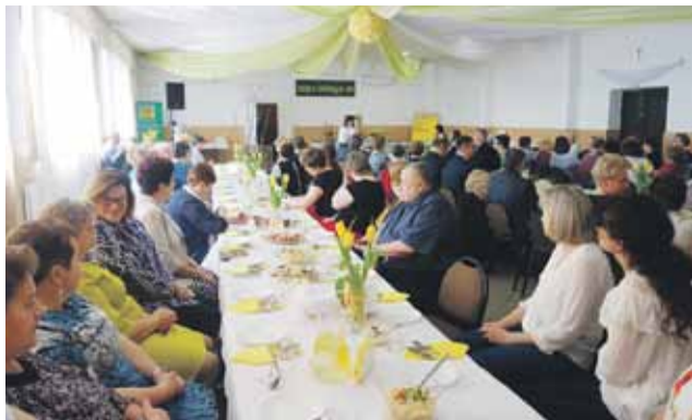
Przy świątecznym stole nie brakowało przemówień i życzeń zaproszonych gości