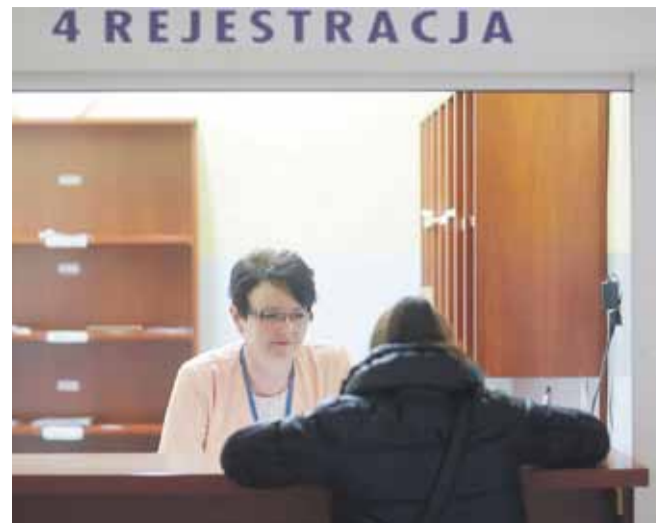
Liczba pacjentów zapisanych w CM w Łąncucie z roku na rok rośnie