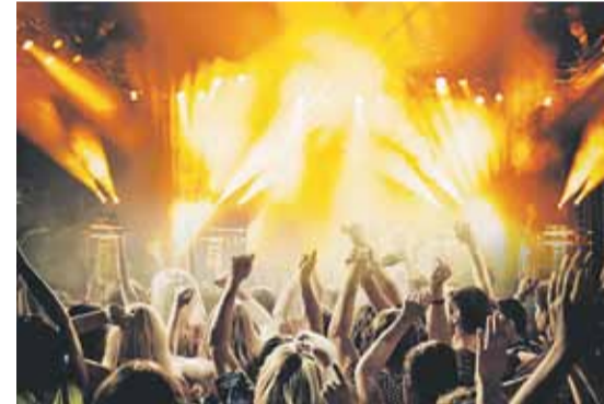
Dzień Gminy Łańcut odbędzie się 29 czerwca na stadionie w Albigowej

W tym roku Dzień Gminy odbędzie się na boiskach klubu sportowego w Albigowej. Szukaliśmy różnych lokalizacji, ale ostatecznie ta okazała się najlepsza. Na stadionie zostaną rozegrane zawody w piłkę nożną o puchar wójta. W trakcie wydarzenia zostanie rozstrzygnięty również konkurs „Zamelduj się i wygraj nagrody”, odbędzie się losowanie i szczęśliwcy odbiorą z rąk wójta gminy nagrody. Będzie strefa rodzinna. Przed południem ruszą też dmuchańce i zabawy dla dzieci. Nie zabraknie części gastronomicznej gdzie będzie