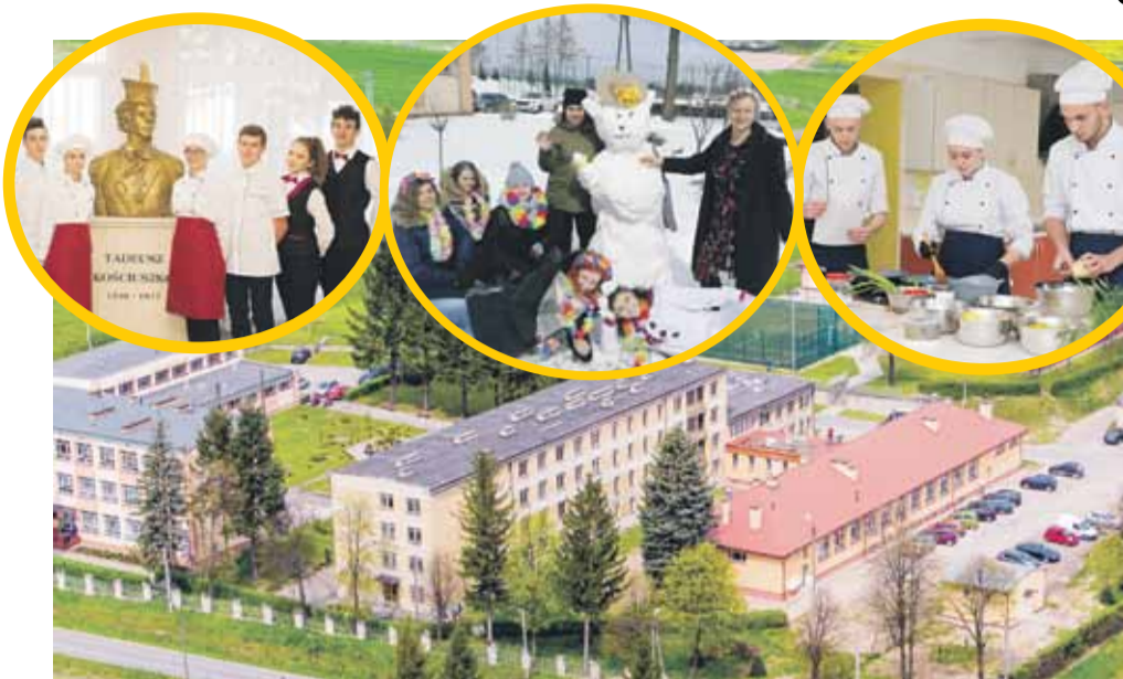
Przy szkole znajduje się m.in. kompleks boisk sportowych. Patronem ZS Wysoka jest Tadeusz Kościuszko. Uczniowie szkolą się w nowoczesnych pracowniach

Obecnie szkoła realizuje projekt „Dobry zawód – lepsza przyszłość”, zapewniający zdobycie dodatkowych umiejętności zawodowych w ramach bezpłatnych kursów: baristycznych, barmańskich, kelnerskich, carvingu i obsługi wózków widłowych oraz płatnych staży zawodowych. Młodzież zdobywa doświadczenie zawodowe w najlepszych restauracjach i hotelach w regionie oraz w Polsce, m.in. w Jastrzębiej Górze, Juracie, czy Polańczyku. Dla uczniów kierunku logistycznego szkoła zapewnia praktyki w firmach: Transsped, Bimex Böllhoff, B&P Engineering oraz Porcie Lotniczym Jasionka. Ponadto uczniowie mają możliwość uczestniczyć w ponadprogramowych praktykach zawodowych m.in. na greckich wyspach: Rodos, Kos oraz na promach pływających do Szwecji. Szkoła zamierza kontynuować projekt „Erasmus