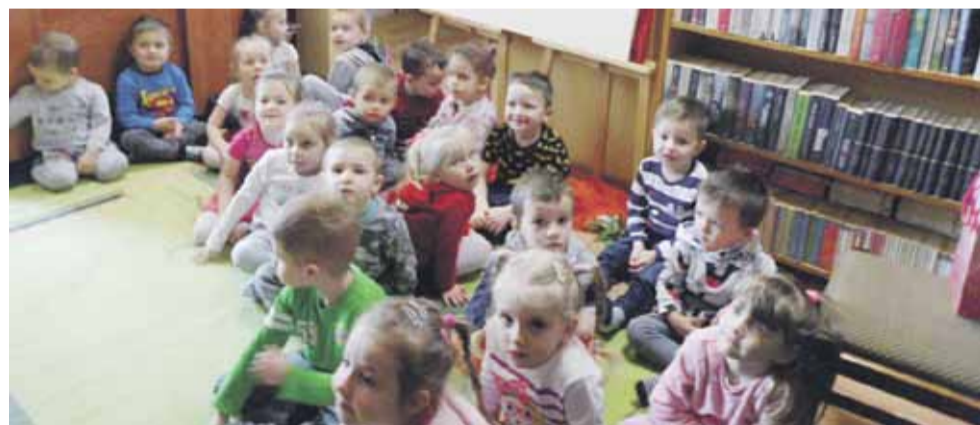
Dzieci miały okazję posłuchać wierszy o wiosnie FOT. AGATA ZACHWIEJA