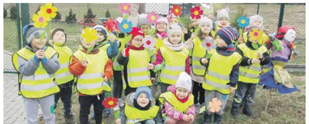
Podczas pierwszego dnia wiosny dzieci miały wiele radości