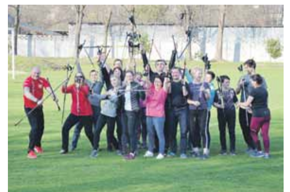
Kurs instruktora zakończony!