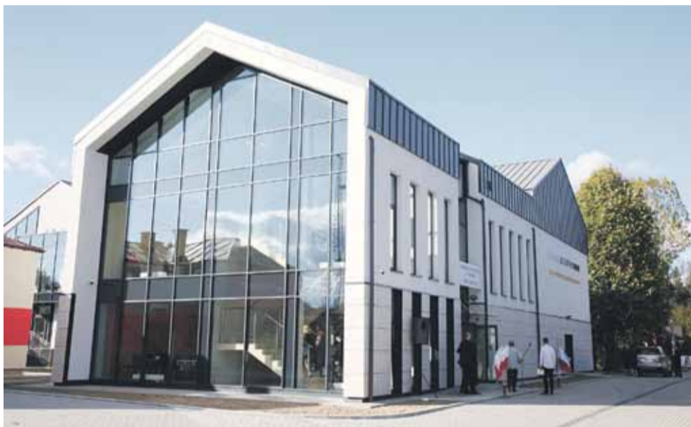
Nowe wyposażenie ośrodki mają dostać jeszcze w tym roku