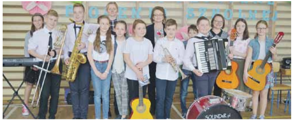
Młodzi artyści zaprezentowali swoje umiejętności gry na instrumentach