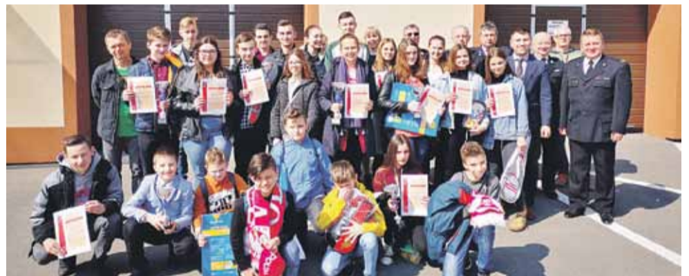
Szczegółowe wyniki konkursu na http://www.gminalancut.pl

pierwszych miejsc w poszczególnych grupach wiekowych będą reprezentować naszą gminę w Eliminacjach Powiatowych, które odbędą się 25 kwietnia br. w Komendzie Powiatowej PSP w Łąncucie. (iw)