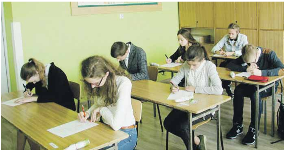
Wyniki konkursu na stronie https://szkolarogozno.edupage.org/news/#213