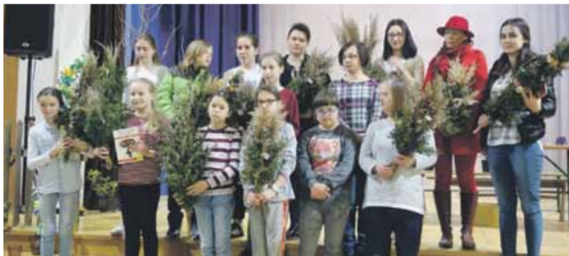
Konkurs na tradycyjną palmę odbył się już po raz 5