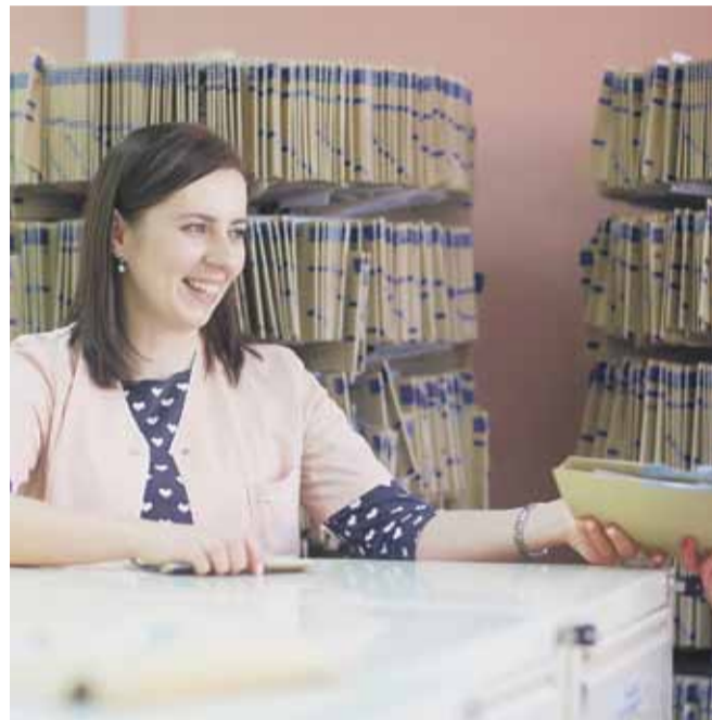
W 2018 roku z porad lekarza POZ skorzystało ponad 61 tys. pacjentów