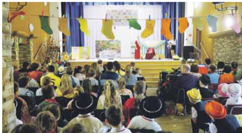
Uczniowie SP przedstawili własną, humorystyczną wersję „Król lewny Śnieżki”