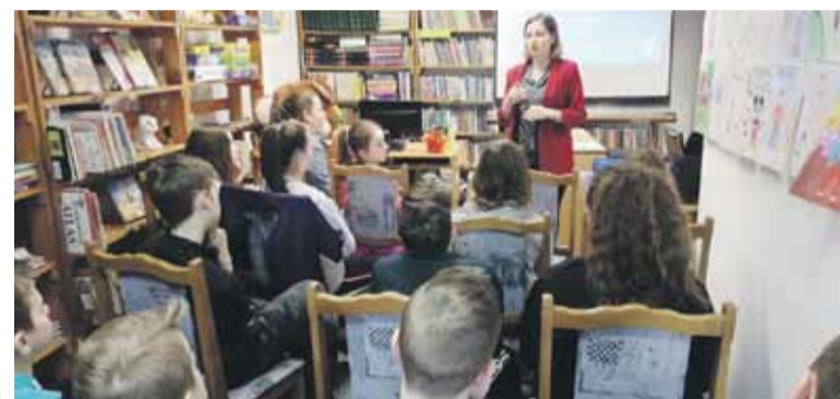
Biblioteka w planach ma kontynuowanie tego typu zajęć