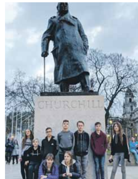
Wycieczka na długo pozostanie w pamięci wszystkich uczestników.