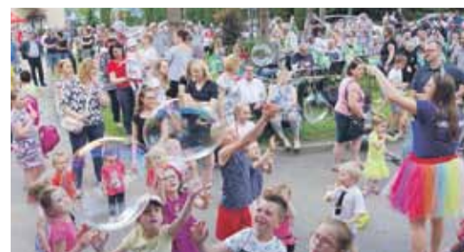
Jedną z atrakcji były wielkie bańki mydlane