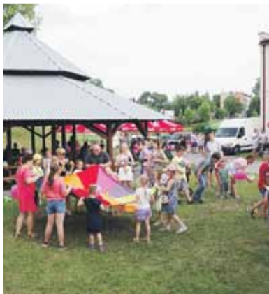
Wspólnie bawili się i starsi i młodszy