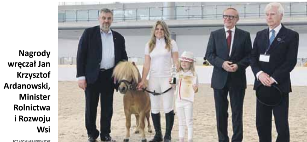
Nagrody wręczał Jan Krzysztof Ardanowski, Minister Rolnictwa i Rozwoju Wsi