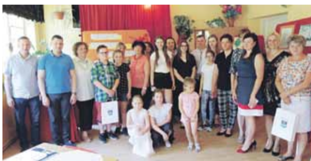
Więcej o konkursie i szczegółowe wyniki na: www.ck.gminalancut.pl

Organizatorem konkursu była Biblioteka Publiczna w Handzlówce z pomocą Centrum Kultury Gminy Łańcut. Marta Preizner