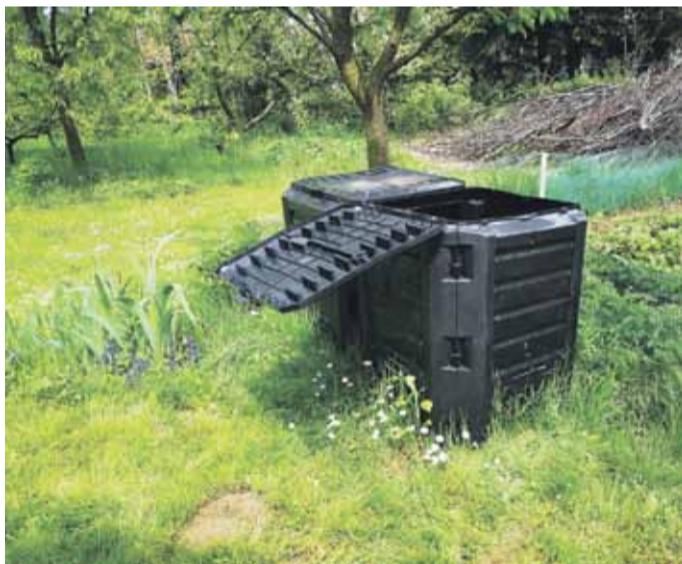
Kompostowniki to rozwiązanie na problem z zagospodarowaniem bioodpadów