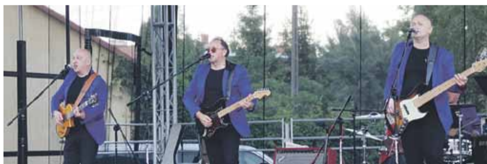
Gwiazda wieczoru – „Wędrowne gitary”