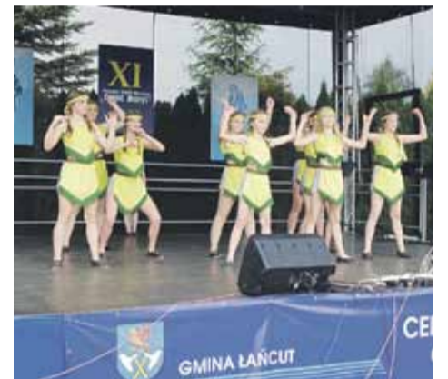
Zespół taneczny Akcent w nowej choreografii