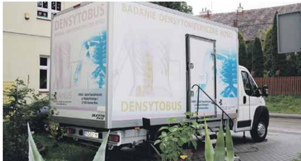
Badanie gęstości kości odbywało się w densytopusie

dofinansowania z budżetu państwa. Na liście znalazł się projekt opracowany przez naszą gminę pt. „Budowa obiektu Otwartej Strefy Aktywności w miejscowości Handzlówka”. Dzięki temu wybudowana zostanie ogólnodostępna, wielofunkcyjna plenerowa strefa aktywności dla dzieci, dorosłych i osób starszych. Całkowita wartość projektu to nieco ponad 104 tys. zł z czego 50 tys. zł pochodzi z pieniędzy Funduszu Rozwoju Kultury Fizycznej. Realizację projektu zaplanowano do końca bieżącego roku. (KB)