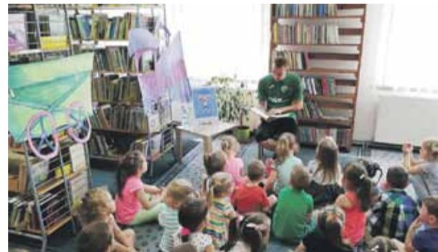
Czytanie dzieciom pobudza wyobraźnię i uczy koncentracji