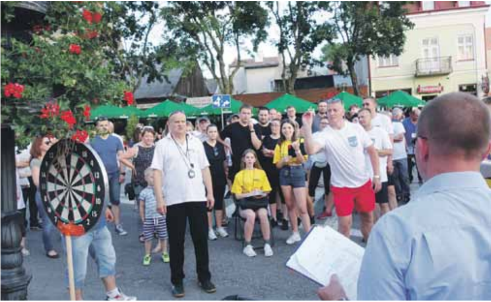
Zawody odbyły się na Rynku w Łańcut