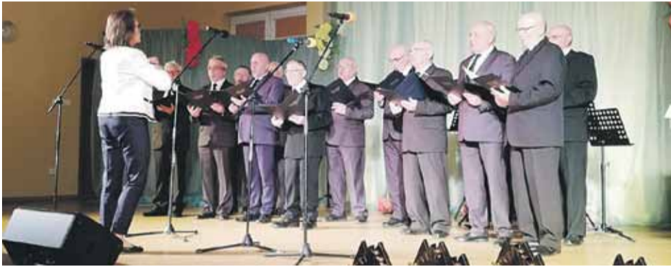
Chór męski Edwardos działa przy OK w Wysokiej FOT. MAGDALENA OLECHOWSKA