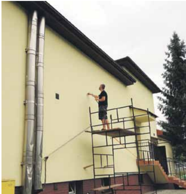
Przygotowania do rozpoczęcia prac