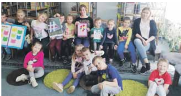
Na zakończenie zajęć bibliotekarka otrzymała od dzieci laurki z okazji Dnia Bibliotekarza