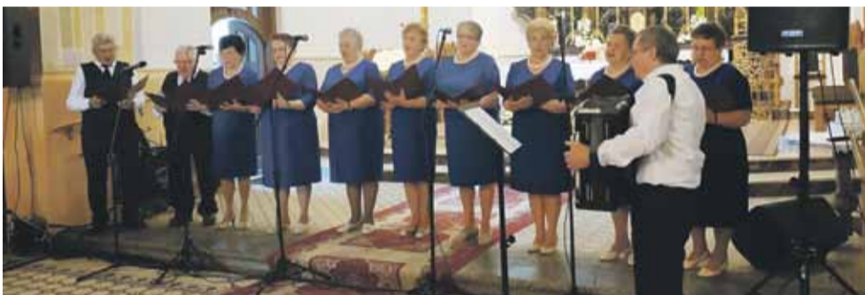
Udział w przeglądzie wzięło 8 zespołów