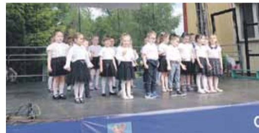
Na scenie wystąpiły przedszkolaki