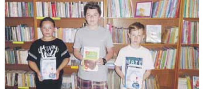
Wszyscy laureaci otrzymali nagrody

GŁUCHÓW 6 czerwca Biblioteka Publiczna w Głuchowie podsumowała kolejną edycję najdłuższego, bo trwającego cały rok kalendarzowy, konkursu pod nazwą „Najaktywniejszy Czytelnik Roku 2019”. Laureaci otrzymali pamiątkowe dyplomy, nagrody książkowe i drobne upominki. Agata Zachwieja