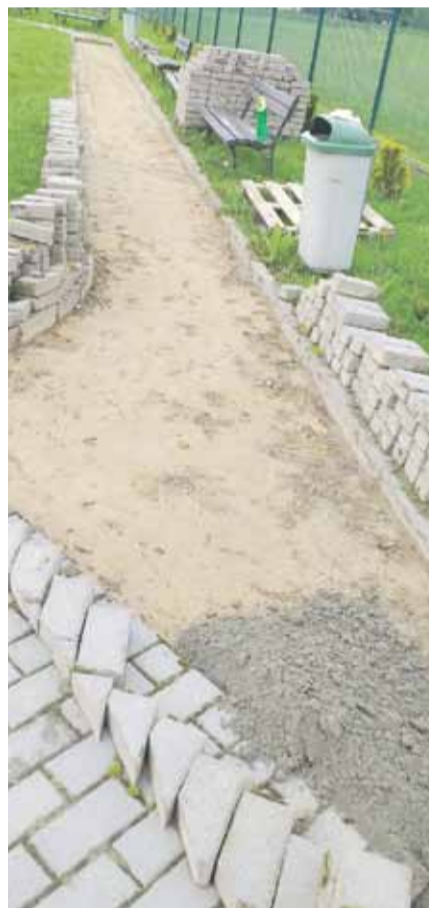
(BB) Plac zabaw w Głuchowie przed i po