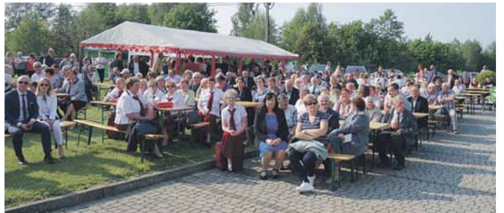
Przegląd corocznie gromadzi mieszkańców Cierpisza i nie tylko