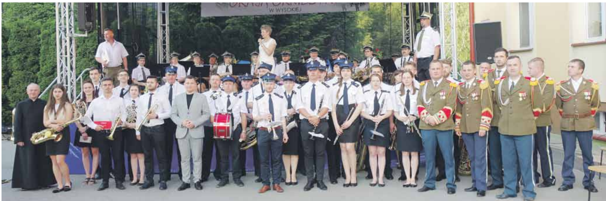
Na koniec wspólnie zagrały wszystkie orkiestry