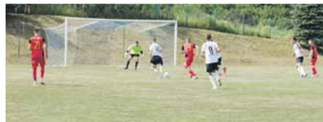
Orzeł Wysoka zakończył sezon na trzecim miejscu