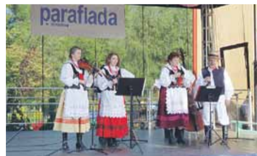
A także zespoły działające przy OK w Wysokiej