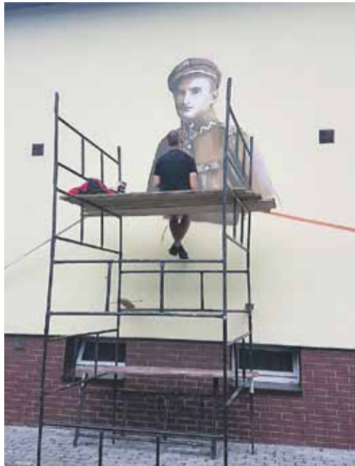
Po kilku godzinach pracy