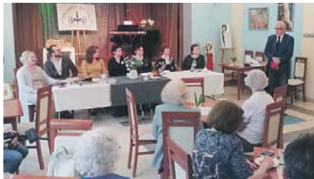
Grupa Twórcza Inspiratio ma na swoim koncie wiele osiągnięć i sukcesów