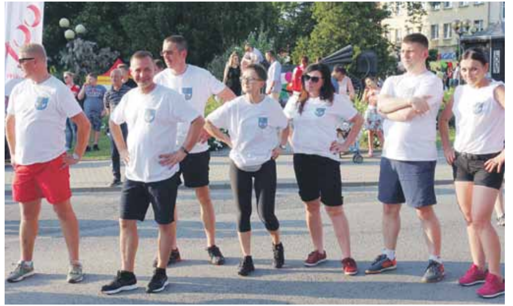
Nasza drużyna zajęła 4 miejsce