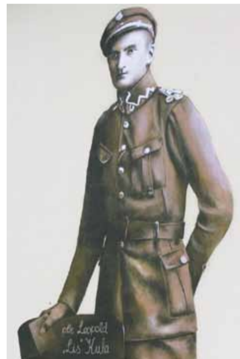
Mural gotowy! Pułkownik „Lis” Kula – bohater walk o niepodległą Polskę