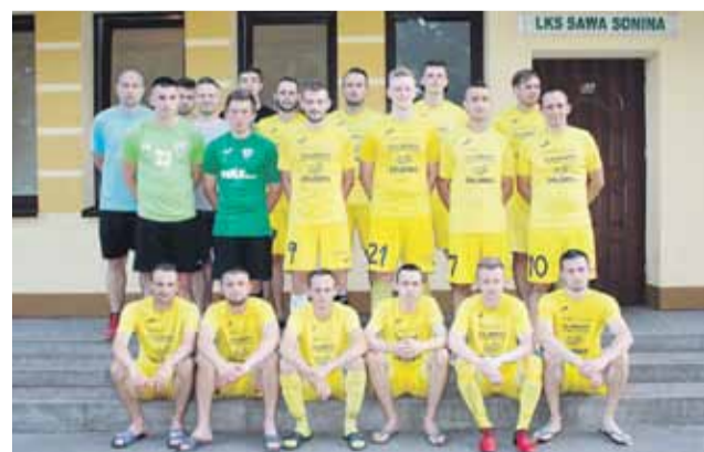
Sawa Sonina zajęła wysokie III miejsce w klasie okręgowej

- Podsumowując cały sezon i zdobyte 56 punktów można śmiało powiedzieć, że jest to bardzo udany wynik, na który zapracowała cała drużyna. Zespół należy pochwalić za konsekwentną ofensywną grę z dużą ilością strzelanych goli na mecz. Osiągnięty wynik jest potwierdzeniem słuszności obranej przez nas drogi – komentuje LKS Sawa Sonina.