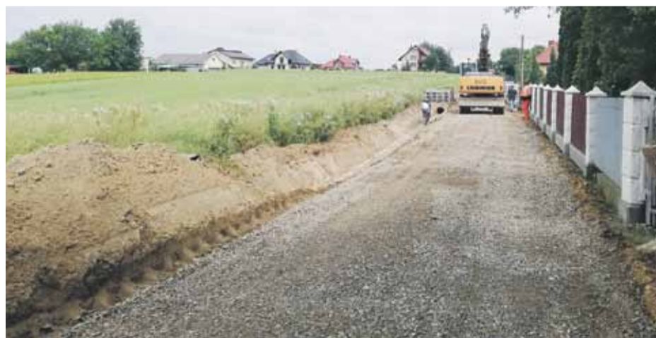
(iw) Prace nad przebudową drogi już ruszyły

Wartość umowy to ponad 200 tys. zł. Przewidywany termin zakończenia robót to 30 sierpnia 2019 r. W ramach inwestycji wykonana zostanie nawierzchnia asfaltowa o szerokości 3 m i długości ok. 318 mb. Droga stanowi łącznik pomiędzy drogą gminną wewnętrzną „Ścieżki” i drogą powiatową nr 1515R „Żołyńia - Kosina”.