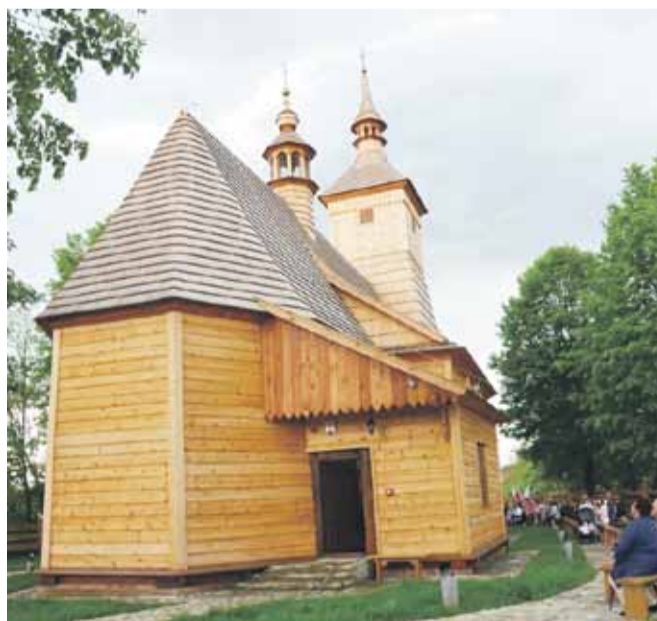
(iw) Kościół i jego otoczenie wpisane są do rejestru zabytków

W maju w kościółku odbyła się uroczysta msza św. podczas której został poświęcony. Udział w niej wzięli m.in. przedstawiciele samorządu województwa, jak i gminy Łańcut.