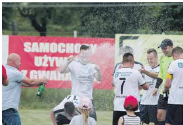
Tak awans świętowała Arka Albigowa

Z awansu cieszy się Arka Albigowa, która była liderem tabeli. Grom Handzlówka zajęła miejsce czwarte.