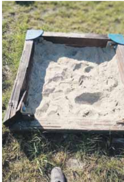
Plac zabaw w Soninie przed i po

Na placach zabaw oraz w innych gminnych miejscach koszona jest trawa. Ostatnio pracownicy ZGK posprzątały również pomieszczenia w Ośrodku Zdrowia w Kosinie. Pomagali też strażakom z OSP Kosina w usuwaniu skutków ulewy.