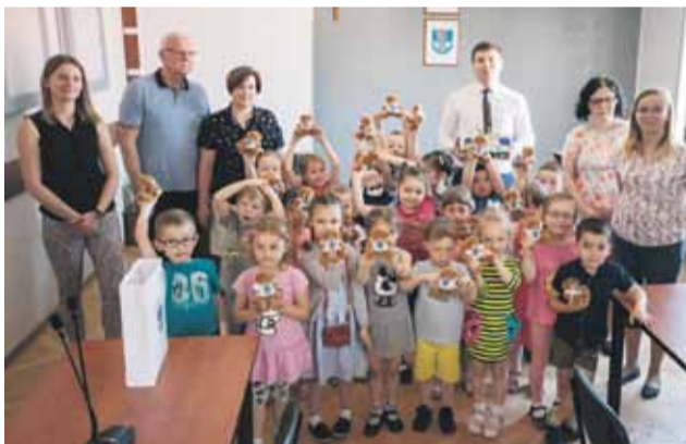
Przedkolaki otrzymały upominki – misie z herbem naszej gminy

Wójt zapewnia, że Dzień Dziecka w Urzędzie Gminy Łańcut będzie cyklicznym wydarzeniem. W przyszłym roku będą zaproszone dzieci z kolejnej miejscowości. Natomiast z okazji zakończenia roku szkolnego życzy wszystkim dzieciom i młodzieży oraz nauczycielom i pracownikom placówek oświatowych zasłużonego odpoczynku, ciepłych i bezpiecznych wakacji, pełnych przygód i nowych doświadczeń. (iw)