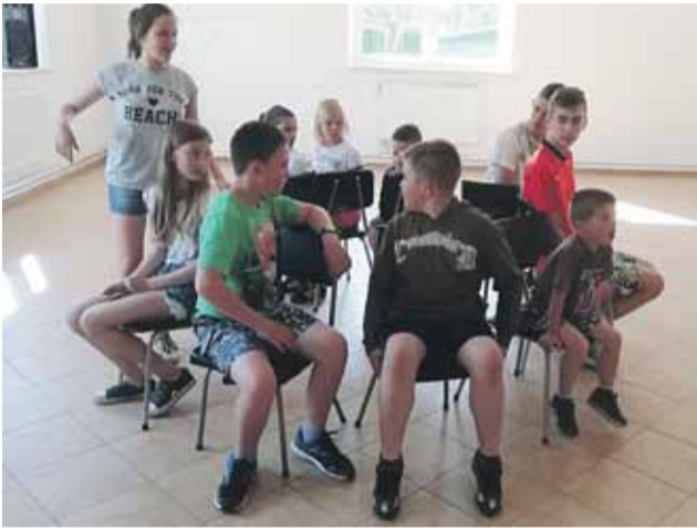
Atrakcji i radości było naprawdę bardzo wiele

CIERPISZ 3 czerwca gry, zabawy, konkursy, konkurencje sportowe, poczęstunek- kiełbaski, słodczyce i lody, przyciągnęły wielu uczestników spotkania z okazji Dnia Dziecka, zorganizowanego przez Ośrodek Kultury w Cierpiszu. W przygotowanie imprezy włączyła się także biblioteka, klub seniora, KGW i parafia. Dobry nastrój udzielił się także dorosłym i rodzicom, którzy przyszli z najmłodszymi. Spędziliśmy bardzo miło czas na wspólnej, dobrej zabawie. Starsi mieli okazję przypomnieć sobie gry z piłką, czy konkursy zręcznościowe i przy tej okazji zażyć trochę ruchu. Młodszy, wiadomo - byli znacznie lepsi, szybsi, sprawniejsi i po prostu wygrywali. Wesoły nastrój, spontaniczna rywalizacja i spotkanie z przyjaciółmi pozostawiły wiele miłych wrażeń, tym bardziej że odczuwało się już kończący się rok szkolny i upragnione wakacje. Urszula Pantoła