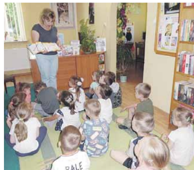
Dzieci stwierdziły, że sport to świetna zabawa