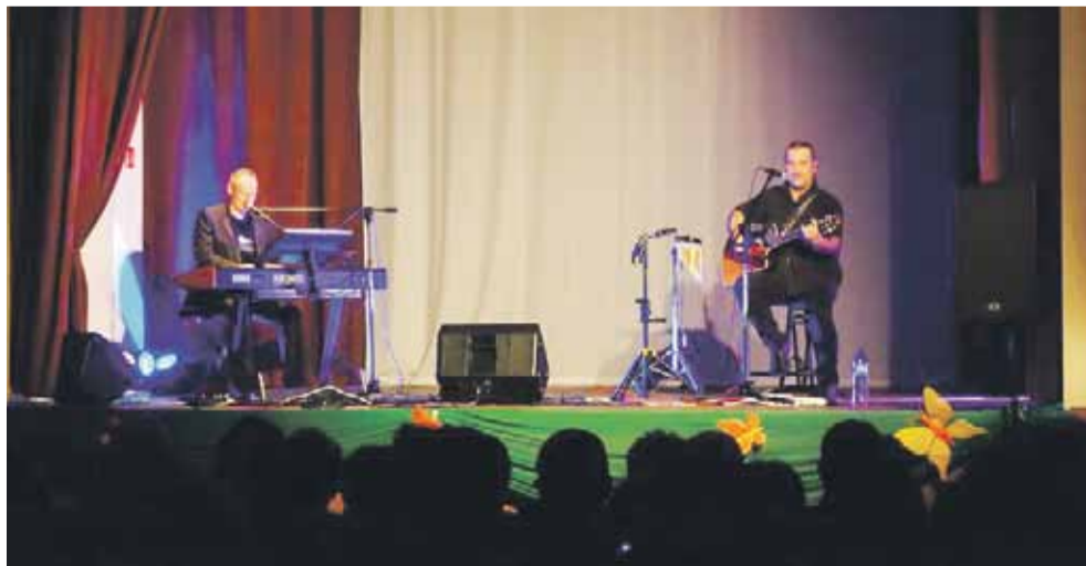
Zespół Ambitus powróci do naszej gminy w pełnym składzie. Będzie gwiazdą wieczoru na Dniu Gminy 29 czerwca