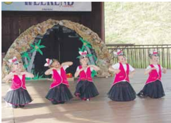
Pod „grzybkiem” zaprezentowały się zespoły działające przy OK w Głuchowie

Organizatorami wydarzenia byli: Centrum Kultury Gminy Łańcut i Ośrodek Kultury w Głuchowie oraz Ochotnicza Straż Pożarna w Głuchowie. (BB)