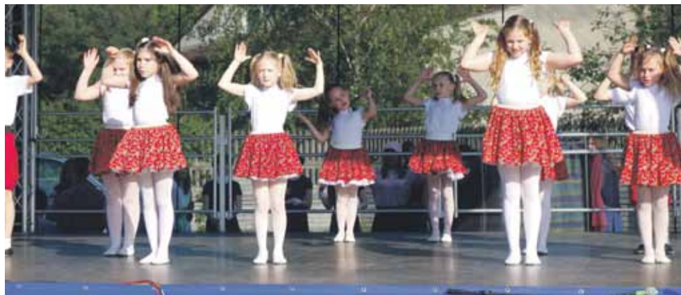
Na scenie zaprezentował się m.in. zespół „Pyza”