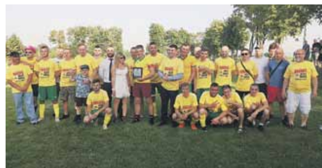
Dąb Kosina po 8 latach wraca do A klasy

Głuchowianka Głuchów zakończyła sezon na 10. miejscu.