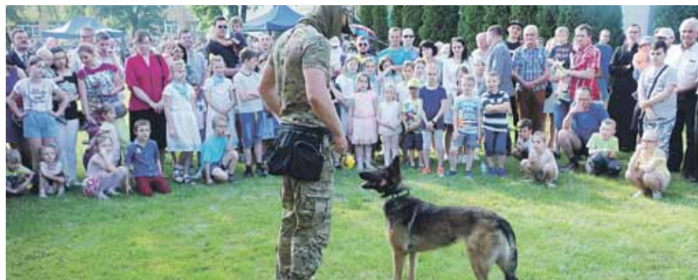
Zebrany spodobał się pokaz umiejętności psa policyjnego