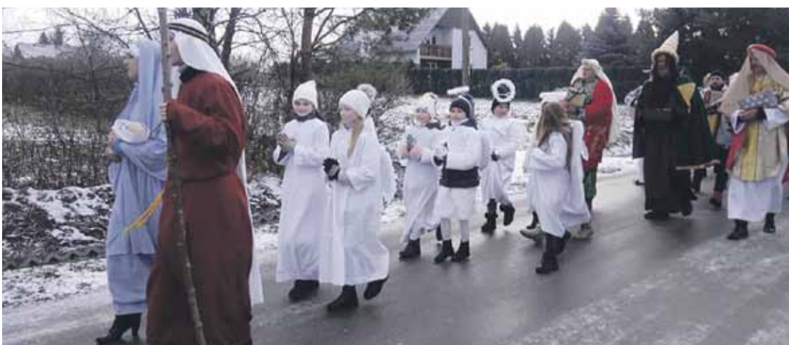
Orszak w Rogóżnie