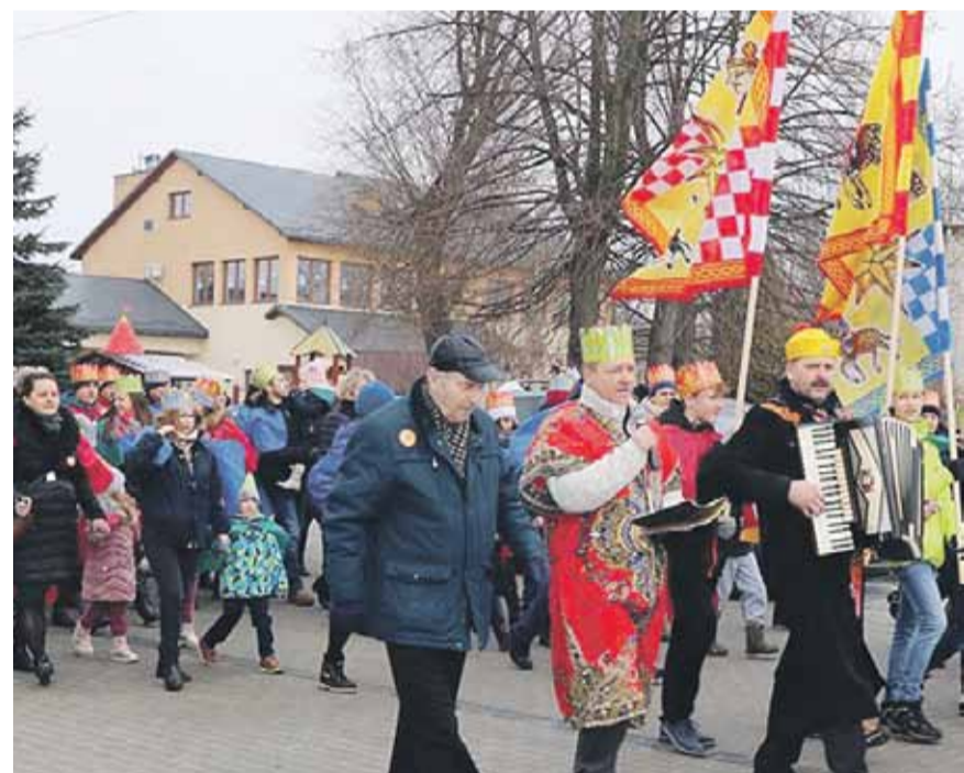
Tradycyjnie już, orszak poprowadzili Królowie oraz Józef i Maryja