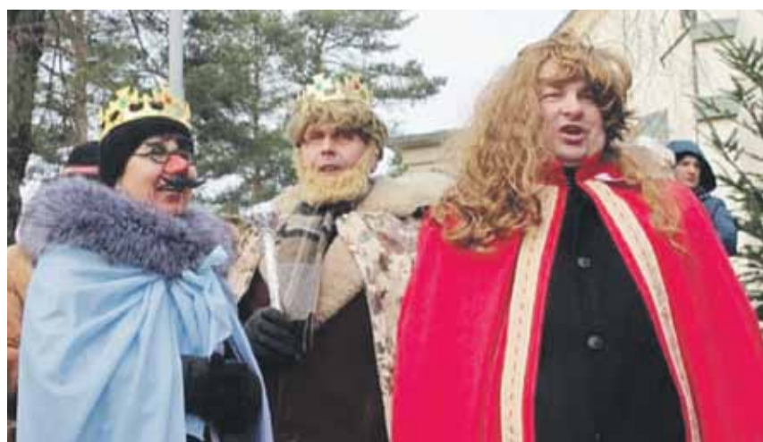
Trzej Królowie z Kraczkowej