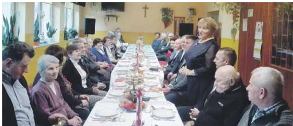
Panie z zarządu klubu przygotowały na spotkanie wiele przeróżnych dań i smakołyków