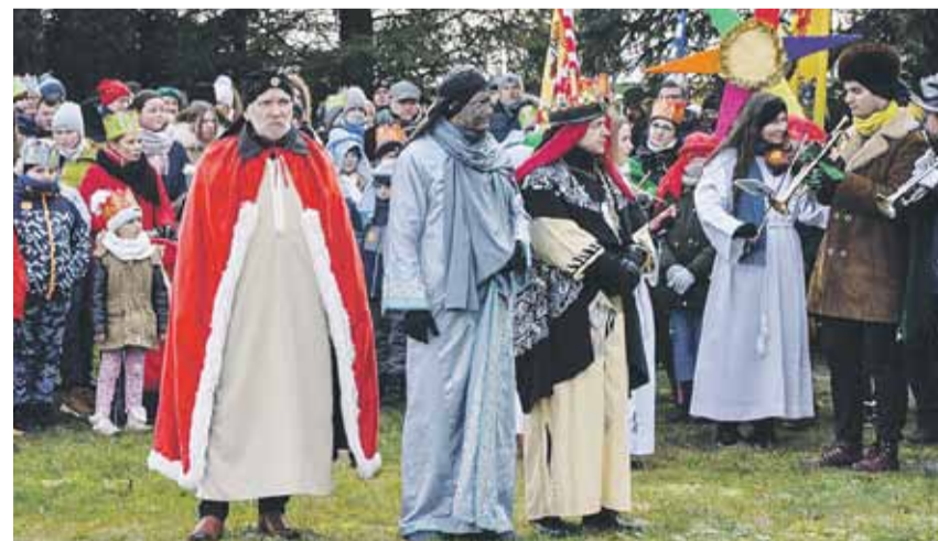
Orszak w Kosinie