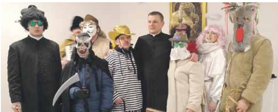
Wraz z upływem lat ten prastary zwyczaj odchodzi w zapomnienie, niestety kultywują go tylko nieliczni

Rok mieszkańców wsi, składając im przy tym starodawne życzenia. Wielu starszym mieszkańcom do których zawiatały droby, odrodziły się wspomnienia z czasów swojego dzieciństwa, kiedy to ich rodzice podtrzymywali tę tradycję. OK Sonina