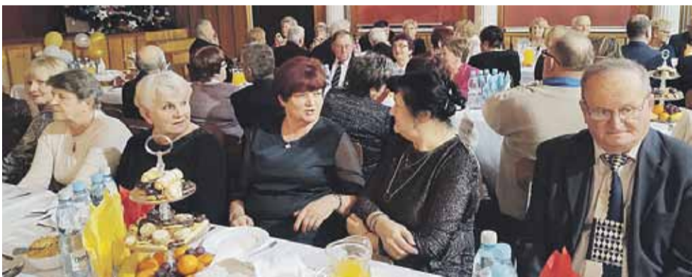
Spotkaniu towarzyszył śpiew kolęd i świąteczne życzenia

skich i parafialnych. Zebrani wysłuchali programu słowno-muzycznego, przygotowanego przez miejscową młodzież i siostry zakonne. A. Uchman