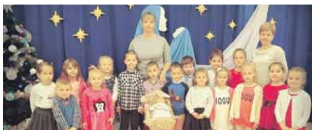
Uroczystość przebiegała w bardzo miłej i wzruszającej atmosferze