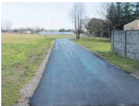
Droga „do przepompowni na Pastwiskach”

- Często jest tak że nie są one nawet własnością gminy, a to niezbędne żeby móc wydatkować na nich środki publiczne. Sposobem na przyspieszenie tempa utwardzania dróg masą bitumiczną jest sposób ogłaszania przetargów. W ramach jednego zadania chcemy realizować po kilka dróg. Taka forma jest wygodniejsza dla wykonawców, a dzięki temu mamy szansę uzyskać w przetargu korzystniejsze dla gminy ceny – tłumaczy wójt. (iw)