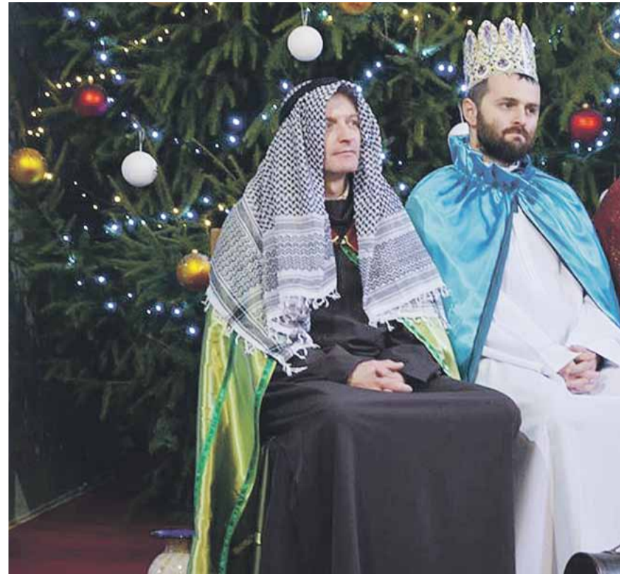
Wydarzenie to, było sposobem na ciekawe i aktywne spędzenie wolnego czasu połączone z kultywowaniem tradycji i zwyczajów