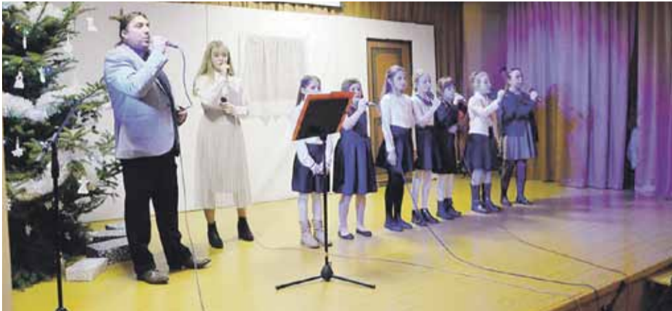
Na scenie wystąpiły m.in. zespoły działające przy Ośrodku Kultury w Rogóźnie

gi sali Domu Strażaka można było posłuchać kolęd zarówno w tradycyjnym, jak również bardziej nowoczesnym wykonaniu. Świąteczny nastrój zapewniły zespoły z Rogózna, Wysokiej, Cierpisza, Głuchowa oraz Nowosielec. (iw)