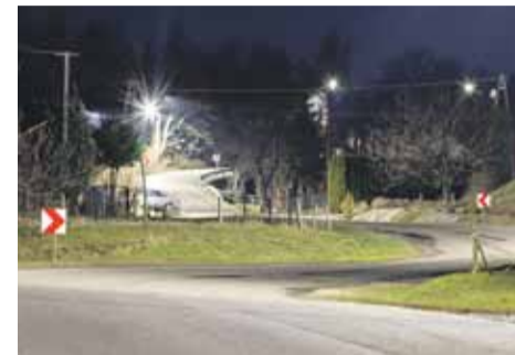
Oświetlenie wykonane jest w energooszczędnych technologiach LED

- Warto dodać, że poprawa oświetlenia to nie tylko rozbudowa, ale też wydłużenie czasu świecenia się lamp. Od listopada ub. roku lampy w gminie Łańcut świecą się do godziny 23:00. Liczymy na to, że w tym roku także uda nam się zrealizować przynajmniej część zadań oczekiwanych przez mieszkańców gminy – mówi wójt. (iw)