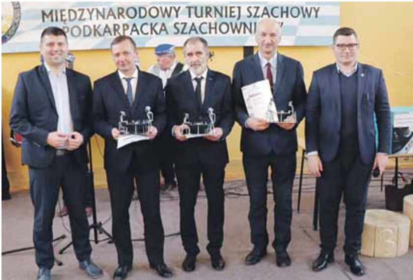
Turniej poprzedziły podziękowania dla osób, które od samego początku pracują przy organizacji „Podkarpackiej Szachownicy”