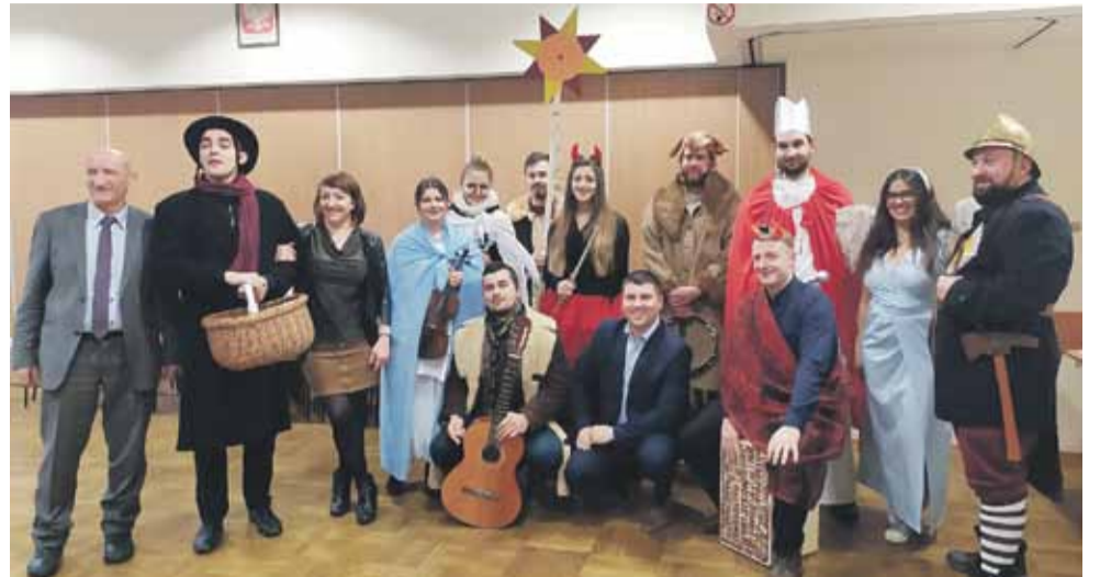
Obecni na spotkaniu ubrani byli w stroje, w których wystąpili 6 stycznia podczas Orszaku Trzech Króli

KRACZKOWA 5 stycznia w Ośrodku Kultury w Kraczkowej, na wspólnym kolędowaniu, spotkali się członkowie rady sołeckiej i przedstawiciele tutejszych organizacji społecznych. (iw)