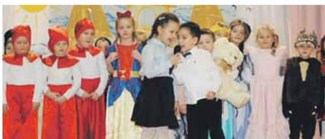
Przedszkolaki z Wysokiej uroczystość obchodzą Dzień Babci i Dziadka

To były wyjątkowe dni, pełne dumy i radości. Uśmiechnięte twarze babć i dziadków świadczyły o tym, że takie niecodzienne spotkania i chwile spędzone wspólnie z wnukami są niezwykle ważne. Kochanym Babciom i Drogim Dziadkom składamy jeszcze raz najserdeczniejsze życzenia zdrowia i samych pięknych chwil w życiu. A. Kurek