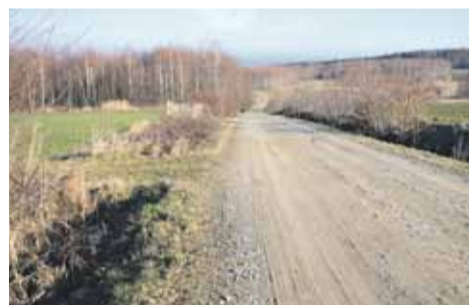
Wójt liczy na to, że gminie Chmielnik uda się pozyskać dotację na przebudowę drogi