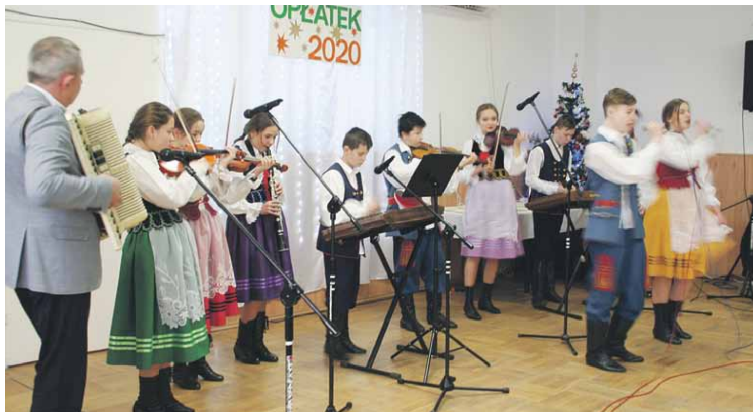
Były życzenia i wspólne śpiewanie kolęd