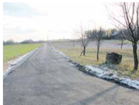
„Pod Gaj” w Handzlówce