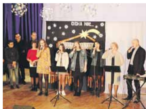
W spotkaniu wzięli udział także poeci z Grupy Twórczej „Inspiratio” i zespół „Zielony Maj”

Na stole oczywiście nie mogło zabraknąć pysznych potraw wigilijnych i słodkich ciast. Uroczystość przebiegła w ciepłej i rodzinnej atmosferze. Takie spotkania przynoszą wszystkim wiele radości i uświadamiają jak ważna w naszym życiu jest obecność drugiego człowieka. Wszystkim dziękujemy za wspólne świętowanie. Renata Hadław