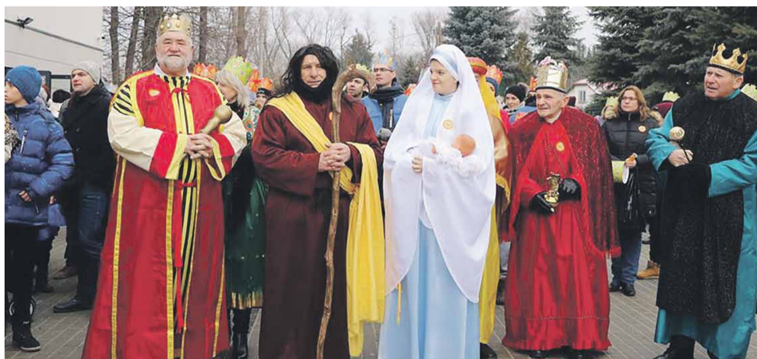
W takt kolędy „Mędrcy Świata Monarchowie” cały orszak wszedł do kościoła na mszę św.