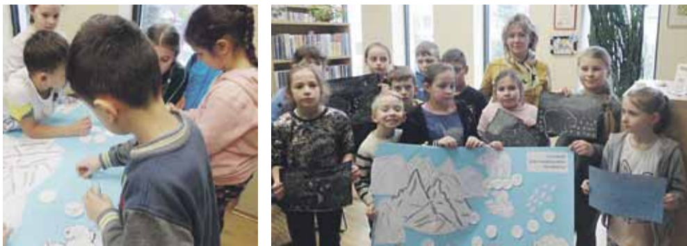
Dzieci tworzyły plakat o Arktyce Zajęcia upłynęły w wesołej atmosferze

SONINA 27 lutego obchodziliśmy Dzień Niedźwiedzia Polarne. Była to doskonała okazja do dyskusji o klimacie, ochronie przyrody, ekologii, a przede wszystkim o świecie roślin i zwierząt, w którym występują gatunki zagrożone wyginięciem.