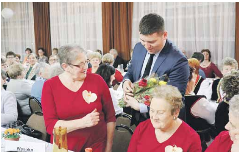
Wszystkie Panie otrzymały kwiaty od wójta gminy Łańcut