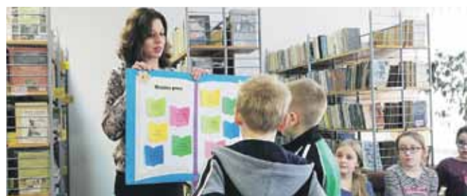
Głównym celem spotkania było przybliżenie uczniom specyfiki pracy bibliotekarza