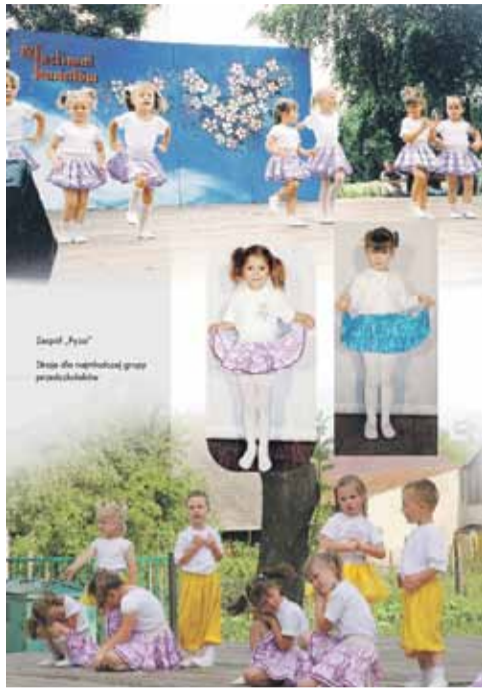
Tak wygląda jedna z 180 stron albumu (iw)

Zespoły działające przy CKGŁ występowały w nich na różnych wydarzeniach kulturalnych zarówno w Polsce, jak i poza jej granicami. Album liczy około 180 stron i podzielony jest na 10 części – 9 z nich przedstawia zespoły z poszczególnych miejscowości naszej gminy, ostatnia natomiast to elementy strojów ludowych. Wydanie takiego albumu jest niestety wyzwaniem finansowym. Dlatego CKGŁ planuje uruchomić zbiórkę dla zainteresowanych albumem. Więcej informacji będziemy podawać w kolejnych wydaniach „Głosu Gminy Łańcut”, a także na facebooku CKGŁ.