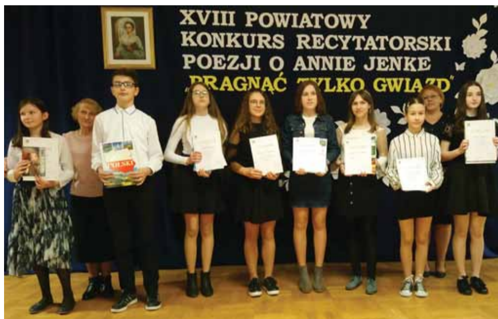
O wartości konkursu, który ma już 18 lat, świadczy to, że stale przyciąga nowych uczestników i w coraz to nowej rzeczywistości uwrażliwia „na miłość i piękno człowieka”