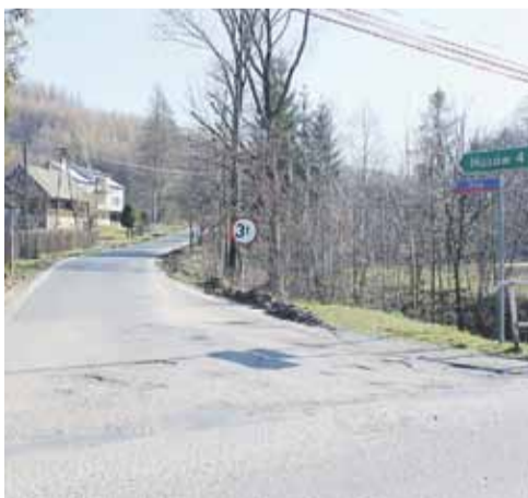
Umowa na remont drogi została podpisana jeszcze w grudniu ubiegłego roku

w terenie falistym. Na odcinku remontu drogi przewidziano odbudowę istniejących zjazdów. Koszt remontu wyniesie ok. 900 tys. zł, z czego ponad 630 tys. to dofinansowanie z Funduszu Dróg Samorządowych. W Cierpiszu remont obejmie prawie kilometr drogi. Również poprawiona zostanie nawierzchnia i umocnione pobocza. Koszt prac wyniesie ponad 273 tys. zł. Fundusz Dróg Samorządowych dołoży 191, 4 tys. zł. (iw)