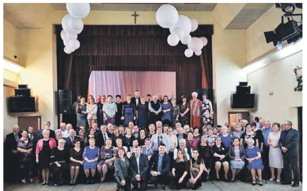
Były śpiewy, tańce, a na koniec wspólne zdjęcie