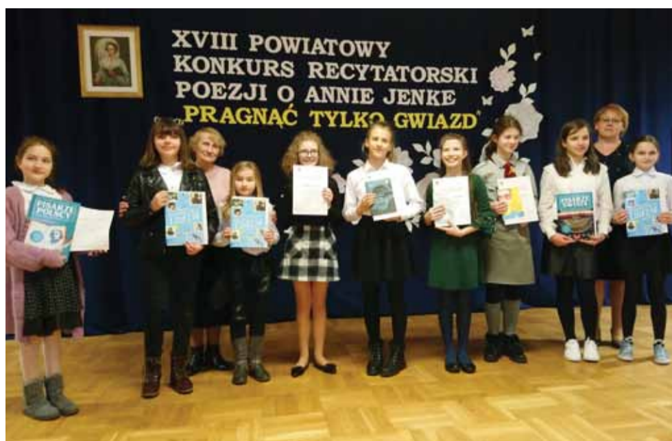
Realizacja tegorocznego konkursu była możliwa dzięki dofinansowaniu przez Gminę Łańcut