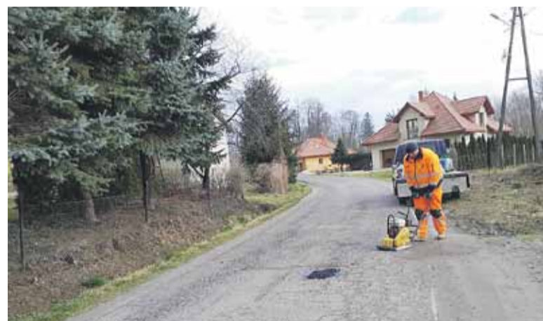
Łatanie dziur tzw. „zimnym asfaltem”