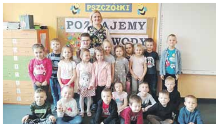
Dzieci odwiedziła także bibliotekarka