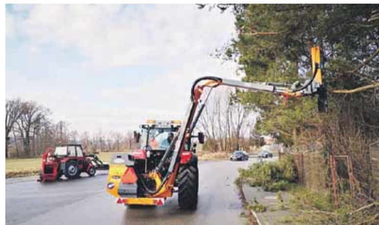
Zarząd Dróg Powiatowych prowadzi przecinkę gałęzi przy drogach. W pracach pomaga ZGK Gminy Łańcut