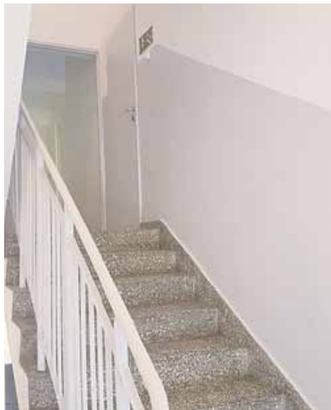
Odświeżona klatka schodowa w OK w Wysokiej