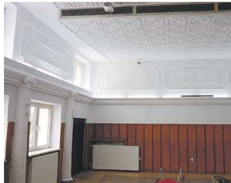
Sala OK w Kosinie po malowaniu