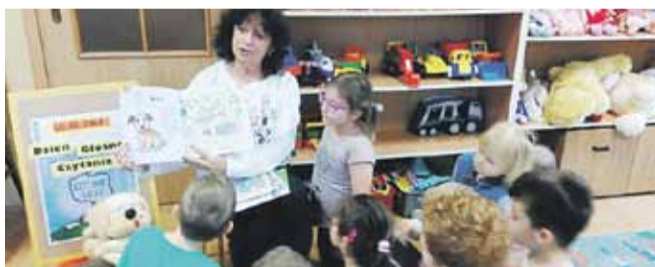
W dzień Głośnego Czytania przedszkolaków odwiedziła bibliotekarka