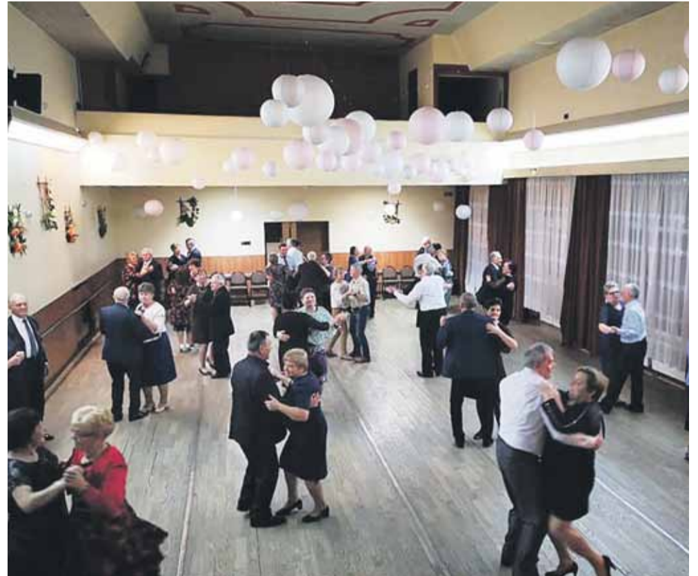
Wszyscy świetnie się bawili

Tulipany mają różne znaczenie w zależności od barwy. Żółte są alegorią radości. Symbolizują pogodne myśli i szczęście