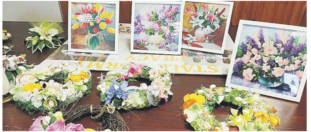
Panie wykonywały m.in. wianki, ozdoby na drzwi i okna