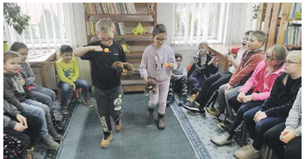
Dzieci miały mnóstwo zabawy