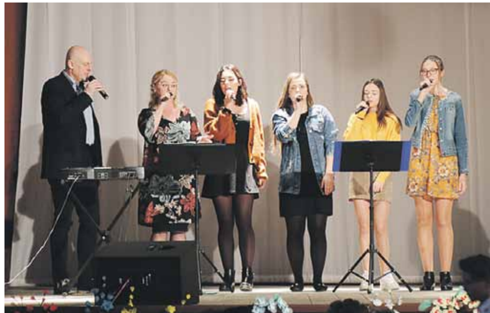
Program słowno-muzyczny przygotował zespół Zielony Maj i Grupa Twórcza „Inspiratio” z Cierpisza