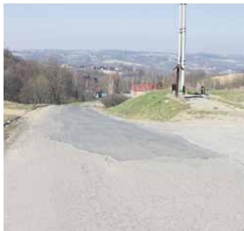
Wykonawcą inwestycji jest Miejskie Przedsiębiorstwo Dróg i Mostów w Rzeszowie