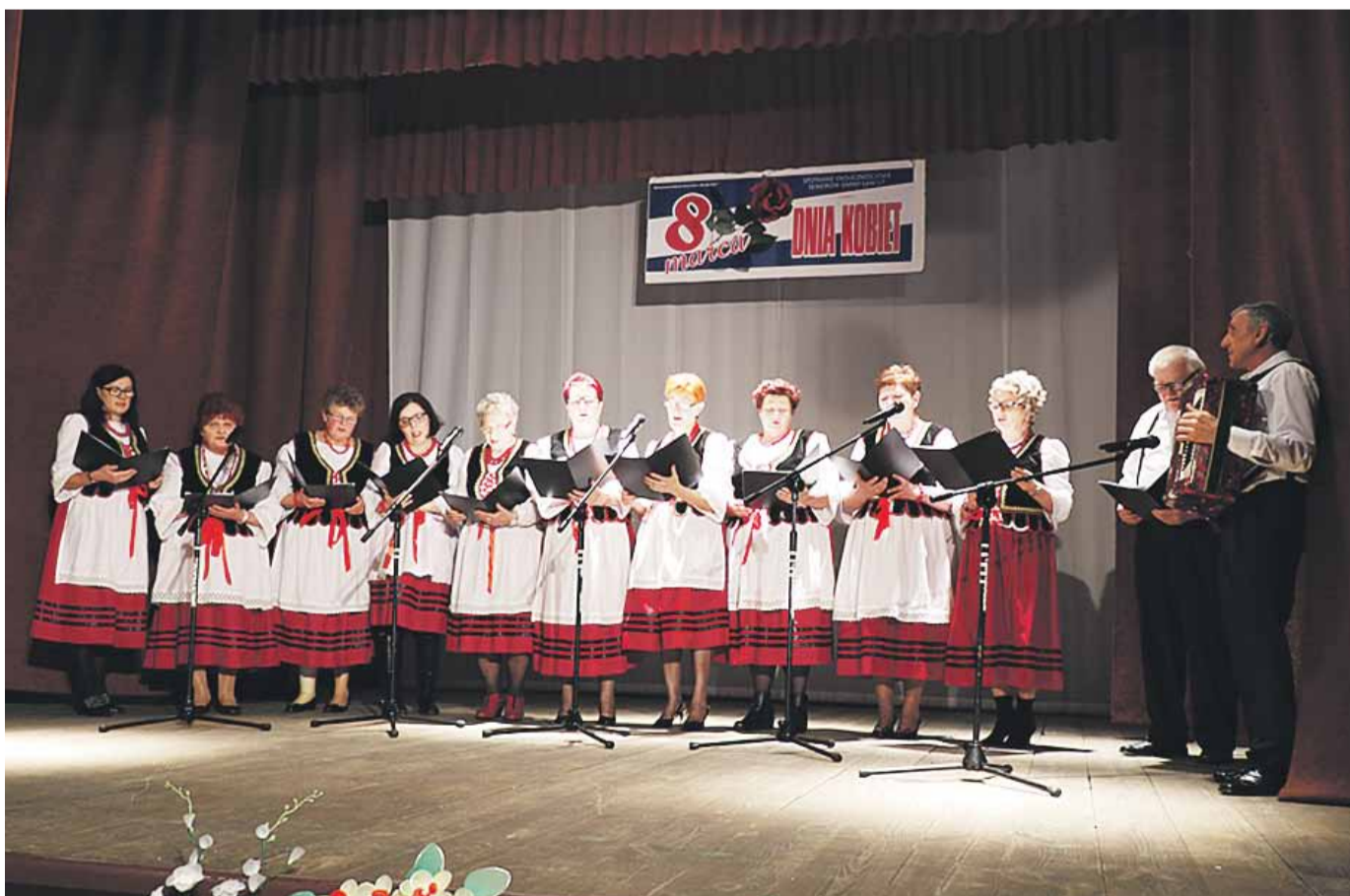
Na scenie wystąpił m.in. reaktywowany po latach zespół śpiewaczy KGW z Soniny