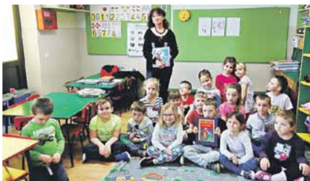
Bibliotekarka opowiedziała dzieciom krótko o historii powstania Biblioteki w Handzłówce oraz tradycji czytelnictwa, która sięga ponad 60-lat