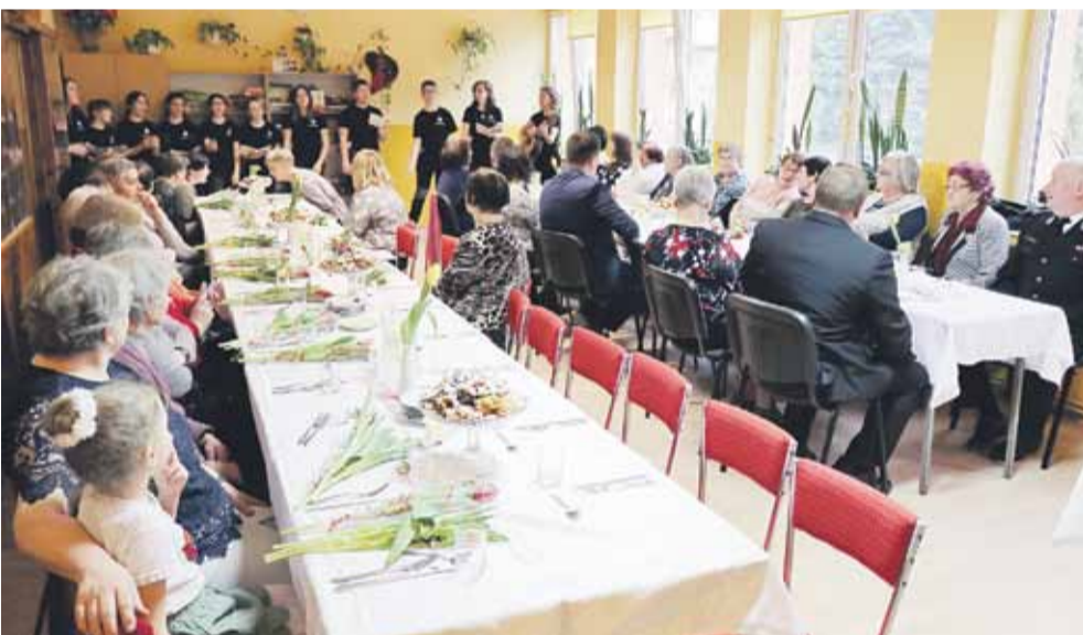
Spotkanie umilił występ handzłowskich harcerzy i zuchów