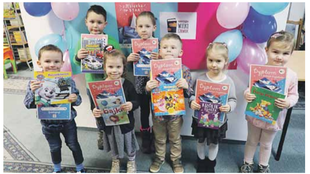
Projekt jest prowadzony także przez pozostałe biblioteki naszej gminy – Handzlówkę, Kosinę, Głuchów i Soninę