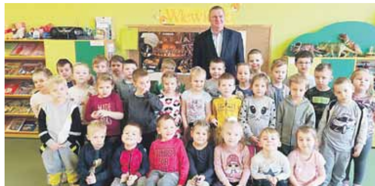
Przedszkolaki z sołtysem Kosiny