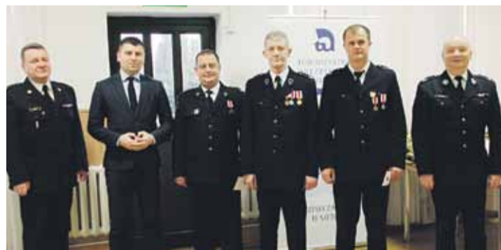
Spotkanie było także okazją do wręczenia medali za zasługi dla pożarnictwa

ALBIGOWA Na przełomie lutego i marca odbywały się spotkania sprawozdawcze Ochotniczych Straży Pożarnych z naszej gminy.