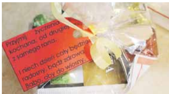
Szyszki dla wszystkich Pań przygotowane przez (iw) zarząd KGW

HANDZLÓWKA W marcu rozpoczął się cykl spotkań sprawozdawczych Kół Gospodyń Wiejskich z terenu gminy Łańcut. 7 marca takie spotkanie odbyło się w Ośrodku Kultury w Handzlówce. Oprócz m.in. podsumowania działalności KGW z ubiegłego roku, zebranie było okazją do świętowania Dnia Kobiet.