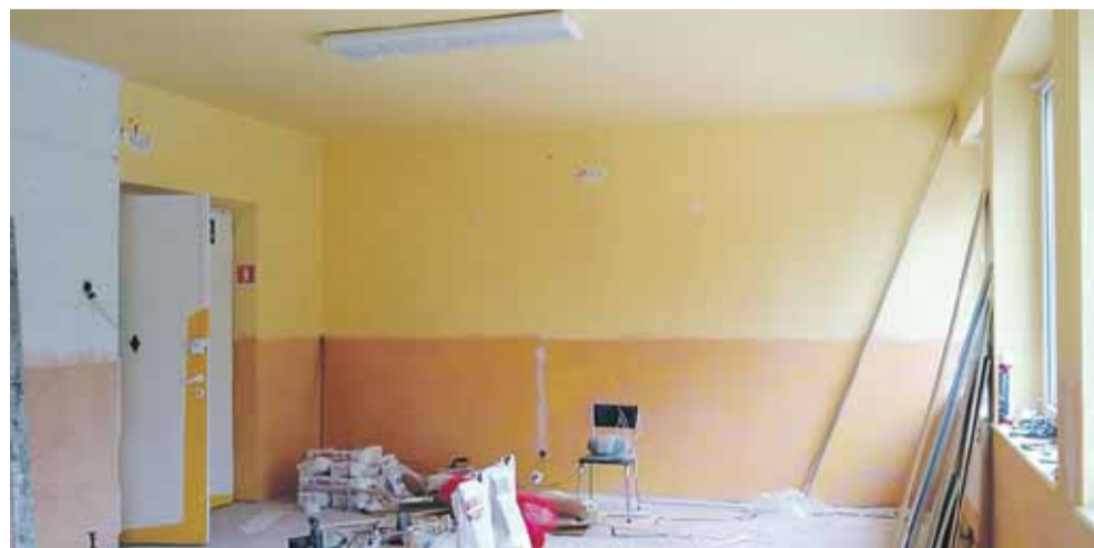
Remont w Handzlówce rozpoczęty

Remont rozpoczął się już także w Ośrodku Kultury w Handzlówce. Tu-