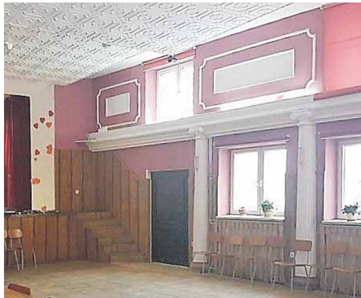
Tak wyglądała sala w OK w Kosinie