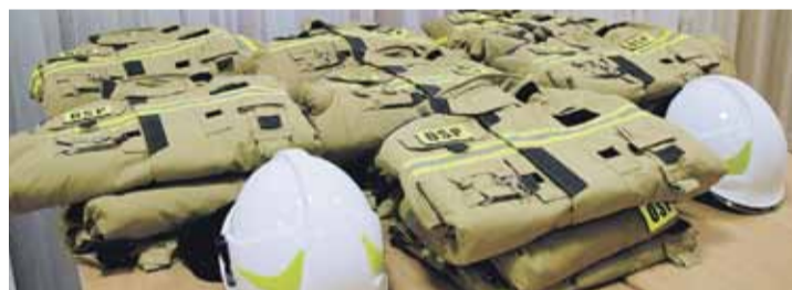
Nowe ubrania dla strażaków z Albigowej