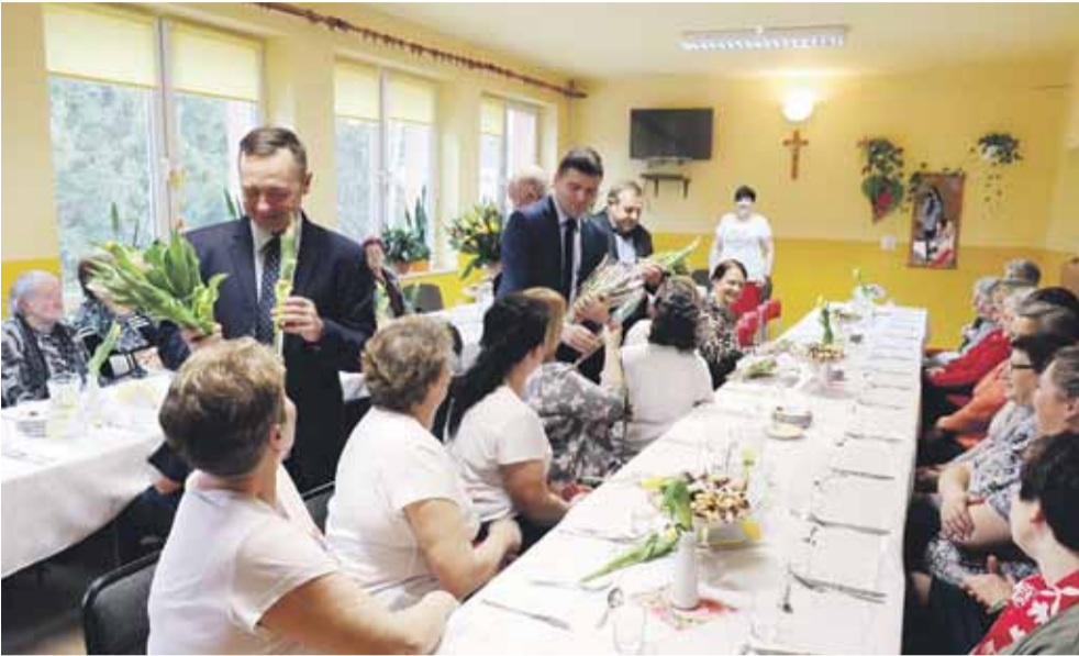
Wszystkie Panie otrzymały tulipany

HANDZLÓWKA W marcu rozpoczął się cykl spotkań sprawozdawczych Kół Gospodyń Wiejskich z terenu gminy Łańcut. 7 marca takie spotkanie odbyło się w Ośrodku Kultury w Handzlówce. Oprócz m.in. podsumowania działalności KGW z ubiegłego roku, zebranie było okazją do świętowania Dnia Kobiet.