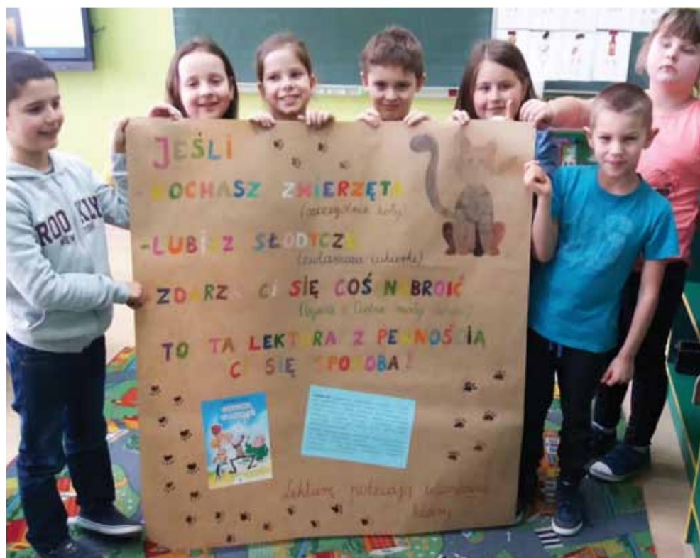
Dzieci przygotowały m.in. plakaty zachęcające do czytania