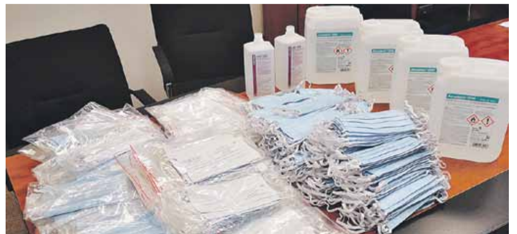
Pierwsza partia materiałów zabezpieczających działalność OSP z terenu gminy Łańcut trafiła do jednostek. Zapasy będą na bieżąco uzupełniane