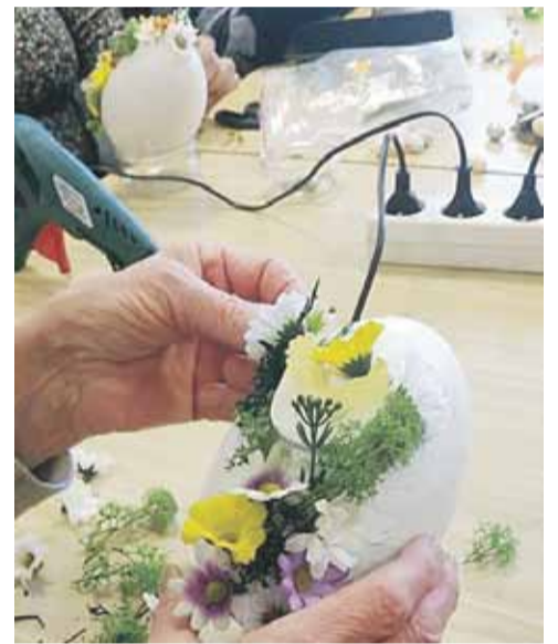
W warsztatach wzięło udział 15 osób