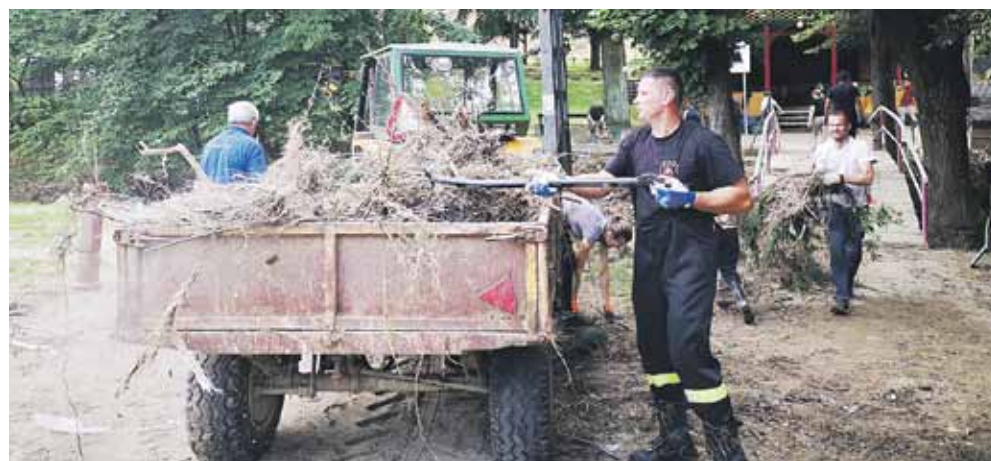
Akcja sprzątania parku Magrysia