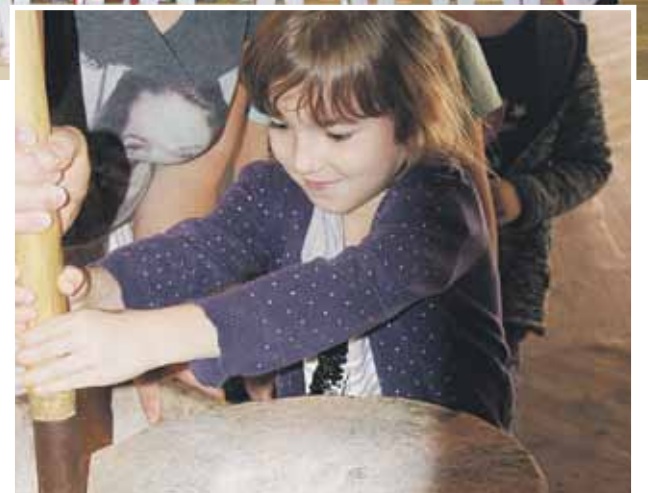
Owiedziły też Siedlisko Jantar w Pstrągowej

balu. W placówce odbyły się również: Dzień Przedszkolaka, Dzień Misia, uroczyste Pasowanie na Przedszkolaka. W Świątowy Dzień Uśmiechu i Życzliwości 21 listopada, w progu przedszkola witała dzieci i opiekunów jedna z nauczycielek przebrana za radosny emotikon z życzeniami, ciasteczkami i uśmiechniętym kwiatuszkiem. Podczas izolacji w domach, spowodowanej epidemią, dzieci pod czujnym okiem rodziców sadziły cebulki kwiatów i kwiaty „W małym ogródeczku” oraz wykonywały różnorodne prace plastyczne różnymi technikami. Wszystkie podjęte tak licznie działania rozwijały umiłowanie do Małej i Dużej Ojczyzny, wzbudzały szacunek dla naszego państwa, kształtowały poczucie tożsamości narodowej i regionalnej, a także umacniały poczucie więzi rodzinnej. Dzieciom, Rodzicom i Nauczycielom za ogromne zaangażowanie w realizację tego projektu dziękuję serdecznie jako koordynatorka.