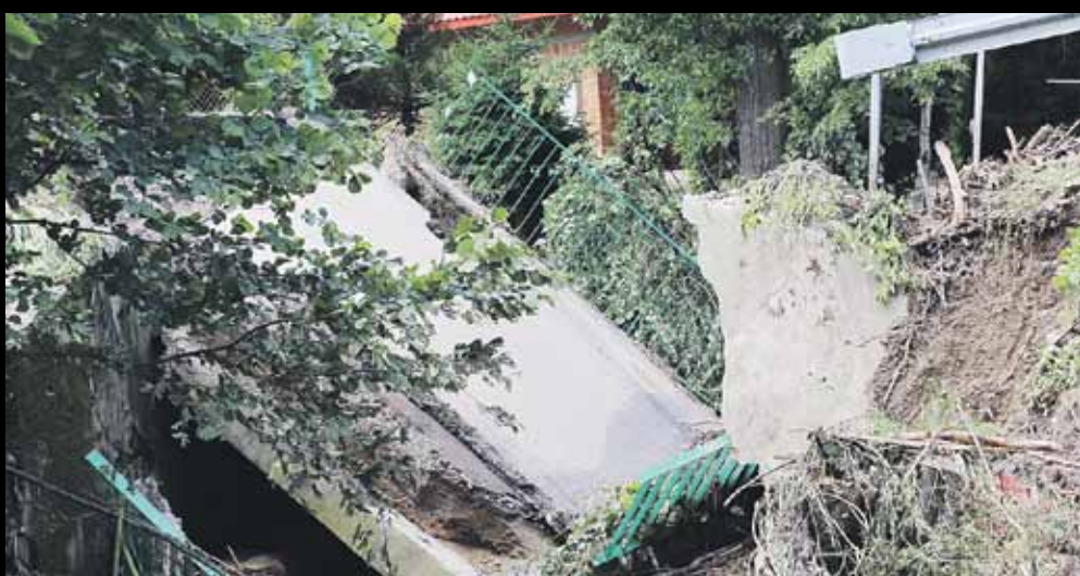
Teraz do Handzlówki trzeba jechać „na oko” przez Husów lub Albigową Honie