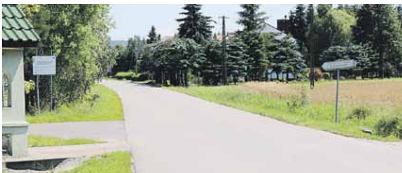
Gmina do budowy chodnika ma dołożyć 300 tys. zł.