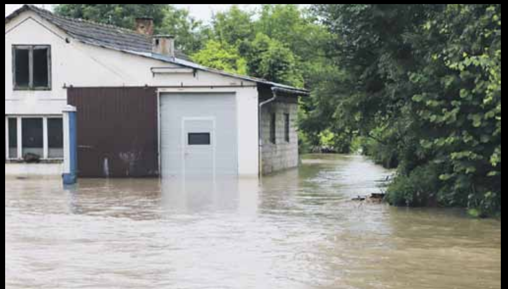
W tym miejscu strażacy utatowali psa znajdującego się w budzie