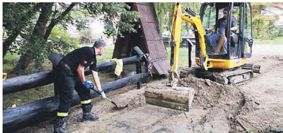
Prace porządkowe trwały jednocześnie w wielu miejscach, zarówno na górze jak i na dole wsi