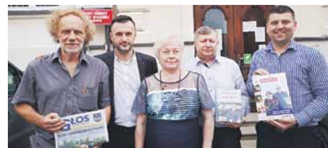
– Stowarzyszenie z pomocą CKGŁ przekazało do każdej biblioteki w naszej gminie najnowszy nr Głosu Seniora oraz kilka egzemplarzy członkom stowarzyszenia