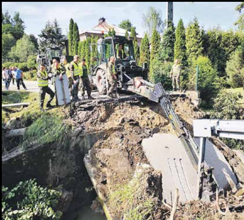
W odgruzowaniu Sawy pomagało Wojsko Inżynieryjne z Niska