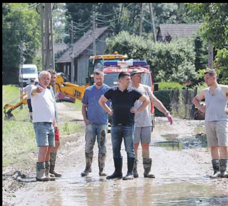
Porządki po powodzi to także usuwanie ogromnych ilości odpadów gabarytowych, czy szlamu i innych nieczystości, które woda zostawiła po sobie