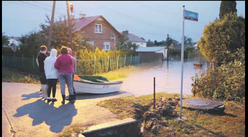
Droga Spokojna w Albigowej – odpompowywanie wody trwało do niedzieli