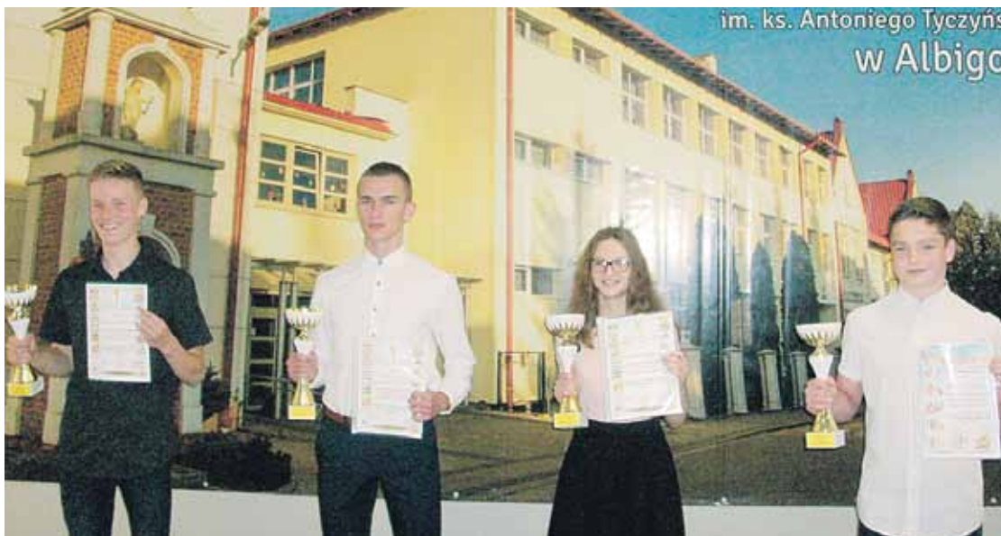
„Sportowcy roku Gminy Łańcut” w dowód uznania otrzymali dyplomy oraz puchary za wybitne wyniki sportowe na poziomie gminy, powiatu i województwa