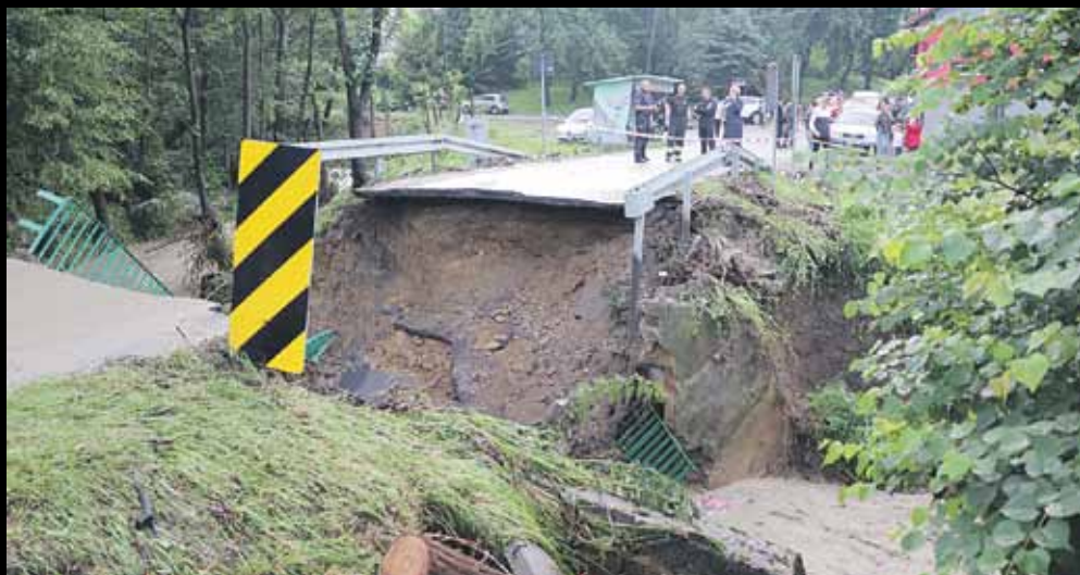
Zerwany most w Handzlówce