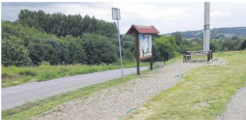
O porządek w takich miejscach dba ZGK Gminy Łańcut