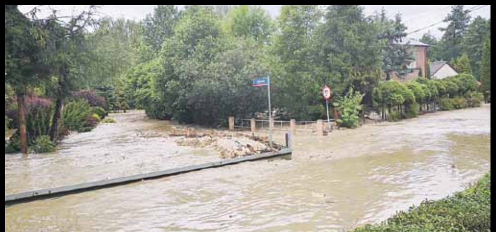
Droga w Handzlówce zamieniła się w rwącą rzekę