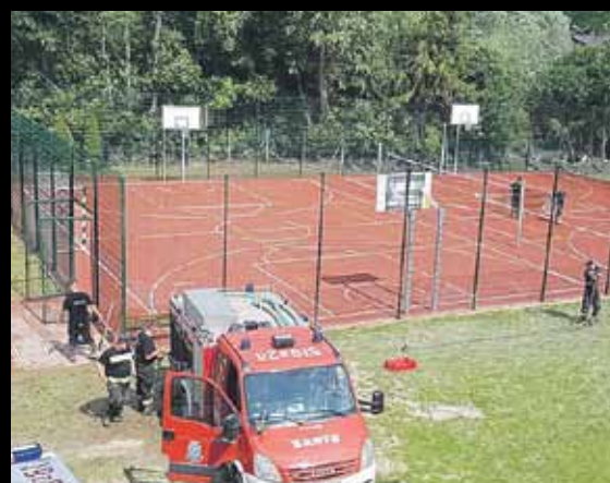
Boisko po wyczyszczeniu przez strażaków