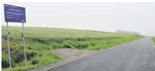
Drogi wyremontowało Miejskie Przedsiębiorstwo Dróg i Mostów w Rzeszowie