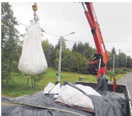
W ubiegłym roku udało się odebrać od mieszkańców 162 tony odpadów azbestowych