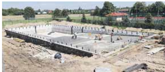
Głębokość basenu zostanie zmniejszona z 3.30 m na 2.70 m

- To jedna z najważniejszych inwestycji samorządu tej kadencji. Myślę, że na basen czekają nie tylko mieszkańcy Wysokiej, ale i całej gminy. Liczę na to, że prace pójdą zgodnie z planem i już w przyszłym roku będzie można tutaj spędzać wakacje – mówi wójt Jakub Czarnota. (BB)