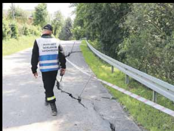
Zniszczony fragment drogi powiatowej w Handzlówce