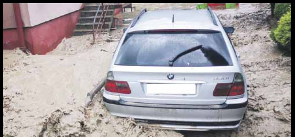
Zalane zostały także samochody