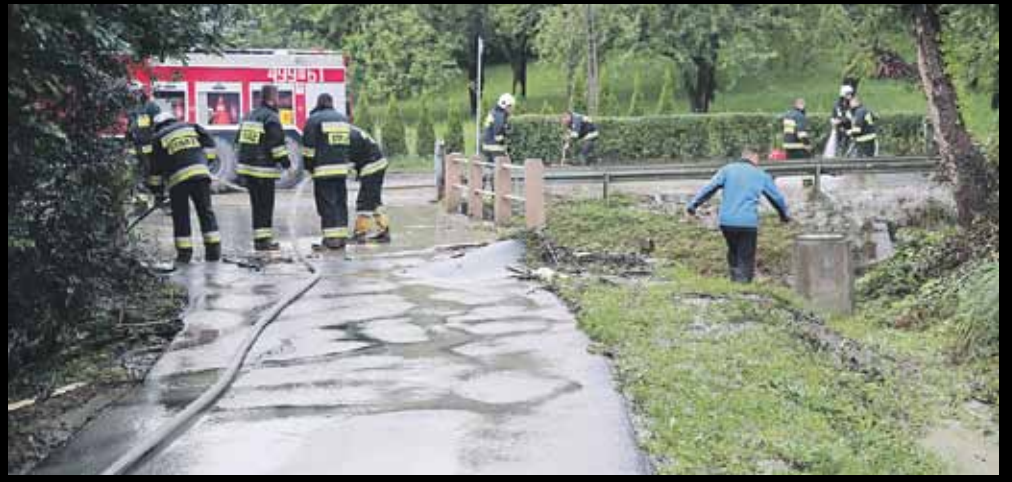
Porządki po opadnięciu poziomu wody w Sawie. Uczestniczyli w nich też pracownicy ZGK