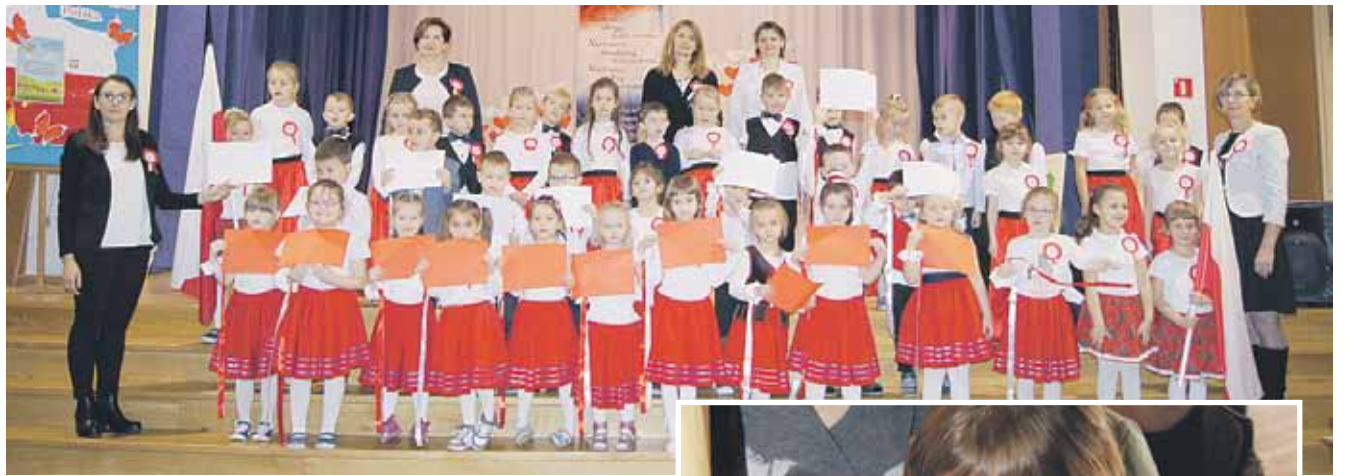
Przedszkolaki brały udział m.in. w koncercie patriotycznym