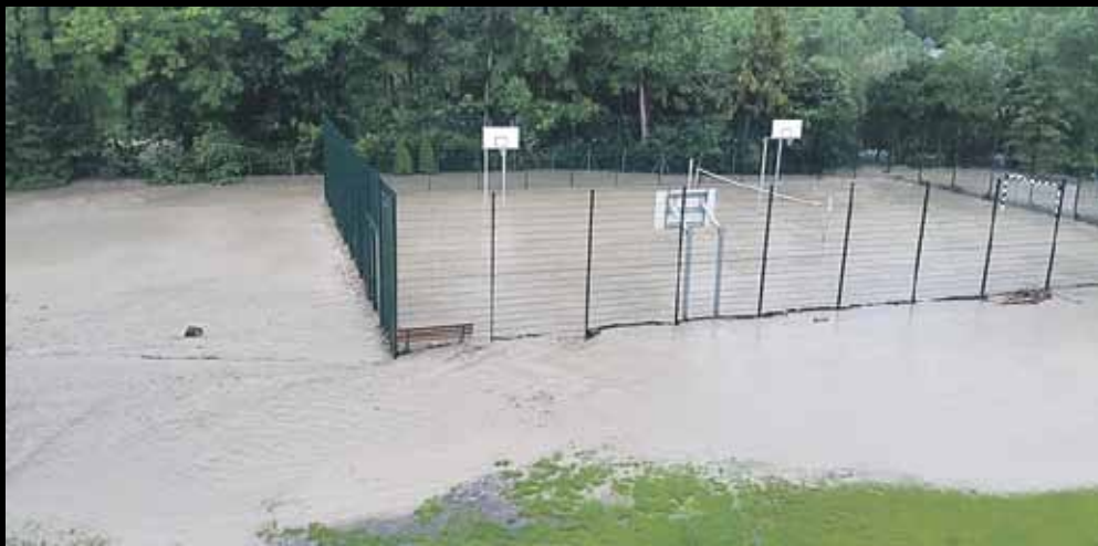
Woda zalała niedawno otwarte boiska wielofunkcyjne