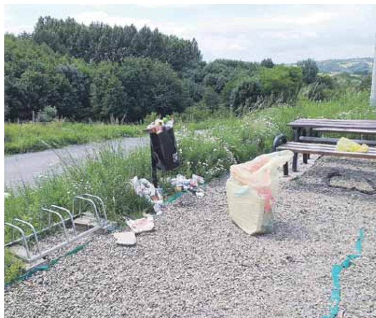
Punkt widokowy w Handzlówce – taki bałagan często zostawiają po sobie odpoczywające tam osoby

- Ogólnodostępne miejsca odpoczynku i rekreacji mają służyć każdemu. Dlatego szanujmy cudze mienie i pracę – dodaje. (iw)