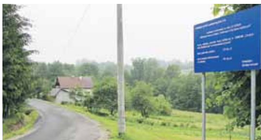
Łączny koszt inwestycji wyniósł blisko 1,2 mln zł

piszu remont objął 0,955 km drogi. Tam również poprawiona została nawierzchnia i umocnione zostały pobocza. Koszt prac wyniósł ponad 273 tys. zł., a dofinansowanie z Funduszu Dróg Samorządowych 191,4 tys. zł. (BB)