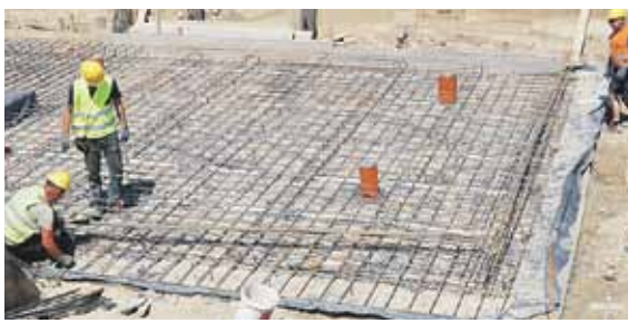
W tym miejscu powstanie budynek technologiczny (tzw. zaplecze)