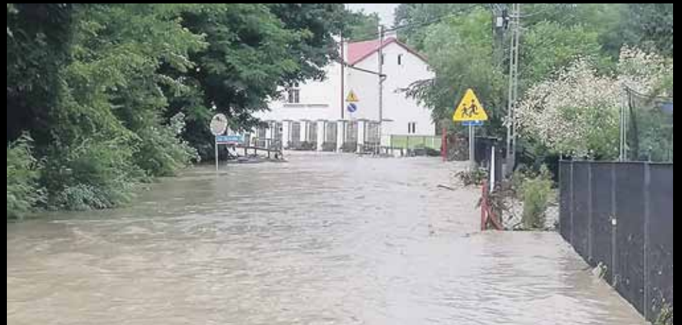
Droga koło szkoły w Albigowej