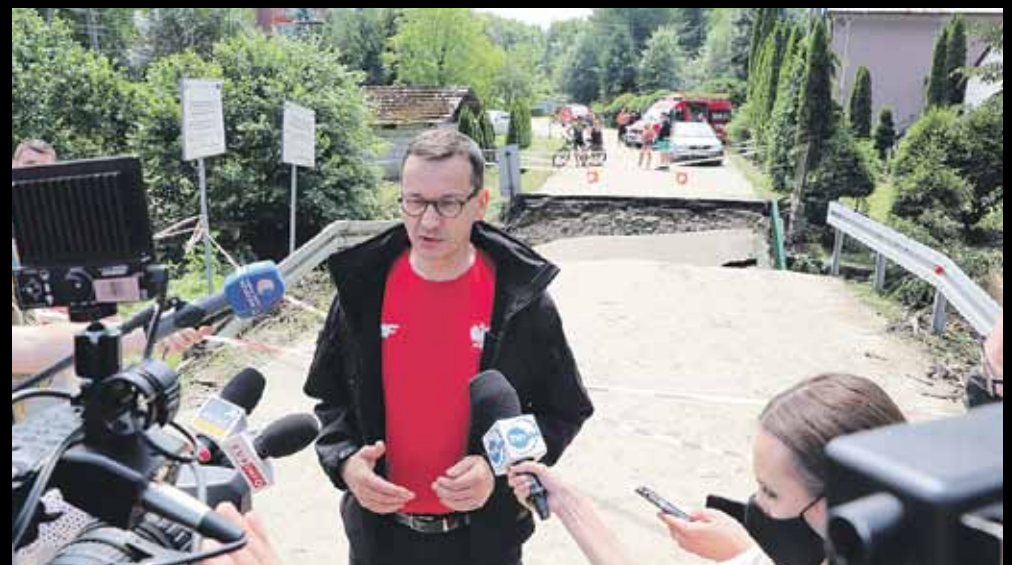
W trakcie konferencji prasowej, która odbyła się przy zniszczonym moście w Handzlówce, premier obiecał, że rząd wesprze gminy, które ucierpiały w wyniku powodzi