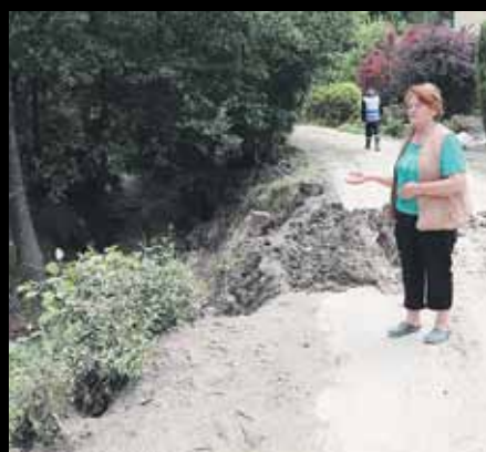
Tutaj wszystko było pod wodą – pokazywała mieszkanka Handzlówki