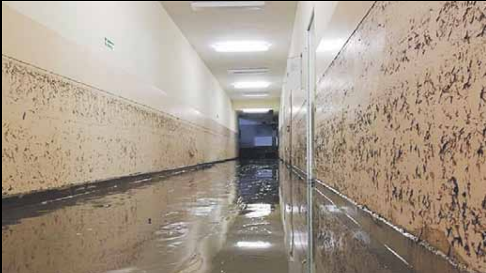
Woda wlała się do szkoły w Albigowej