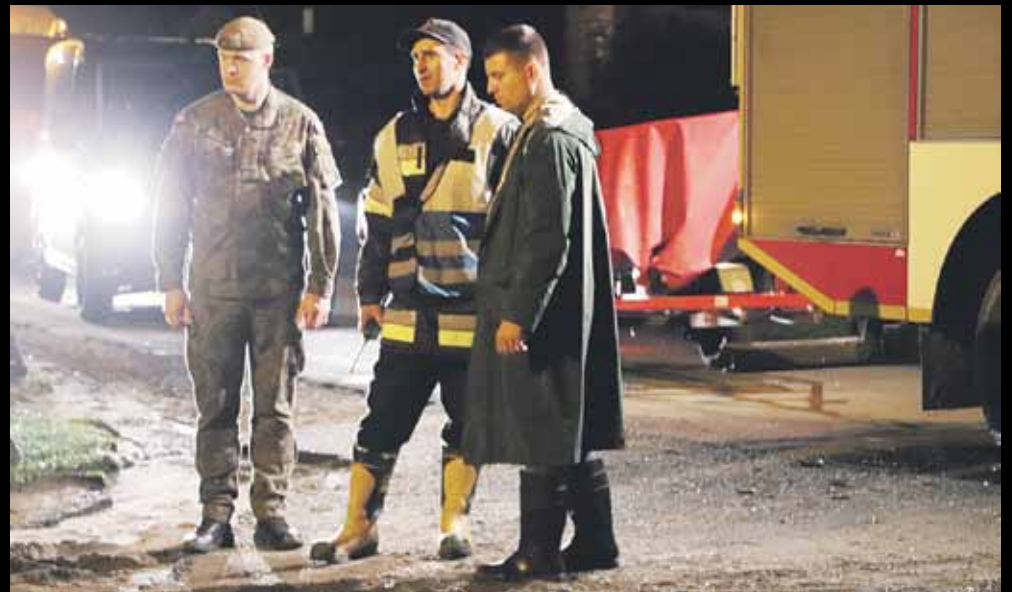
W piątek wieczorem wójt powołał Gminny Sztab Kryzysowy i osobiście włączył się w działania ratownicze i porządkowe. W akcję włączyły się Wojska Obrony Terytorialnej