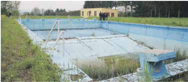
W spotkaniu z wykonawcą uczestniczyli m. in. wójt gminy oraz radni z Wysokiej

Na inwestycję gmina pozyskała środki z Europejskiego Funduszu Rozwoju Regionalnego w ramach Działania 6.5 Rewitalizacja przestrzeni regionalnej – Zintegrowane Inwestycje Terytorialne, Regionalnego Programu Operacyjnego Województwa Podkarpackiego na lata 2014-2020. Projekt jest możliwy do zrealizowania dzięki przynależności do Stowarzyszenia Rzeszowskiego Obszaru Funkcjonalnego.