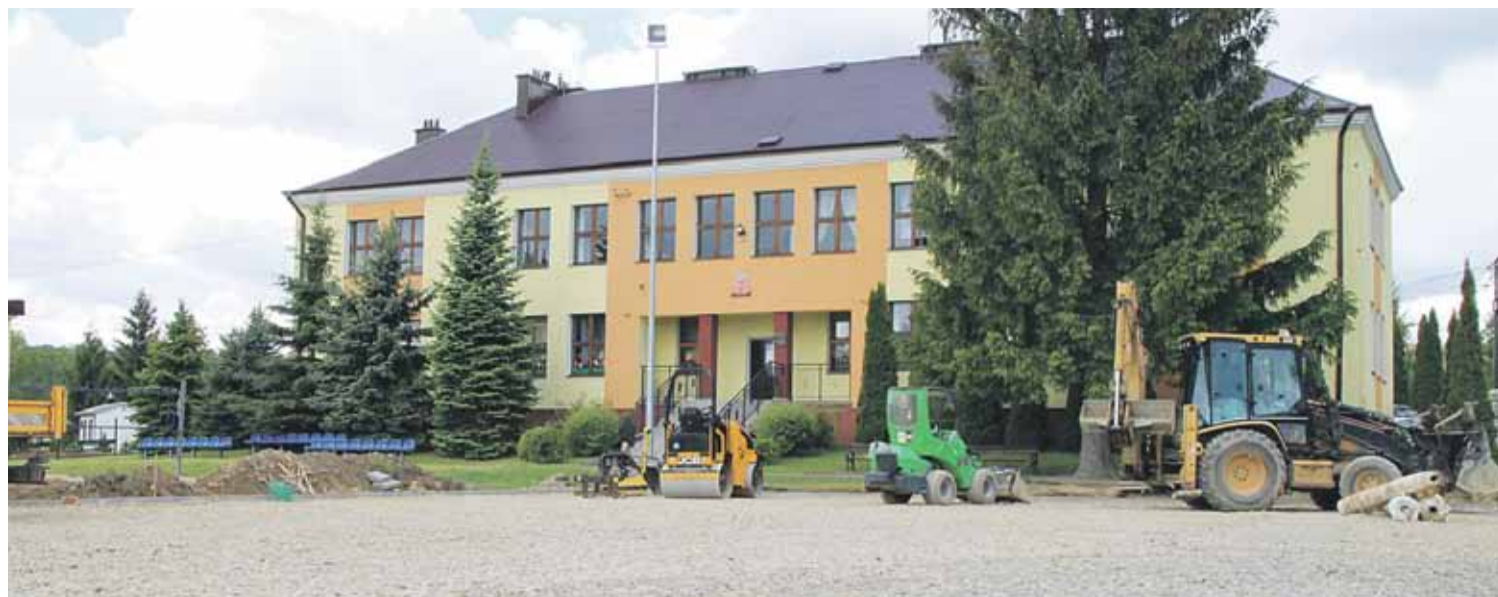
Prace w Cierpiszu. Nowoczesny obiekt ze sztuczną nawierzchnią zastąpi stary asfaltowy plac