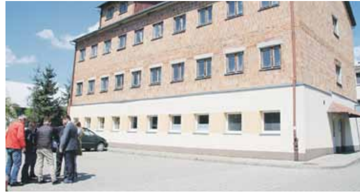
Budynek Ośrodka Zdrowia czeka na adaptację już 30 lat. Teraz powstanie tutaj Dzienny Dom Pobytu Seniorów