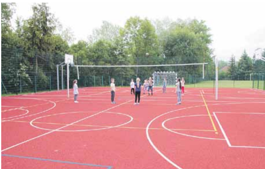
Dzieci i młodzież chętnie korzystają z boisk. Na zdjęciu boisko w Albigowej