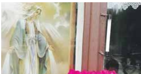
W oknach można było zobaczyć wizerunki Matki Bożej