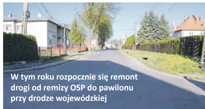
W tym roku rozpocznie się remont drogi od remizy OSP do pawilonu przy drodze wojewódzkiej