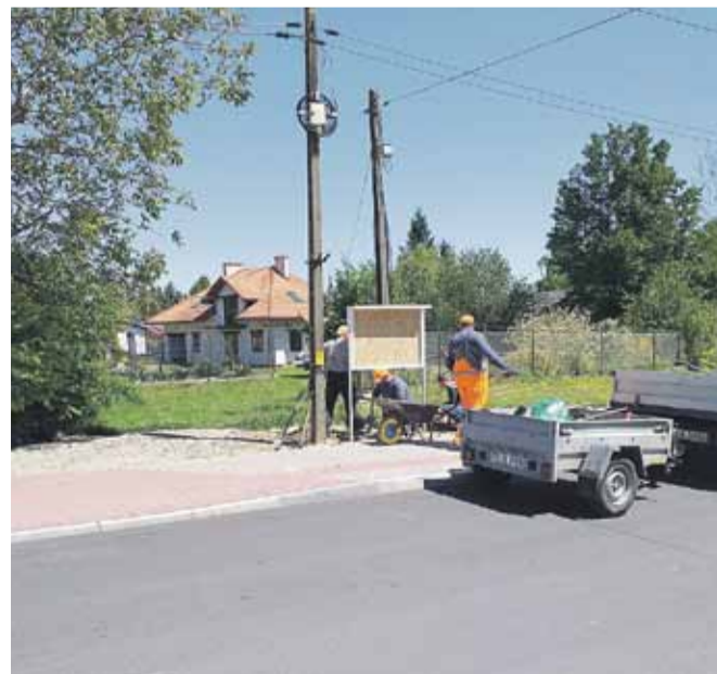
... a także przy drogach