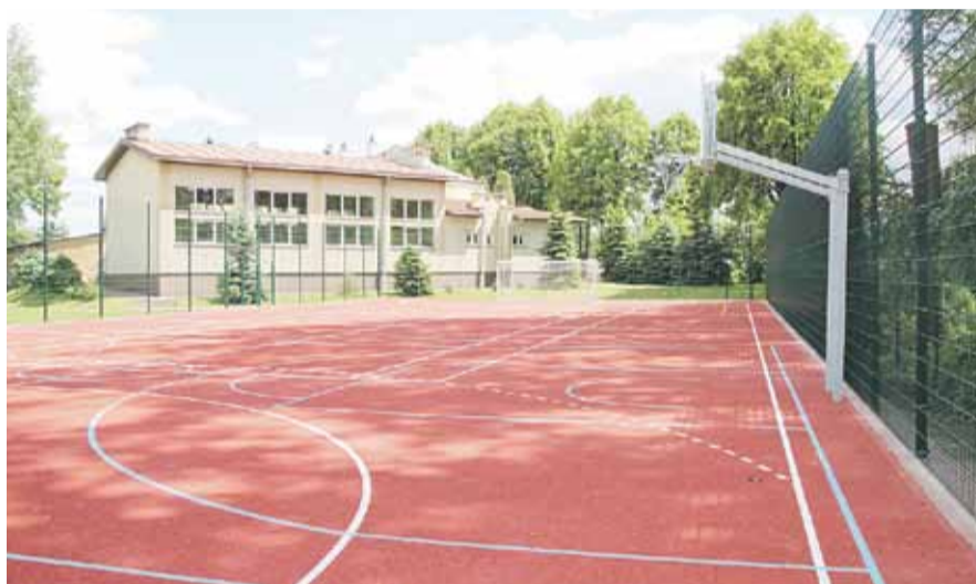
Gotowe boisko w Głuchowie