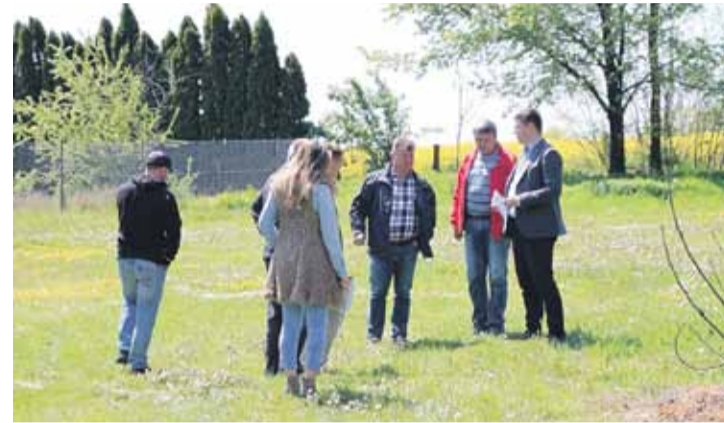
Przy podpisaniu umowy obecni byli sołtys i radni z Kosiny