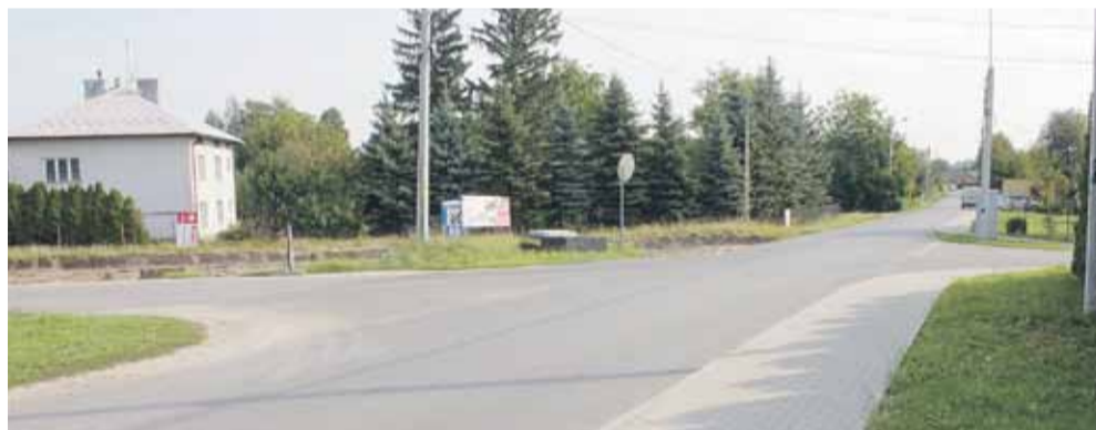
Przed przebudową