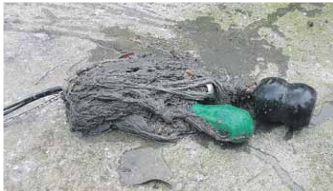
Szwarc mydło i powidło – to chyba najlepsze określenie na to, co trafia do kanalizacji sanitarnej – mówi kierownik ZGK Gminy Łañcut