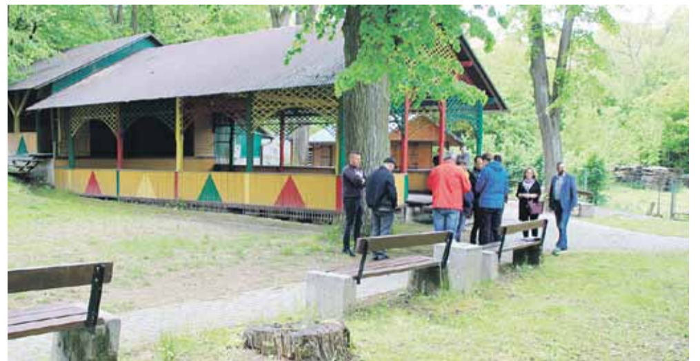
W przekazaniu placu budowy uczestniczyli przedstawiciele samorządu gminnego z Handzlówki