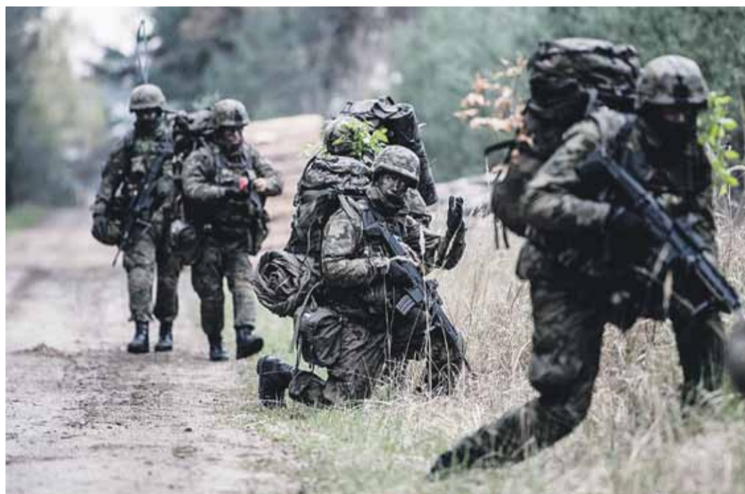
Żołnierze szkolili się na strzelnicy „Cel” oraz na terenie Rogóżna

ROGÓŻNO Wraz z odmrażaniem gospodarki oraz „luzowaniem” obostrzeń dotyczących życia społecznego, żołnierze Wojsk Obrony Terytorialnej z 31. Batalionu Lekkiej Piechoty z Rzeszowa wrócili do szkolenia.