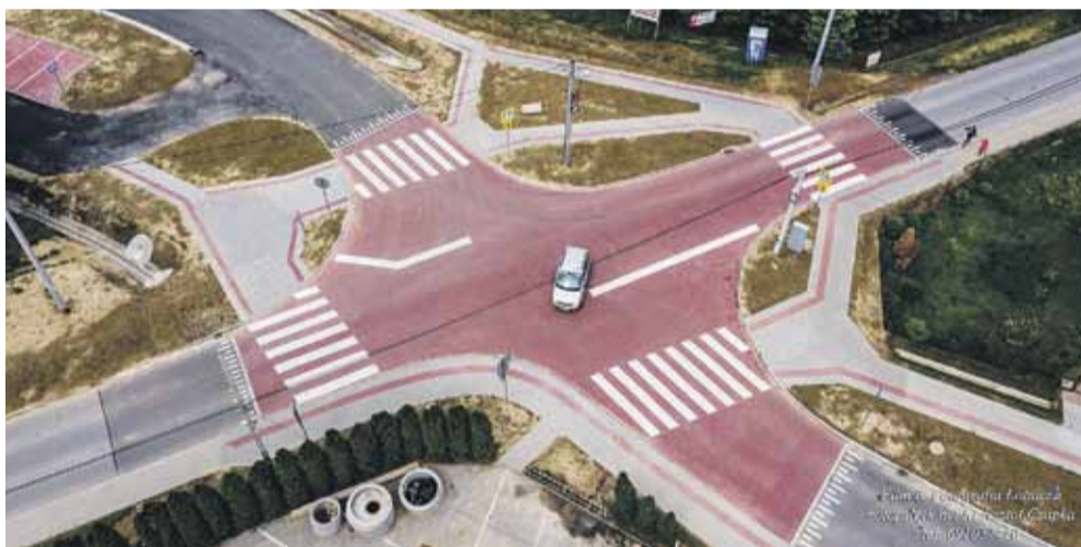
Nowe skrzyżowanie z kostki brukowej z wyniesioną powierzchnią tworzy tzw. strefę uspokojenia ruchu