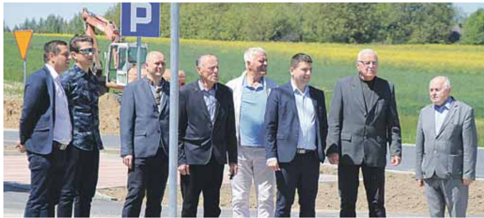
W odbiorze drogi uczestniczyli m.in. radni i sołtys Wysokiej, przedstawiciele firmy Strabag, pracownicy Urzędu Gminy Łącut