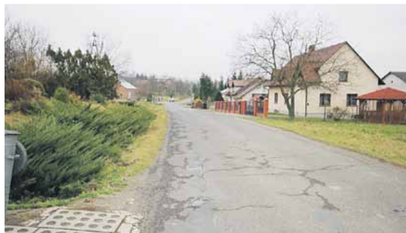
Wniosek o przyznanie pieniędzy na rozbudowę i przebudowę drogi składało Starostwo Powiatowe w Łańcucie

- Gmina na każdym etapie wspierała i będzie wspierać starostwo w realizacji tego przedsięwzięcia poprzez m.in. pomoc finansową związaną z regulacją kwestii gruntów czy zapewnienie połowy wkładu własnego do pozyskanej przez powiat dotacji z budżetu państwa – dodaje. (iw)