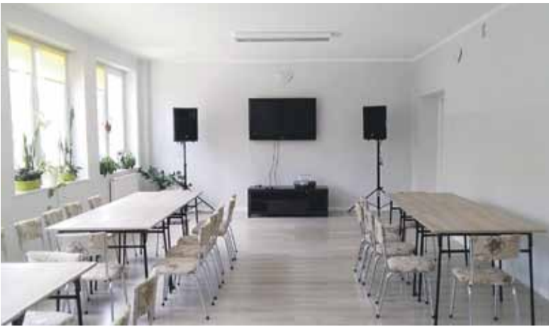
Tak wygląda odnowiona świetlica w Handzlówce