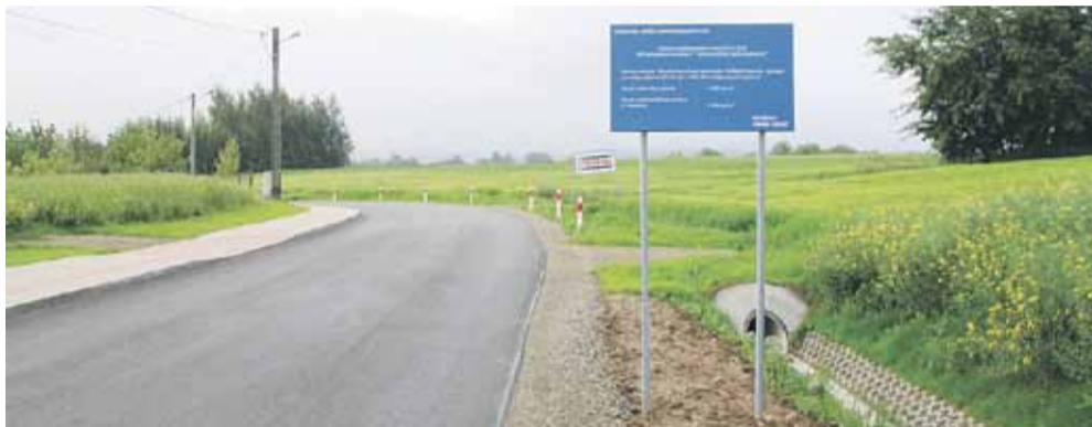
Inwestycja była realizowana od lipca 2019