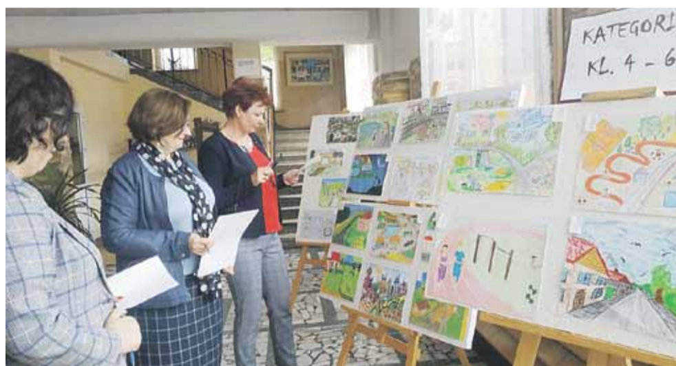
Rysunki oceniała komisja konkursowa

ność technik. Dzięki swoim zdolnościom plastycznym dzieci miały możliwość pokazania, jak wygląda wieś ich marzeń. Komisja gratuluje i dziękuje wszystkim