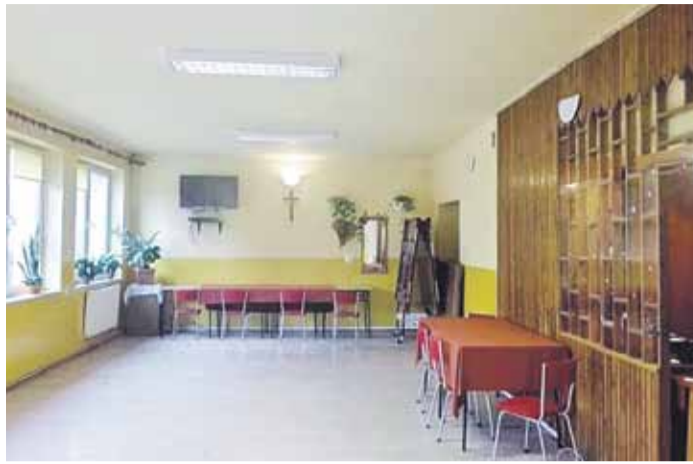
Świetlica przed remontem