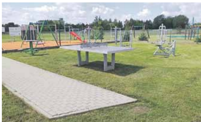
Do ZGK Gminy Łañcut należy m.in. utrzymanie czystości na placach zabaw...