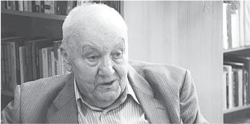
W lipcu minie rok od śmierci Alfreda Budzyńskiego

WSPOMNIENIE W obecnym tak trudnym dla ludzkości czasie Światowy Dzień Ziemi jaki przypadł na 22 kwietnia ma szczególny wymiar i budzi wiele refleksji.