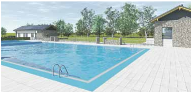
Wizualizacja basenu po rewitalizacji