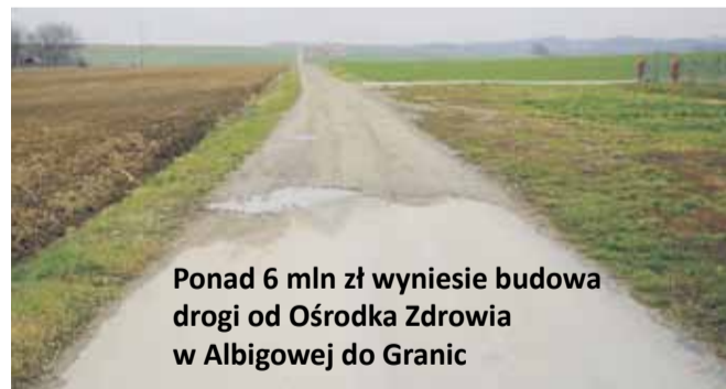
Ponad 6 mln zł wyniesie budowa drogi od Ośrodka Zdrowia w Albigowej do Granic