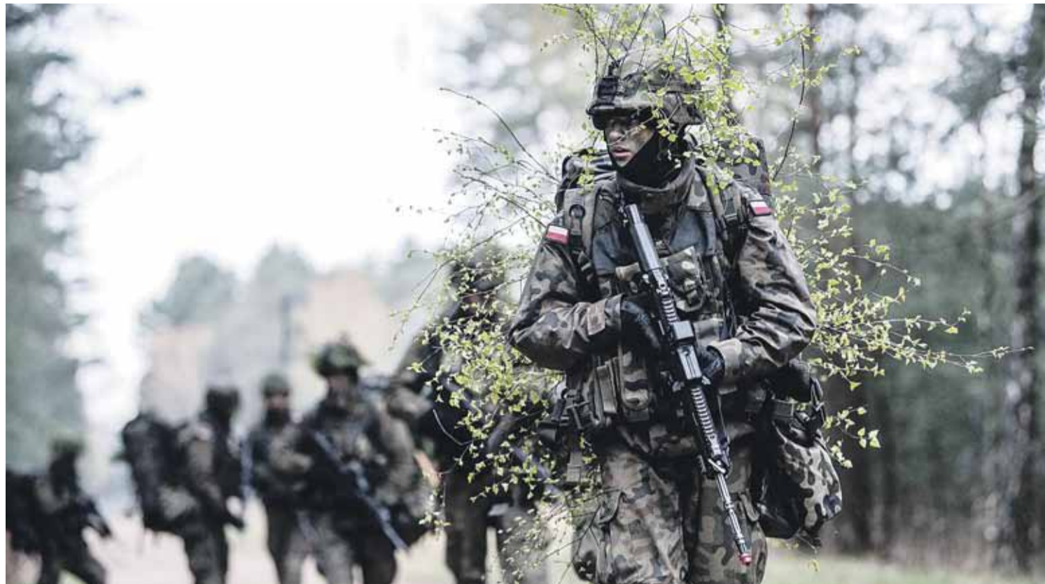
Szkolenie odbyło się 6 i 7 czerwca