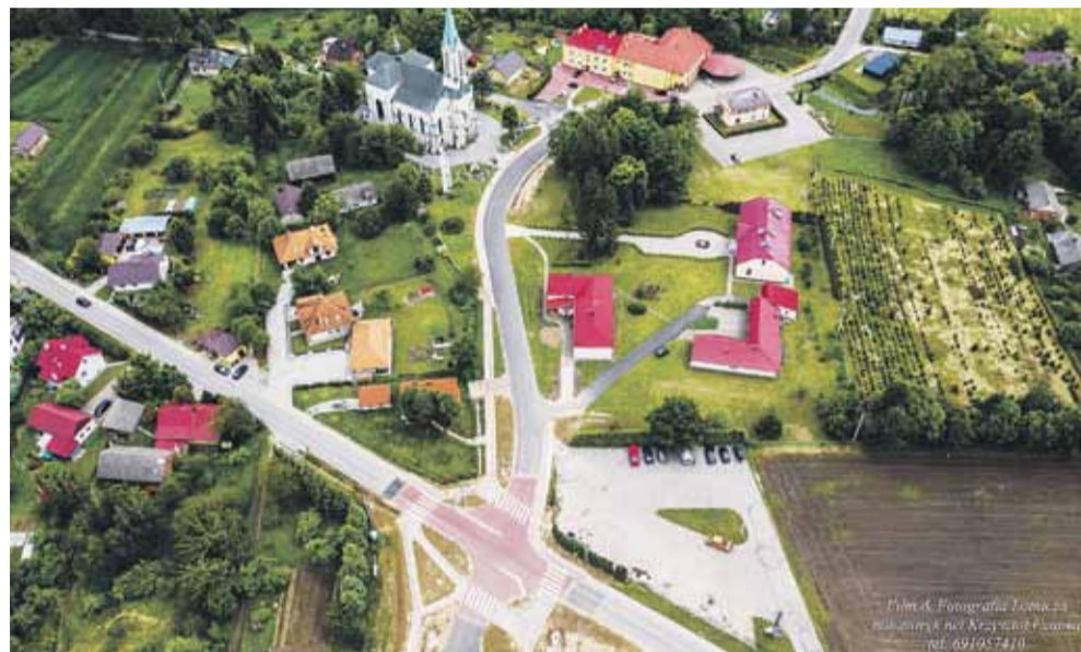
Fragment drogi z lotu ptaka