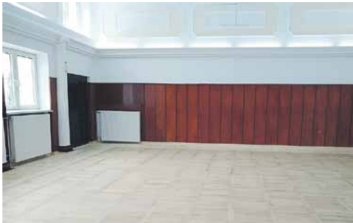
Prace w Kosinie wykonali pracownicy CKGŁ

Nie do poznania jest świetlica w Ośrodku Kultury w Handzlówce. Zakres prac w ramach funduszu sołectwa objął montaż ścianki między świetlicą a pomieszczeniem kierownika, szpachlowanie i malowanie ścian i lamperii, wykończenie szpalek drzwiowych, wymianę kratki wentylacyjnej, usunięcie metalowych zaworów po starej instalacji, CO, wymianę blatów stolikowych. Z pieniędzy Centrum Kultury Gminy Łańcut zakupiono i zamontowano drzwi wewnętrzne do biura kierownika, drzwi dwuskrzydłowe na korytarzu, zdemontowano stare panele i ułożono nowe, zamontowano drewniane listwy przypodłogowe. Gmina dołożyła do klimatyzacji, montażu podwieszanego sufitu, zakupu i montażu drzwi wewnętrznych do kuchni