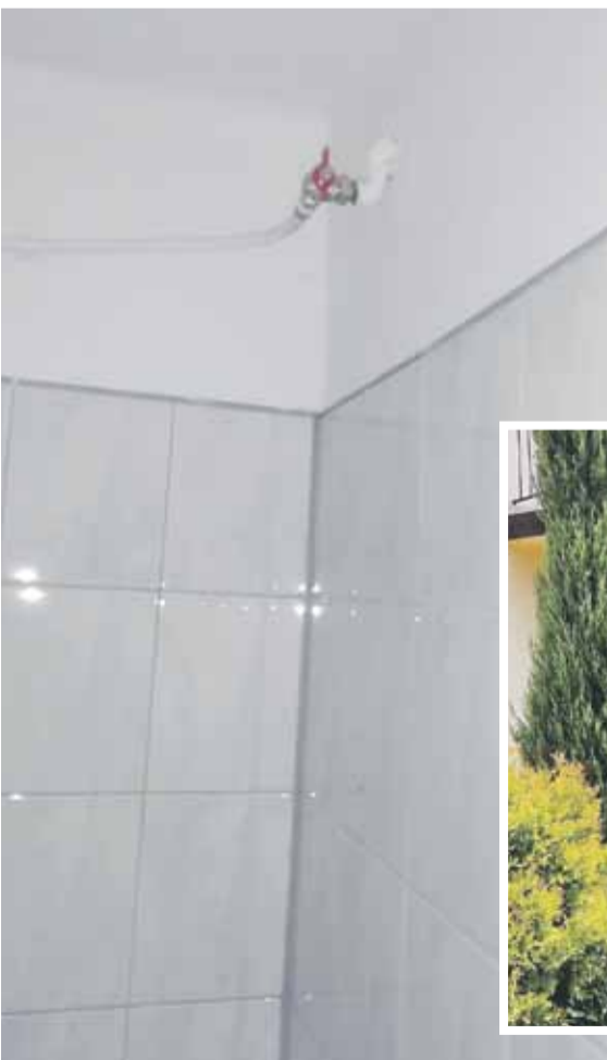
Trzeba było m.in. wymienić instalację sanitarną