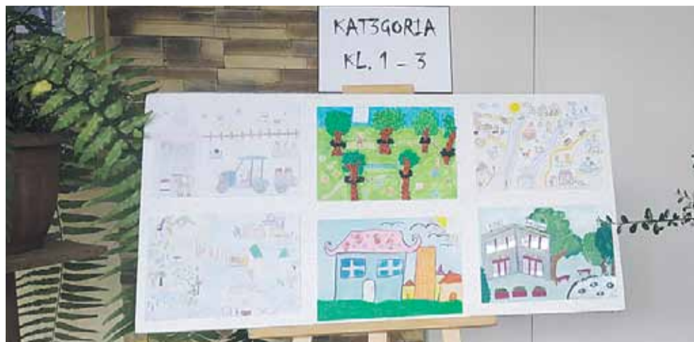
Do konkursu zgłoszono 54 prace

Komisja zauważyła duże zaangażowanie dzieci i nauczycieli w realizację zadania. Doceniła pomysły i różnorod-