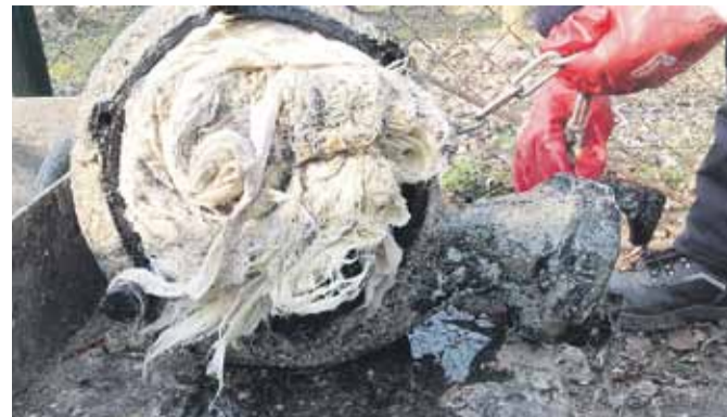
Takie materiały są znajdowane w kanalizacji i usuwane przez pracowników Zakładu Gospodarki Komunalnej ze studzienek kanalizacyjnych i przepompowni ścieków