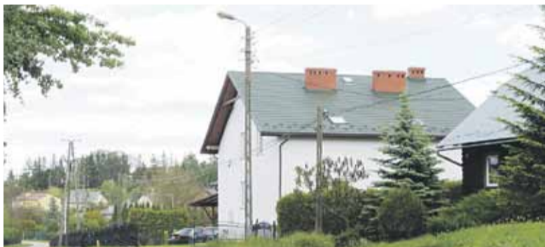
Nowe lampy zaświetlą do końca tego roku