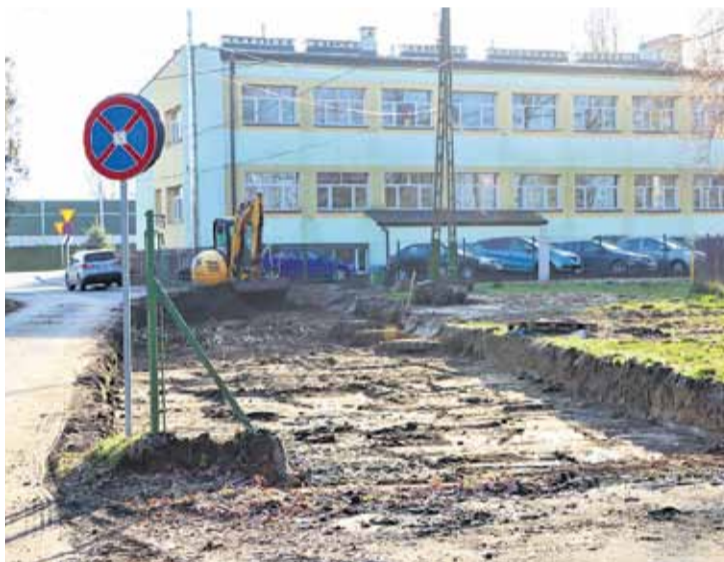
Nowy parking powstanie także w Głuchowie przy Zespole Szkół w miejscu starego placu zabaw FOT. SZYMON NOWAK, BERNADETA BRÓZ

Parking koło cmentarza w Rogóźnie oraz droga do parkingu przy cmentarzu w Kraczkowej to zadania, które Gmina Łańcut zrealizowała przed 1 listopada. Przy cmentarzu w Rogóźnie zrobiło się miejsce na ok. 20 pojazdów. W Kraczkowej oddano brakujący fragment drogi, która usprawniła ruch przy cmentarzu. Zakres prac objął korytowanie, stabilizację i wykonanie nawierzchni tłuczniowej