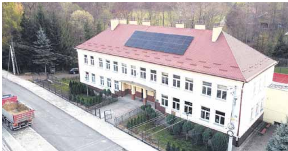
Panele na budynku szkoły w Handzlówce są jedną spośród trzynastu zaplanowanych inwestycji w fotowoltaikę, która ma być zrealizowana do końca tego roku lub początkiem 2023 roku

Do końca roku gmina Łańcut chce wymienić także wszystkie uliczne lampy na ledowe. Do tej pory wymieniono 2100 takich lamp. - Podpisaliśmy umowę na dostawę 190 lamp LED na drogi gminy Łańcut. To oznacza, że najpóźniej