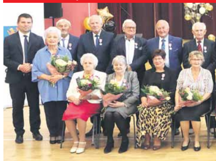
UROCZYSTOŚĆ WRĘCZENIA MEDALI – SONINA 20.10.2022