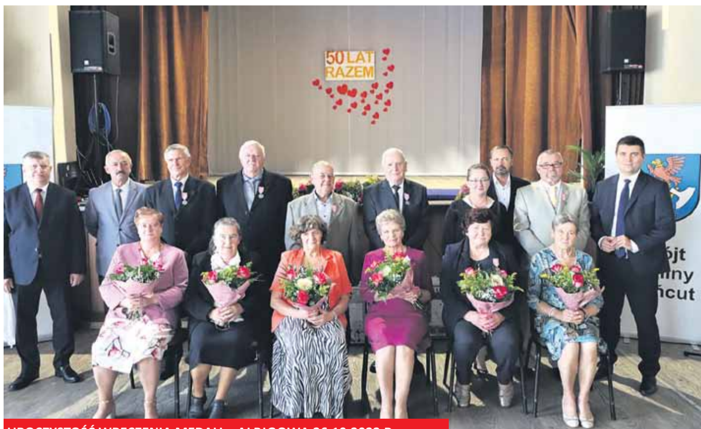
UROCZYSTOŚĆ WRĘCZENIA MEDALI – ALBIGOWA 26.10.2022 R.