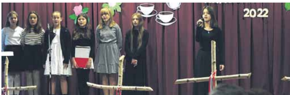
Dzieci i młodzież przedstawili program artystyczny ph. „Przodkom winniśmy Pamięć a Ojczyźnie miłość”