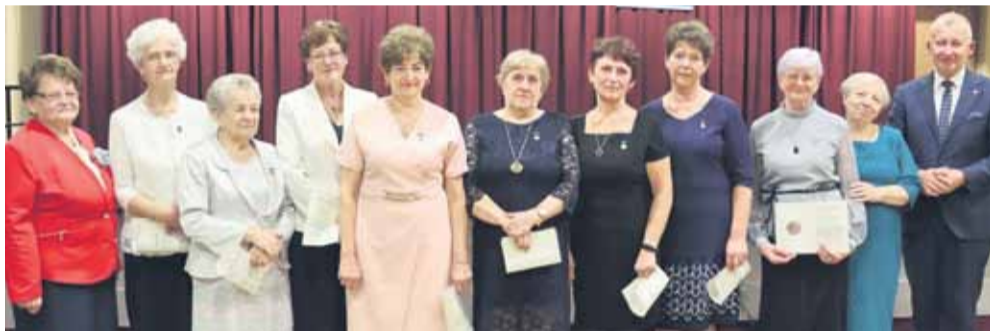
Wydarzenie było okazją do przedstawienia zarysu historycznego Jubilatów, a także do wręczenia odznaczeń i dyplomów zasłużonym członkom FOT. KINGA BALAWEJDER