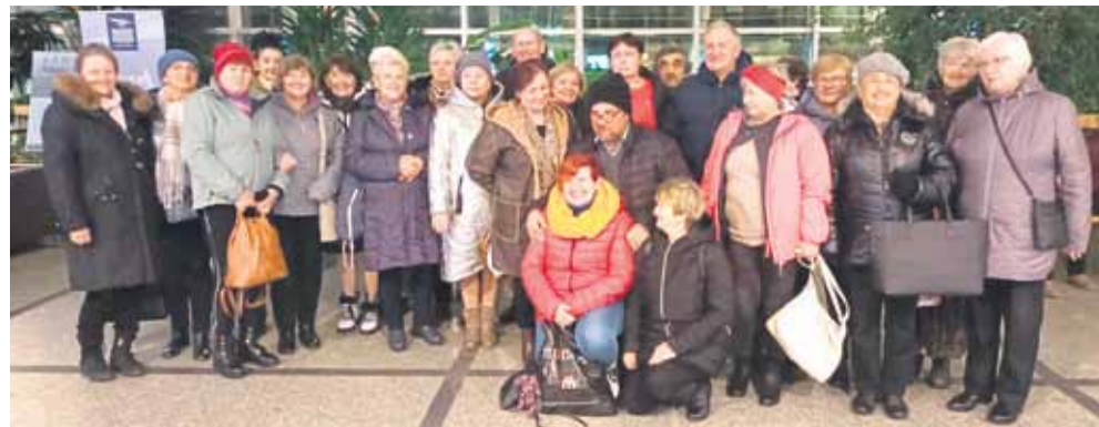
Seniorzy w Krynicy Zdroju