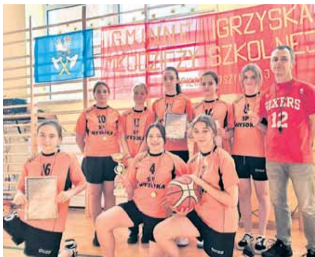
Zwycięski zespół będzie reprezentował Gminę Łańcut na turnieju powiatowym, który odbędzie się w hali sportowej Zespołu Szkół Technicznych w Łańcutcie