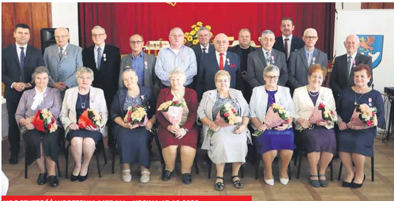
UROCZYSTOŚĆ WRĘCZENIA MEDALI – KOSINA 17.10.2022 r.