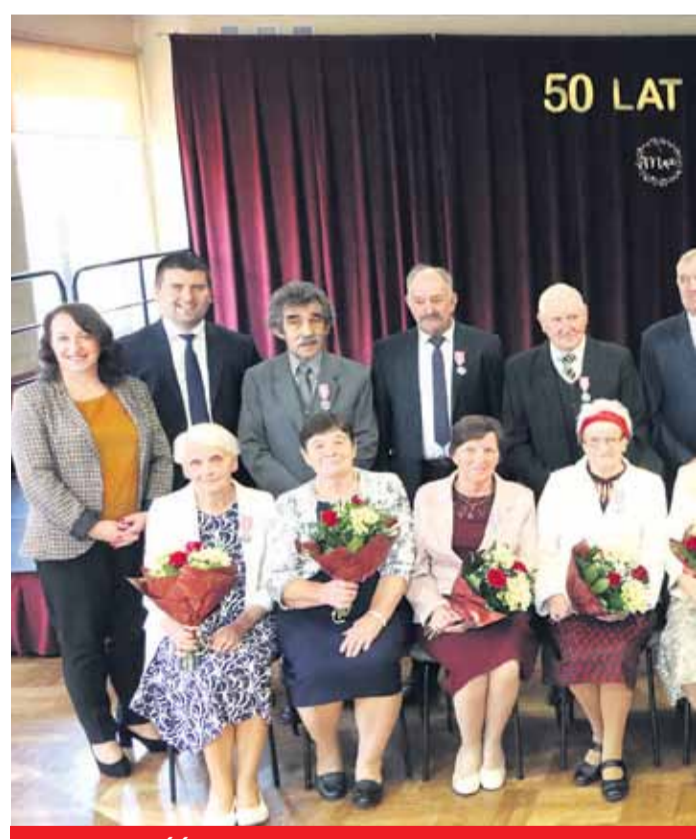
UROCZYSTOŚĆ WRĘCZENIA MEDALI – KRACZKOWA 27.10.2022