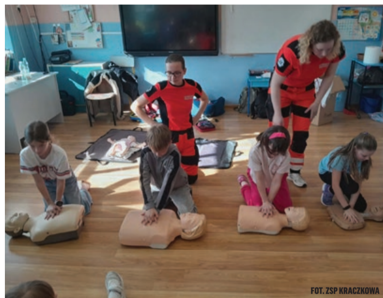
FOT. ZSP KRACZKOWA