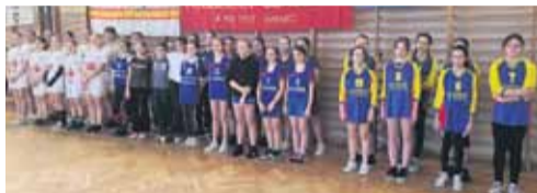
W zawodach wystartowały cztery szkoły podstawowe (Albigowa, Głuchów, Kosina, Sonina)

Zwycięstwem siatkarek SP Albigowa zakończył się, rozgrywany 18.02.2023 r., turniej mini piłki siatkowej dziewcząt w sali sportowej Zespołu Szkół w Głuchowie. W imprezie zorganizowanej przez Gminny Szkolny Związek Sportowy w Łańcutie wystartowały 4 szkoły podstawowe Gminy Łańcut (SP Albigowa, SP Głuchów, SP Kosina, SP Sonina).