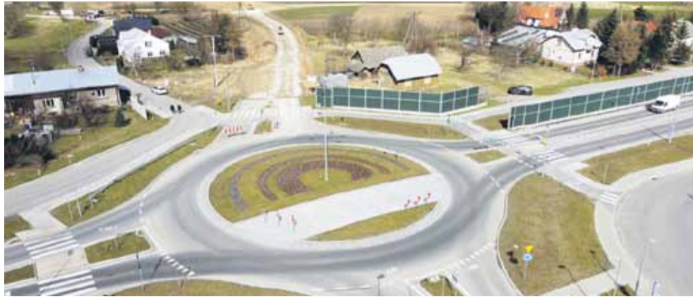
Początek budowanej drogi to istniejące rondo w Woli Dalszej, które powstało w ramach budowy autostrady A4. Koniec obwodnicy zaplanowano na istniejącym rondzie w Głuchowie

Zakres inwestycji przewiduje m.in.: budowę DW nr 877 na odcinku od węzła autostrady A4 do połączenia z DK nr 94, przebudowę/rozbudowę dróg publicznych w strefie skrzyżowań (w tym dwóch rond): DP nr 1521R (Wola Dalsza), droga dojazdowa do oczyszczalni ścieków (Wola Dalsza), DG nr 109606R (ul. Wła-