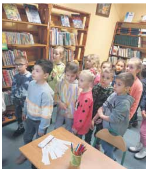
Zajęcia z przedszkolakami w bibliotece w Albigowej i Soninie

21 marca bibliotekę odwiedziły przedszkolaki z grupy Wiewiórki. Dzieci wkroczyły w magiczny świat bajkowych bohaterów. Za pomocą różdżki i słów hokus-pokus wskazywały wybraną przez siebie planszę. Po jej odwróceniu każda dziewczynka i chłopiec podawali imię bohatera lub tytuł bajki. Zajęcia udowodniły, że najmłodszy lubią i znają wiele bajkowych postaci. Kolej-