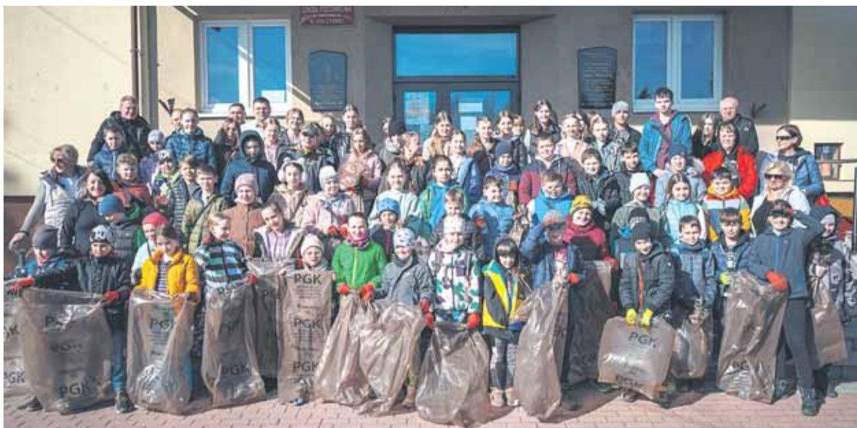
Chętnych do sprzątnięcia nie brakowało