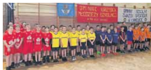
W imprezie zorganizowanej przez Gminny Szkolny Związek Sportowy w Łańcutie wystartowało 5 szkół podstawowych Gminy Łańcut (SP Albigowa, SP Cierpisz, SP Głuchów, SP Sonina, SP Wysoka)

Sukcesem drużyny SP Albigowa zakończył się, rozgrywany 25.02.2023 r., turniej mini piłki siatkowej chłopców w hali sportowej Zespołu Szkół w Głuchowie.