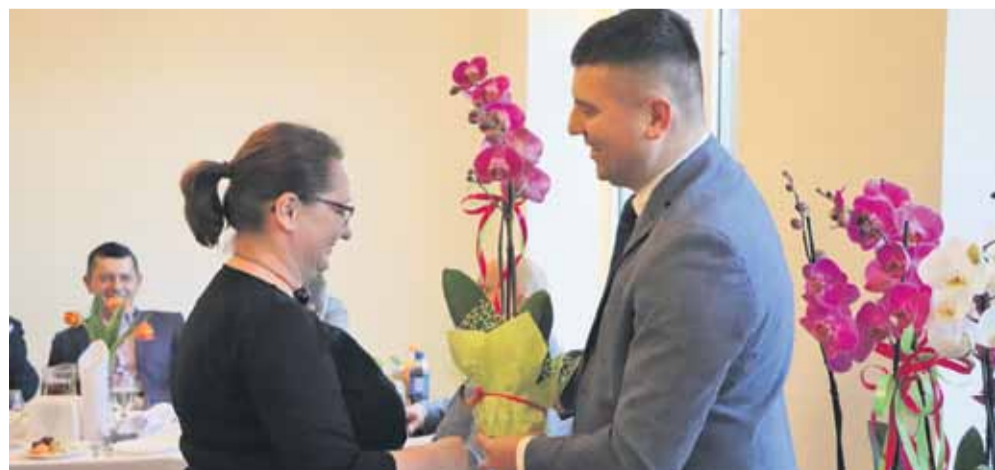
Nie zapomniano także o Dniu Kobiet