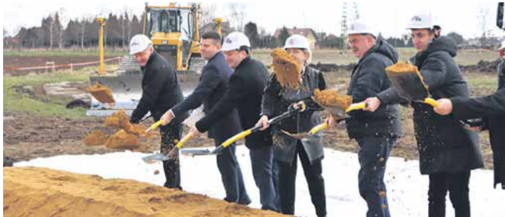
Udział w wydarzeniu wzięli samorządowcy województwa podkarpackiego, powiatu łańcuckiego, miasta Łącuta, gminy Łącut, gminy Białobrzegi, przedstawiciele wykonawcy inwestycji – firmy ANTEX II oraz Podkarpackiego Zarządu Dróg Wojewódzkich