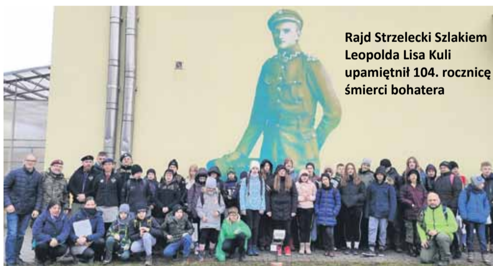
Rajd Strzelecki Szlakiem Leopolda Lisa Kuli upamiętnić 104. rocznicę śmierci bohatera

nią grupą, która odwiedziła bibliotekę były dzieci z grupy Misie. Przedszkolaki również uczestniczyły w bajkowych zajęciach wykorzystując się znajomością książkowych bohaterów. 22 marca na zajęcia do biblioteki przyszły sześciolatki. Było to kolejne spotkanie pod hasłem „Czy znasz te bajki?”. Dzieci z grupy oB poradziły sobie znakomicie z odgadywaniem bajkowych bohaterów. Poźniej biblioteka gościła też sześciolatki z grupy oA.