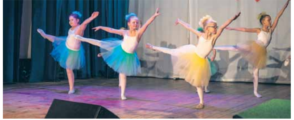
Na scenie m.in. zaprezentowały się dzieci z grupy baletowej, działającej przy ośrodku