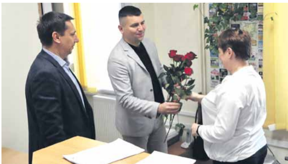
Dzień kobiet w urzędzie FOT. SZYMON NOWAK, BERNADETA BRÓZ, CKGŁ