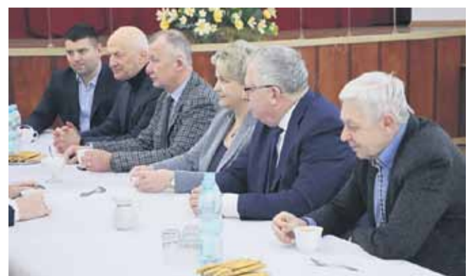
Spotkanie w Kosinie było poświęcone planom realizacji wymienionych inwestycji, współpracy pomiędzy samorządami oraz możliwościom pozyskania kolejnych środków na przedsięwzięcia drogowe