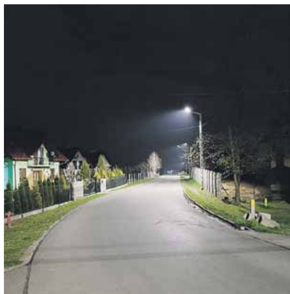
Od 23 kwietnia takie oświetlenie znajduje się przy drogach Działy Wschodnie w Kraczkowej, Zablesze w Głuchowie oraz Ciemna w Albigowej