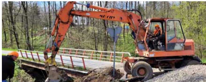
Remont mostu przy drodze Chyrów w Handzlówce