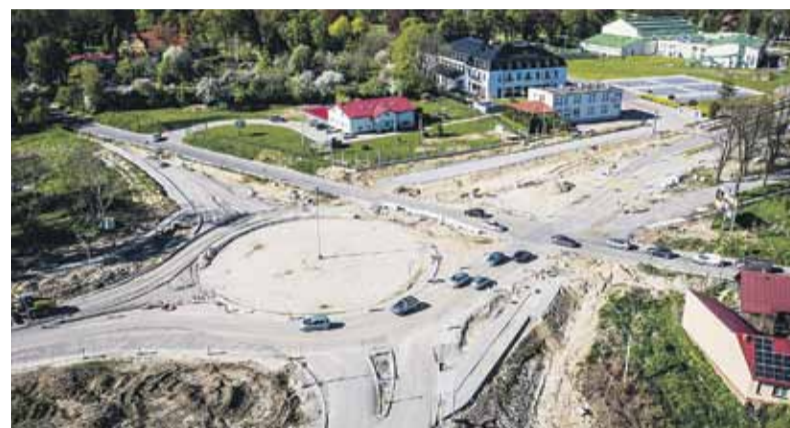
Rondo w pobliżu Hotelu Łańcut