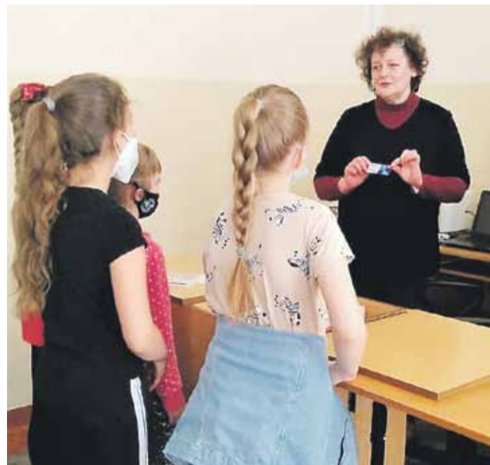
Spotkania zaowocowały nie tylko poszerzeniem wiedzy uczniów, ale także zapisami nowych czytelników.