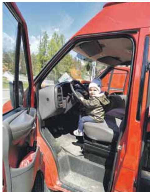
Na paradach strażackich w Kosinie i Kraczkowej