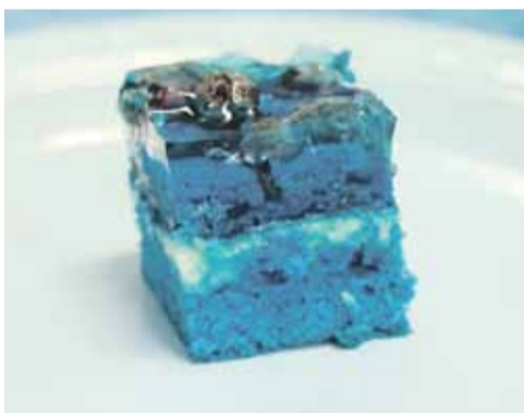
Niebieskie było nawet jedzenie

Niezapominajka nazywana również „niezabudką” traktowana jest jako symbol pamięci. Wręczając komuś ten kwiat mówimy: „Nie zapomnij o mnie”. Ale bukietik niezapominajki może być również zaproszeniem do wspólnego spędzenia czasu