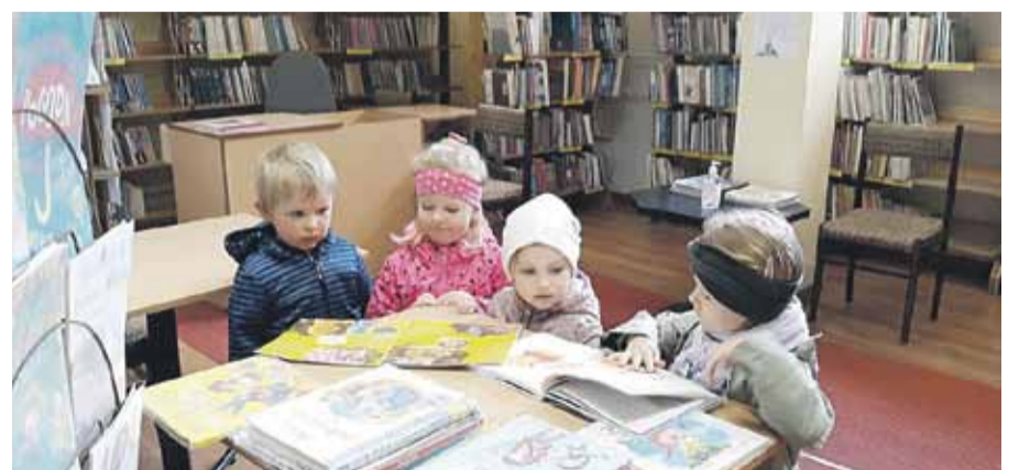
Zajęć z okazji Tygodnia Bibliotek nie zabrakło również w Publicznej Bibliotece w Wysokiej. Do biblioteki zostały zaproszone dzieci z tutejszego przedszkola - grupa najmłodszych i zerówka. Dzieci rozmawiały o tym, jakim miejscem jest biblioteka, jakie panują w niej zasady. Bibliotekarka podkreślała, że warto się z nią zaprzyjaźnić. Nie zabrakło również rozmów o książkach.