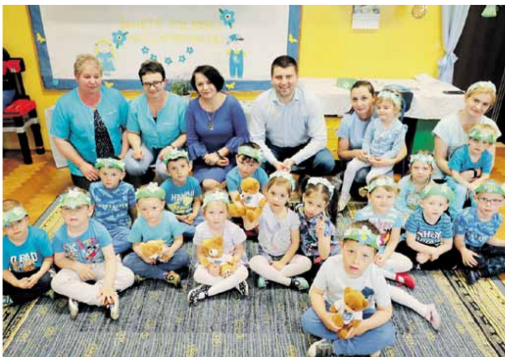
Wszystko w tym dniu było na niebiesko