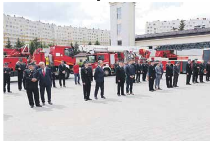
Uroczystość odbyła się na placu Komendy Wojewódzkiej Państwowej Straży Pożarnej w Rzeszowie