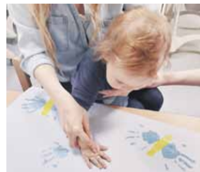
Akcja „Jesteśmy z Wami niebieskimi motylami”