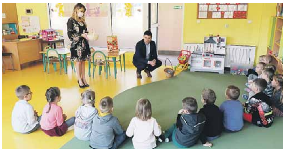
Powrót do nauki stacjonarnej klas I-III oraz dzieci do przedszkoli był ogromną radością