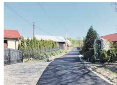
Droga „Budy” w Kraczkowej wyremontowana