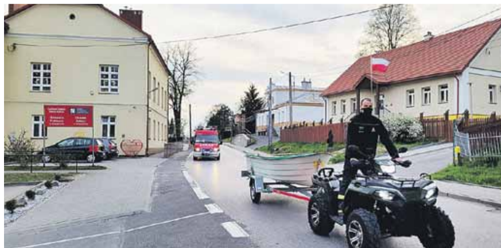
Na paradzie strażackiej w Kraczkowej

Na polskie sztandary strażackie Święty trafił w czasach zaborów. Odtąd strażaków nazywa się rycerzami Św. Floriana albo Florianami. W ikonografii św. Florian przedstawiany jest najczęściej w stroju rzymskiego oficera, z naczyniem z wodą do gaszenia ognia, lub wprost gaszącego. (iw)