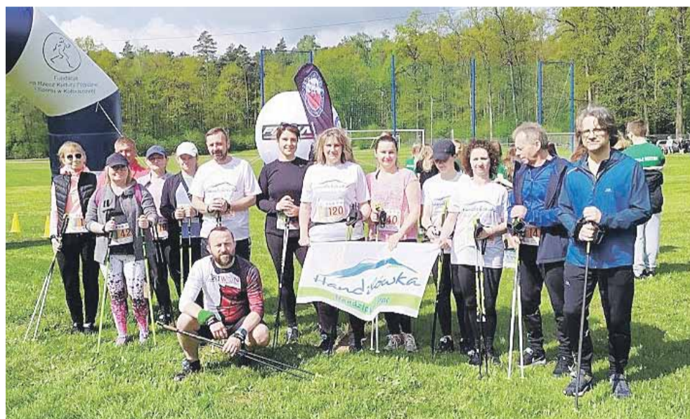
„Handzłowska Brać” to grupa utworzona w Handzłówce, skupiająca miłośników chodzenia z kijami z całej okolicy

Jak jednak wypadła nasza „Handzłowska Brać”? Pomimo tego, że byliśmy jedną z najmłodszych sztaftek ekip na zawodach, to okazało się że jesteśmy trzecią najliczniejszą grupą. Indywidualnie zawodnicy startowali w podziale na kategorie wiekowe i w końcowym rozrachunku nasz występ okazał się być sporą niespodzianką.