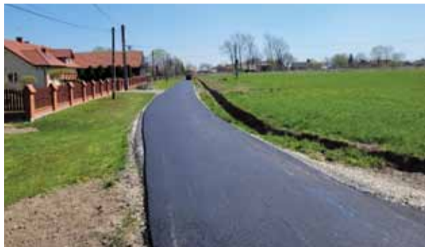
Wyremontowana droga w Głuchowie