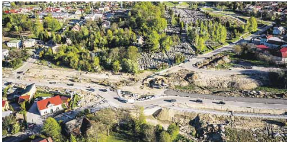
Rondo w kierunku Wysokiej i Albigowej