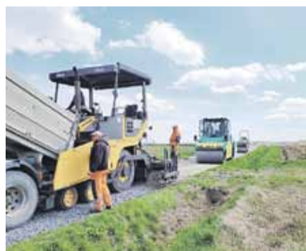
Remonty na drodze „Gościńczyk” w Handzlówce