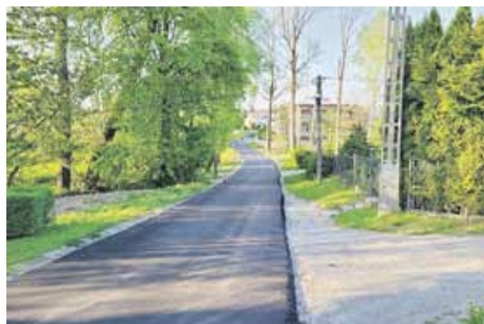
Tak wygląda droga „Przez Wieś” w Albigowej na odcinku od mostu do Ośrodka Zdrowia. Jej stan wymagał kapitalnego remontu