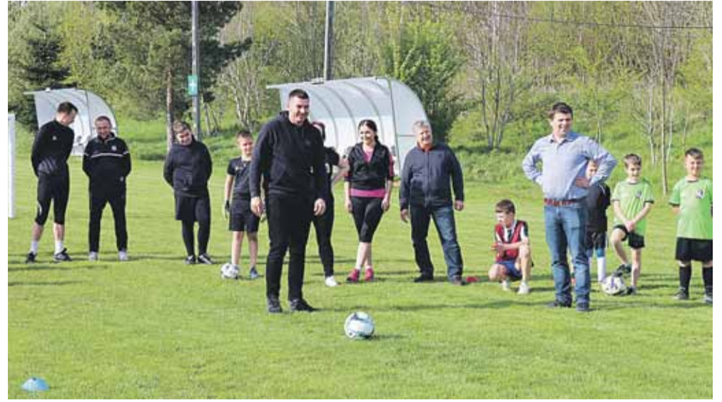
Udział w mini turnieju wzięły dziecięce drużyny Czarnych Kraczkowa, a także samorządowcy i działacze sportowi

(Albigowa – ponad 43 tys. zł, Kraczkowa – ponad 43 tys. zł, Sonina – prawie 34 tys. zł). Zakończenie zadania planowane jest na wrzesień 2021 r.