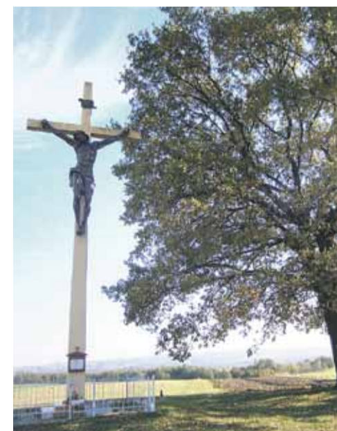
Krzyż Solidarności na Kraczkowskich Błoniach

czyk przebiegający przez Zabratówkę. To pomoże w staraniach gminy Łańcut pozyskać dofinansowanie na kompleksową przebudowę drogi Gościńczyk tj. od skrzyżowania z drogą wojewódzką do drogi powiatowej w rejonie Handzlówka Góra – zaznacza wójt.