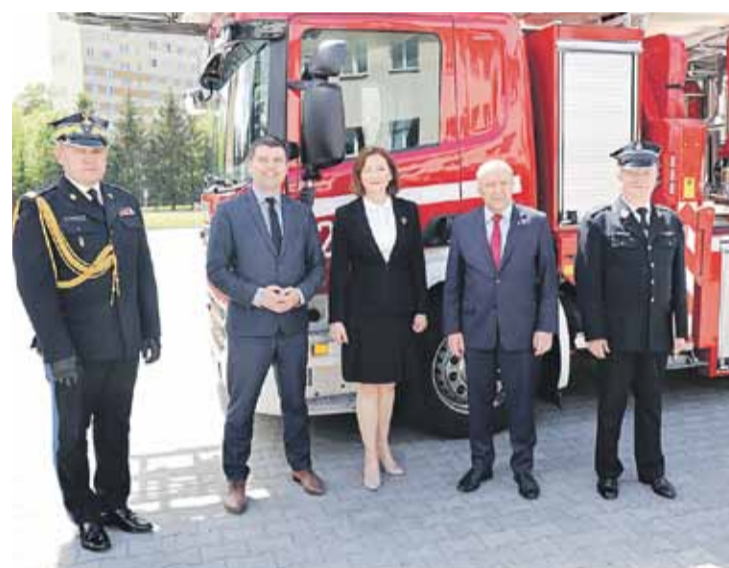
Promesy otrzymało łącznie 19 jednostek Ochotniczych Straży Pożarnych z naszego regionu