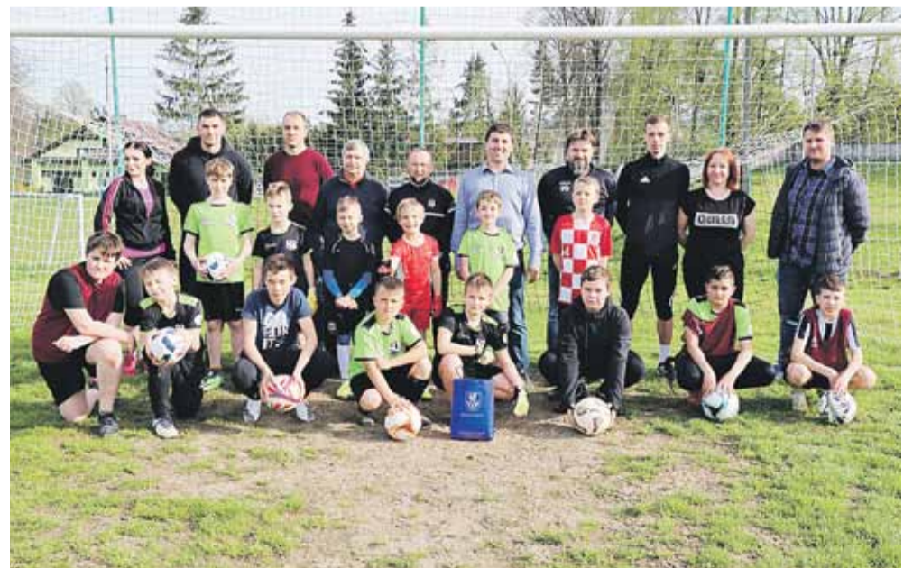
Na koniec imprezy wspólne zdjęcie