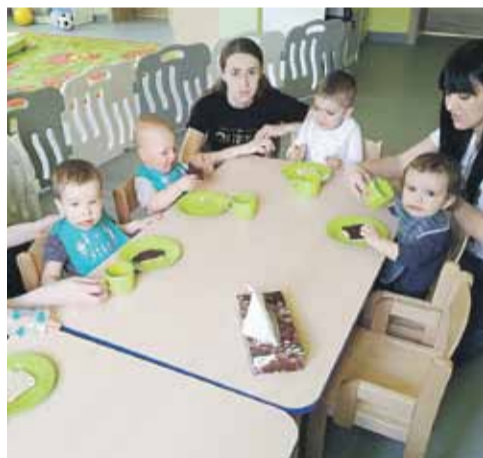
Pora na posiłek