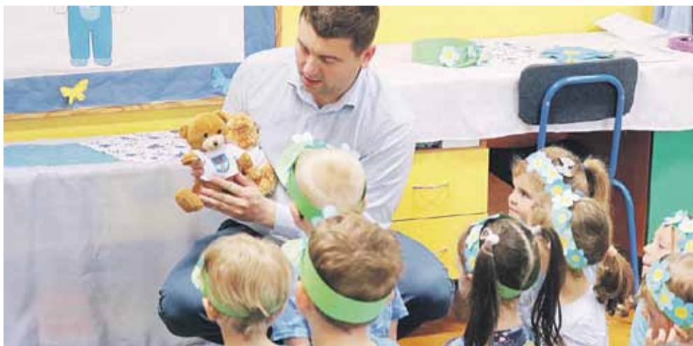
Misiek z herbem przydał się do opowiedzenia dzieciom o gminie Łańcut