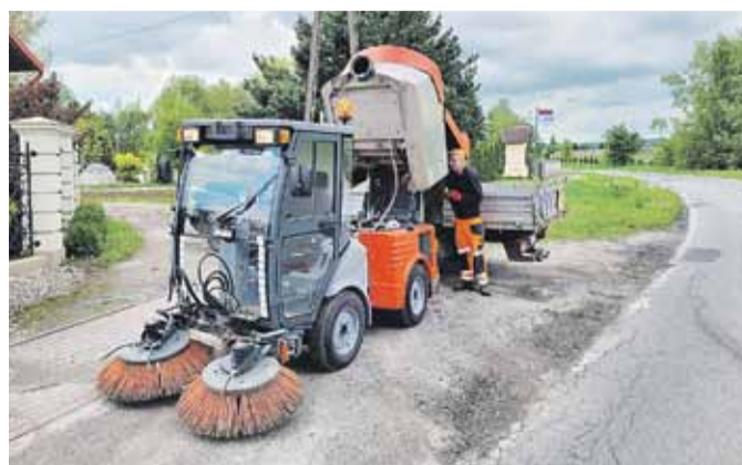
Zamiatarka już pracuje „w terenie”