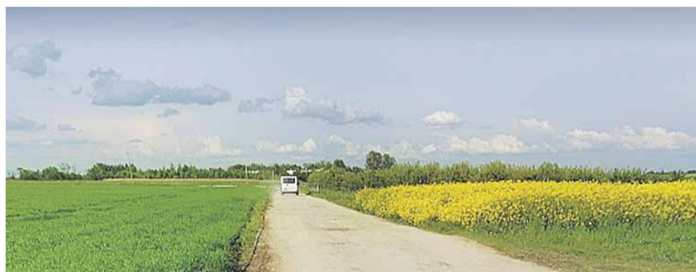
Jeszcze w tym roku na odcinku tej drogi pojawi się asfalt

- Inwestycję zamierzamy zrealizować jeszcze w tym roku. Kończymy prace nad dokumentacją projektową, środki w budżecie na ten cel są już zabezpieczone. Mieszkańcy Kraczkowej od lat mówili o potrzebie utwardzenia tej drogi asfaltem, było to jednak bardzo trudne ze względu na kwestie własnościowe. Porozumienie