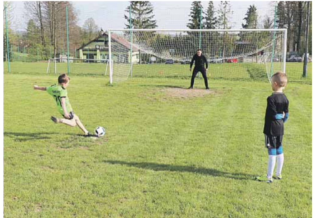
Młodzi piłkarze mieli okazję zmierzyć się m.in. z bramkarzem Sawy Soniny