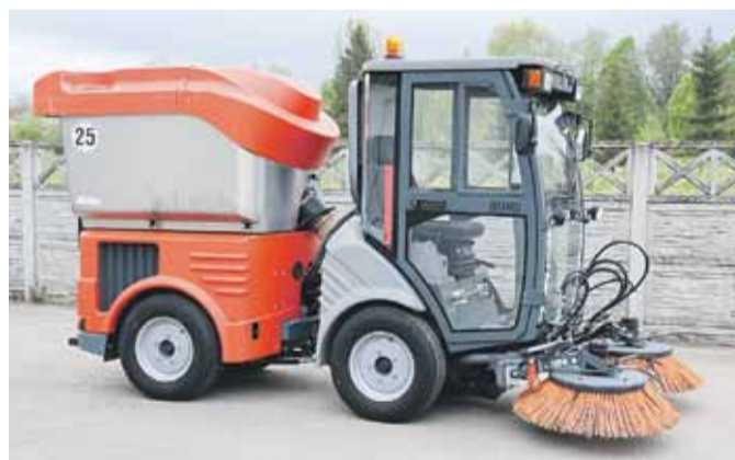
Nowy sprzęt – Hako Citymaster 1200