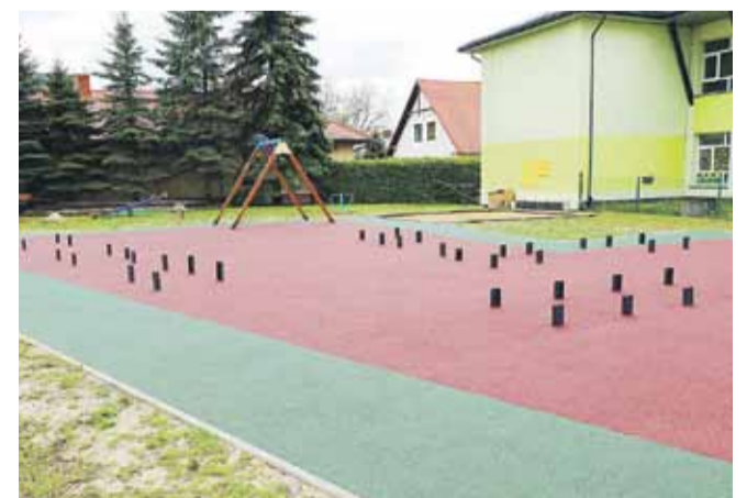
Nowa nawierzchnia na placu zabaw przy Zespole Szkół w Rogóźnie

- Naturalnie musimy też zadbać o bezpieczeństwo tych miejsc oraz stan techniczny czy estetykę. Dlatego prowadzimy działania związane z modernizacją monitoringu, systematyczną wymianą zużytych elementów czy doposażeniem – dodaje.