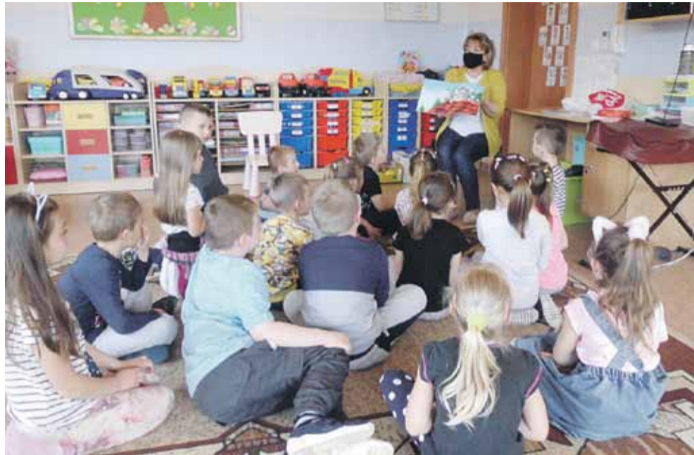
Podczas zajęć w obu miejscowościach wspólnie spędzone chwile upłynęły miło i przyjemnie.

13 maja przedszkolaki z grup „Smerfy” i „Florianki” z Publicznego Przedszkola w Soninie miały spotkanie z bibliotekarką. Celem spotkania było rozbudzenie zainteresowania literaturą dziecięcą, pobudzenie wyobraźni dzieci i zachęcenie do czytania poprzez omówienie „10 sposobów na dobry początek przygody z czytaniem”. Bibliotekarka czytała na głos książkę Doroty Kozioł, której bohaterem był zabawny kotek. Dzieci słuchały tekstu z zaciekawieniem, chętnie pytając o szczegóły. Było wesoło i zabawnie. Na pamiątkę wizyty dziewczynki i chłopcy otrzymali kolorowe zakładki do książek. Dziękując za spotkanie przedszkolaki recytowały dla bibliotekarki wiersz oraz wręczyły słodki upominek. 17 maja odbyły się kolejne spotkania. Tym razem bibliotekarka gościła u „Kubusiów” i „Krasnali”. Opowiedziała im