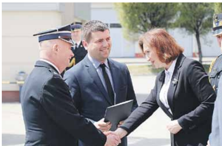
Promesy prezesa straży poszczególnych jednostek razem z samorządowcami odebrali z rąk wojewody Ewy Leniart