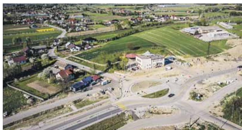
Rondo przy Ośrodku Kultury w Głuchowie