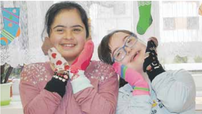
Ten szczególny czas uczciliśmy w szczególny sposób: Pamiętajmy, że Przyjaciele nie liczą chromosomów, lecz po prostu są!