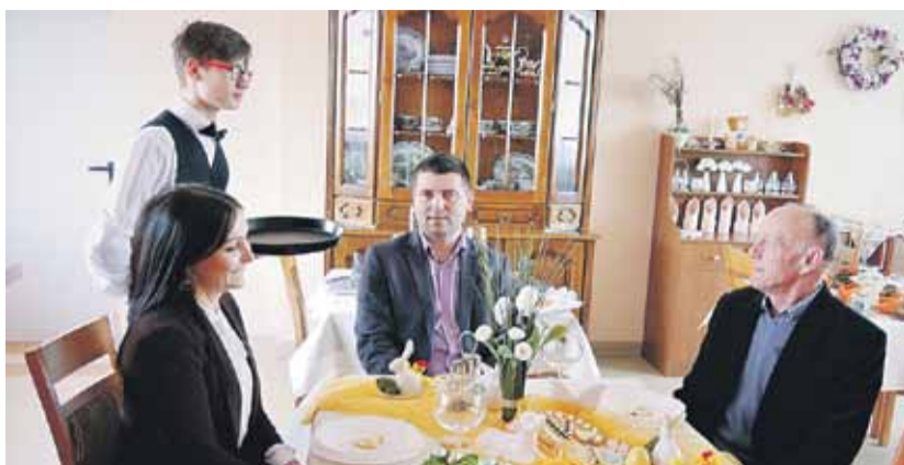
Uczniów podczas warsztatów odwiedzili nasi samorządowcy