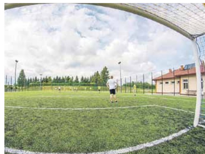
„Orlik” przy Zespole Szkół im. Tadeusza Kościuszki w Wysokiej. Boisko przystosowane do gry w koszykówkę, siatkówkę, tenisa ziemnego. Obok znajduje się boisko do piłki nożnej, boisko do siatkówki plażowej oraz stadion