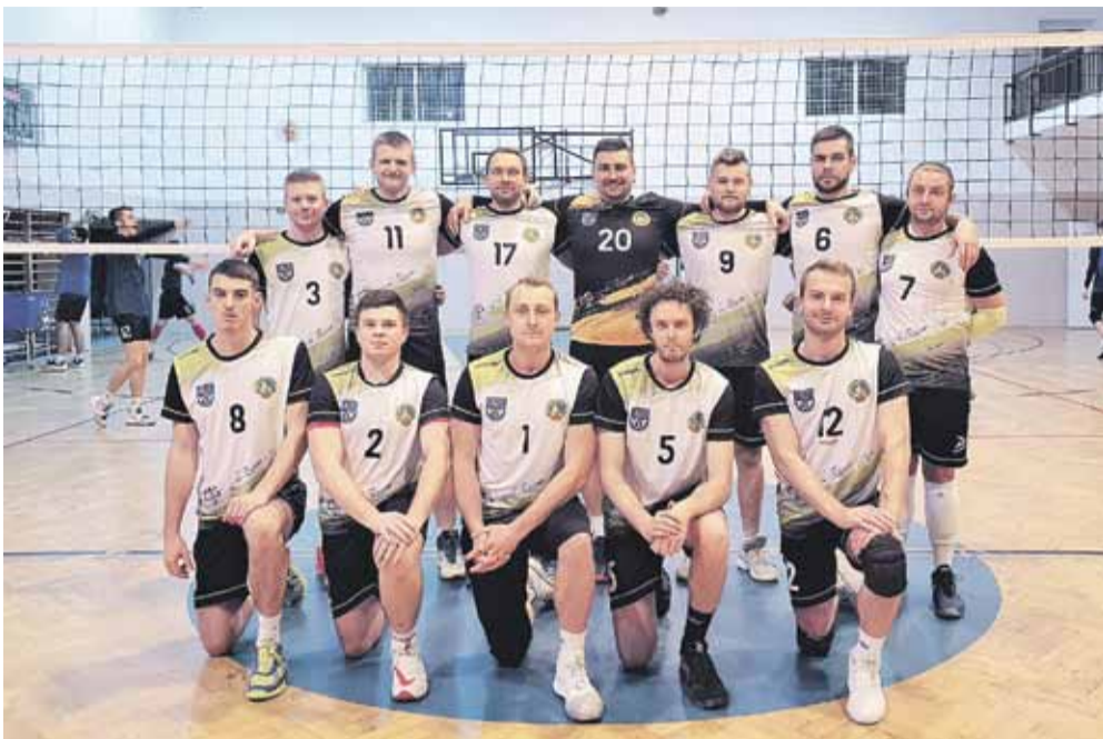
Skład drużyny w sezonie 2020/2021 został nieco przebudowany

GMINA ŁAŃCUT SST Sportur Gmina Łańcut zakończył ligowe zmagania na 2 miejscu.