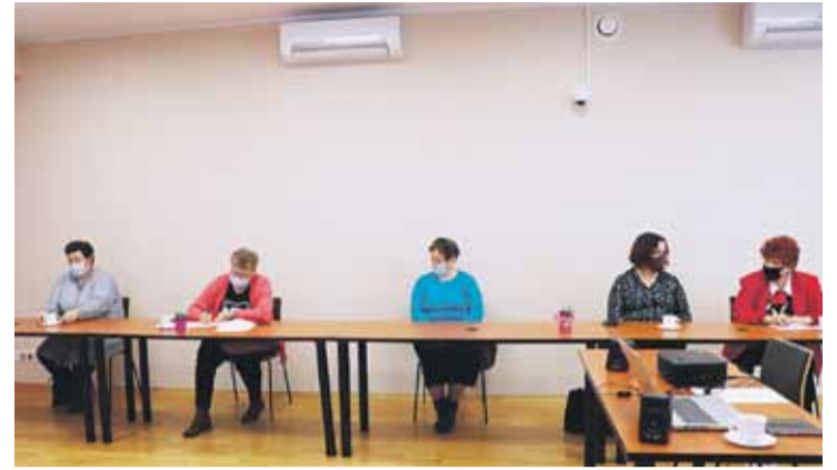
Konferencja organizowana przez Podkarpacki Ośrodek Doradztwa Rolniczego w Boguchwale odbyła się online w Ośrodku Kultury w Soninie