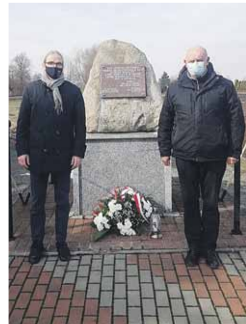
Przedstawiciele Stowarzyszenia Rozwoju Lokalnego „Inicjatywa” w Kosinie w dniu 102. rocznicy Jego śmierci złożyli przy obelisku wiązkę kwiatów i zapalili znicz

14 marca żałobny pociąg przybył do Krakowa, skąd, po oddaniu honorów wojskowych i odprawieniu modłów, skierował się do Rzeszowa. Najmłodszy pułkownik II Rzeczypospolitej został pochowany na cmentarzu Pobitno”. Po latach zbudowano mu grobowiec z marmuru, stylizowany na sarkofag rycerski, z wyrytymi nazwami miejscowości, o które walczył. W Torczynie, w miejscu, gdzie Lis otrzymał śmiertelny postrzał, w 1929 roku odsłonięto monument upamiętniający patrona 23.