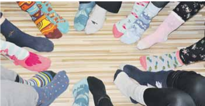
21 marca to tzw. Dzień Kolorowej Skarpetki