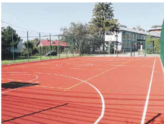
Boisko wielofunkcyjne przy Szkole Podstawowej w Soninie. Przystosowane do gry w koszykówkę, siatkówkę, tenisa ziemnego