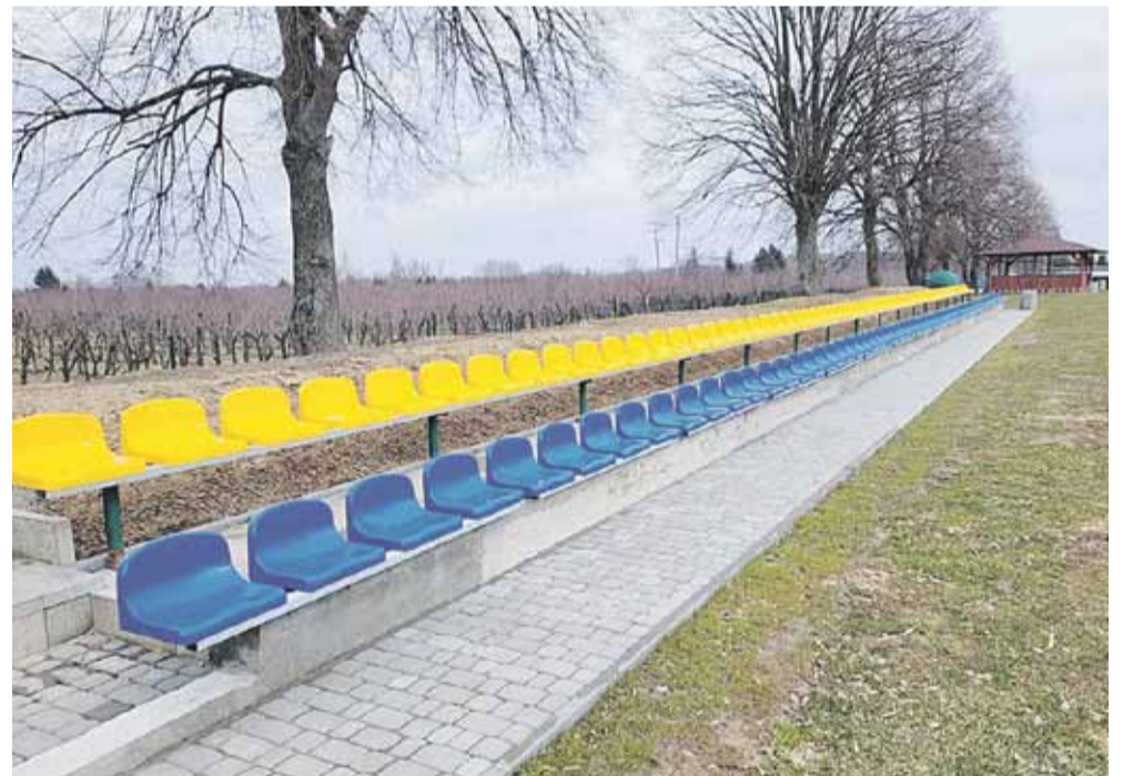
ALBIGOWA Na stadionie LKS Arka Albigowa zakończyła się rozbudowa trybun. Trybuny na chwilę obecną zapewniają łącznie 260 miejsc siedzących. To efekt prac zarządu klubu i wsparcia Gminy Łańcut