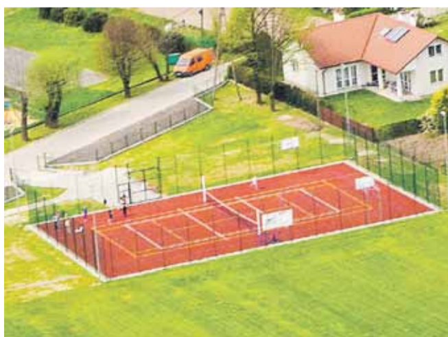
Boisko wielofunkcyjne przy Zespole Szkół w Rogóznie. Przystosowane do gry w koszykówkę, siatkówkę, tenisa ziemnego. Obok znajduje się boisko do piłki nożnej