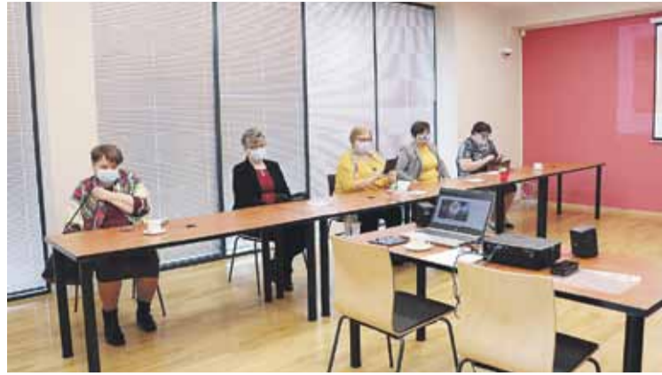
SONINA W marcu przedstawicielki Kół Gospodyń Wiejskich z terenu gminy Łańcut wzięły udział w konferencji „Turystyka i Kulinaria Szansą Na Rozwój Obszarów Wiejskich”