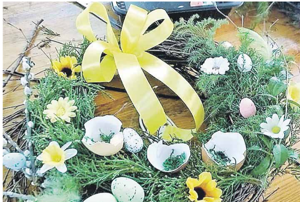
Podczas warsztatów dzieci nauczyły się m.in. robienia takich wiosennych stroików