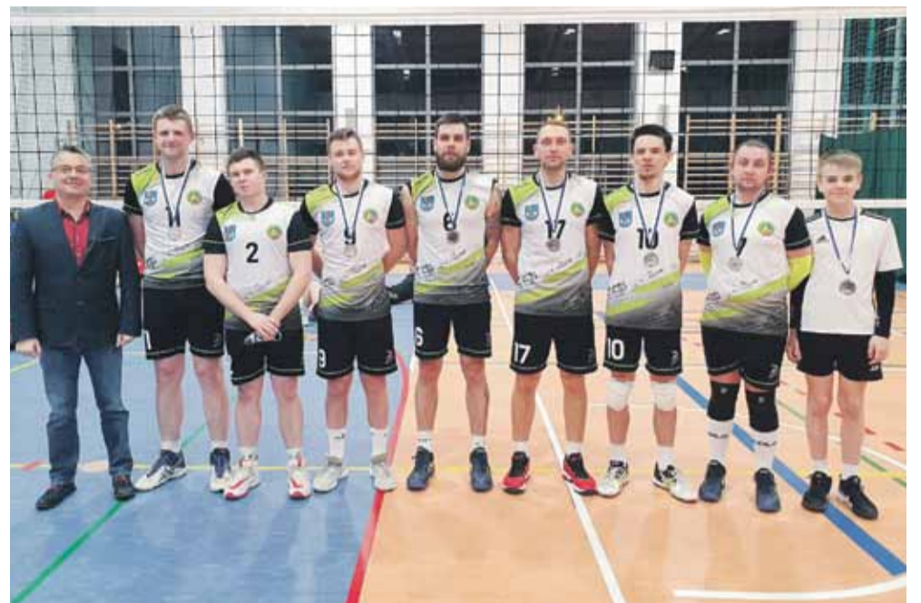
Na rozdaniu medali

przez ostatnie sezony reprezentowali inne kluby siatkarskie z Podkarpacia powróciło do naszego klubu. Wzmocnienia kadrowe oraz bardzo duża motywacja panująca w drużynie spowodowały że jeszcze przed rozpoczęciem rozgrywek cel był jasny - awans. Sezon rozpoczęliśmy meczem z mocnym przeciwnikiem