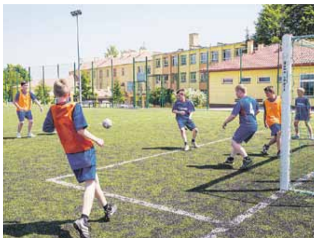
„Orlik” przy Zespole Szkół w Kosinie. Boisko przystosowane do gry w piłkę nożną, obok znajduje się boisko do siatkówki, koszykówki i tenisa ziemnego