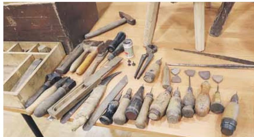
Dawny warsztat szewski

czyszczenia. Jest to urządzenie austro-węgierskie. Szabla to tzw. „halerówka”. W takie szable była wyposażona francuska armia a nazwa wzięta się od generała Hallera.