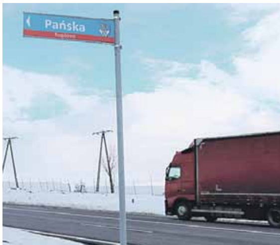
Początkiem ubiegłego roku oznakowanych zostało prawie 90 dróg na terenie gminy Łańcut