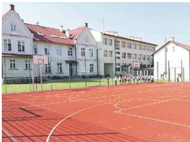
Boisko wielofunkcyjne przy Szkole Podstawowej w Albigowej. Przystosowane do gry w koszykówkę, siatkówkę, tenisa ziemnego oraz w piłkę nożną i ręczną