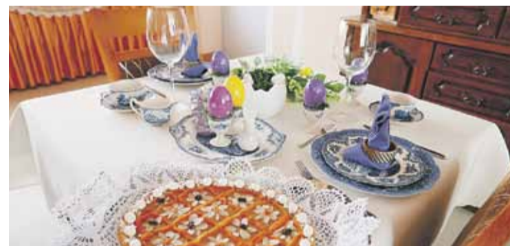
Jedna z propozycji dekoracji świątecznego stołu