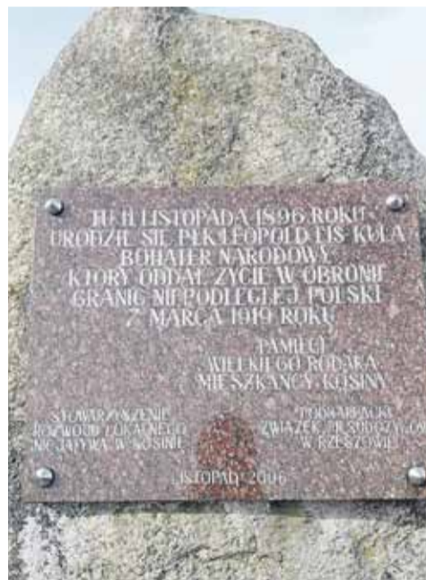
Obelisk upamiętniający płk. Lisa-Kulę znajduje się w Kosinie w miejscu rodzinnego domu bohatera

zmarł. Młoda armia polska straciła jednego z najlepszych swych bohaterów”. Pośmiertnie odznaczony został Krzyżem Virtuti Militari i Krzyżem Niepodległości. „Ciało Leopolda Lisa-Kuli, który tuż przed śmiercią mianowany został podpułkownikiem, przewieziono pociągiem do Warszawy. Trumnę, wśród setek innych, ozdobił wieniec z szarfą: „Memu dzielnemu chłopcu – Józef Piłsudski”. Po mszy żałobnej odbyła się manifestacja patriotyczna na Placu Saskim. W asyście dwóch szwadronów kawalerii, dwóch kompanii piechoty oraz wojskowej orkiestry, dębowa trumna została przewieziona na armatniej lawecie na Dworzec Wiedeński.