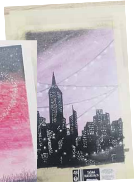
Prace młodej artystki