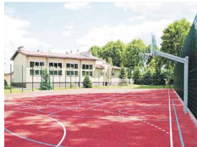
Boisko wielofunkcyjne przy Zespole Szkół w Głuchowie. Przystosowane do gry w koszykówkę, siatkówkę, tenisa ziemnego oraz w piłkę nożną i ręczną