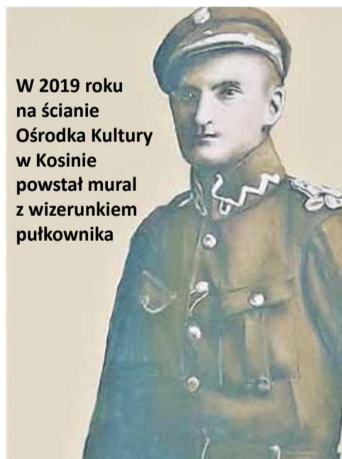
W 2019 roku na ścianie Ośrodka Kultury w Kosinie powstał mural z wizerunkiem pułkownika

Świsnęła mała kula I grób wyryła mu, Bohaterowi łożę, Postanie wieczne lwu. Rycerski pędził żywot, Rycerski znalazł zgon; Armaty mu dzwoniły, A nie żałobny dzwon(...)