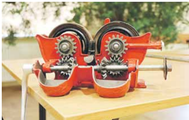
Przyrząd do czyszczenia szabli. Robiło się to po to, by szable nie rdzewiały