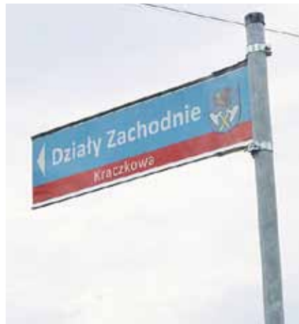
Planowany termin montażu nowych tabliczek to druga połowa 2021 roku