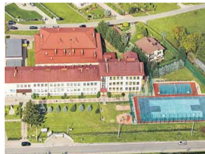
Boisko wielofunkcyjne przy Szkole Podstawowej w Kraczkowej. Przystosowane do gry w koszykówkę, siatkówkę, tenisa ziemnego oraz w piłkę nożną