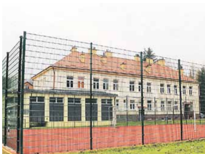
Boisko wielofunkcyjne przy Zespole Szkolno-Przedszkolnym w Handzlówce. Przystosowane do gry w koszykówkę, siatkówkę, tenisa ziemnego oraz w piłkę ręczną i nożną