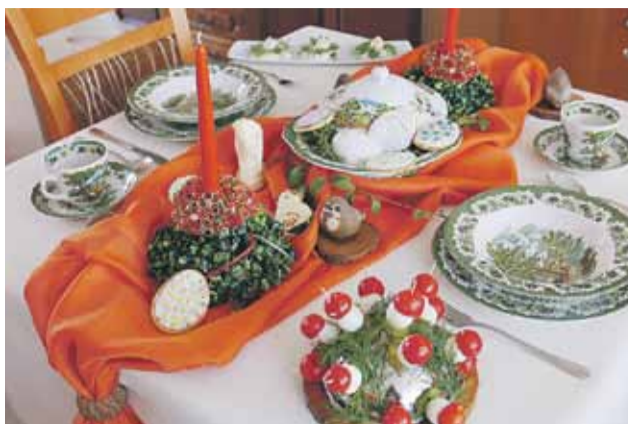
Piękne dekoracje wykonane przez uczniów mogą być źródłem inspiracji