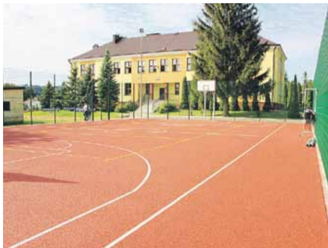
Boisko wielofunkcyjne przy Zespole Szkół w Cierpiszu. Przystosowane do gry w koszykówkę, siatkówkę, tenisa ziemnego