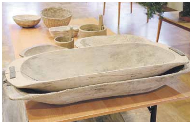
Dawne niecki i koszyki wiklinowe

W kolejnym filmiku, który można obejrzeć na kanale CKGŁ zaprezentowane są dawne niecki do zarabiania ciast. - W związku z tym, że dawniej nie było garnków i misek takich jak dziś – używano się takie niecki. W nich mieszało się mąkę i zarabiano ciasta. Jedno z tych koryt używane było także do parzenia świni – opowiada Kazimierz Bem na filmiku. (BB)